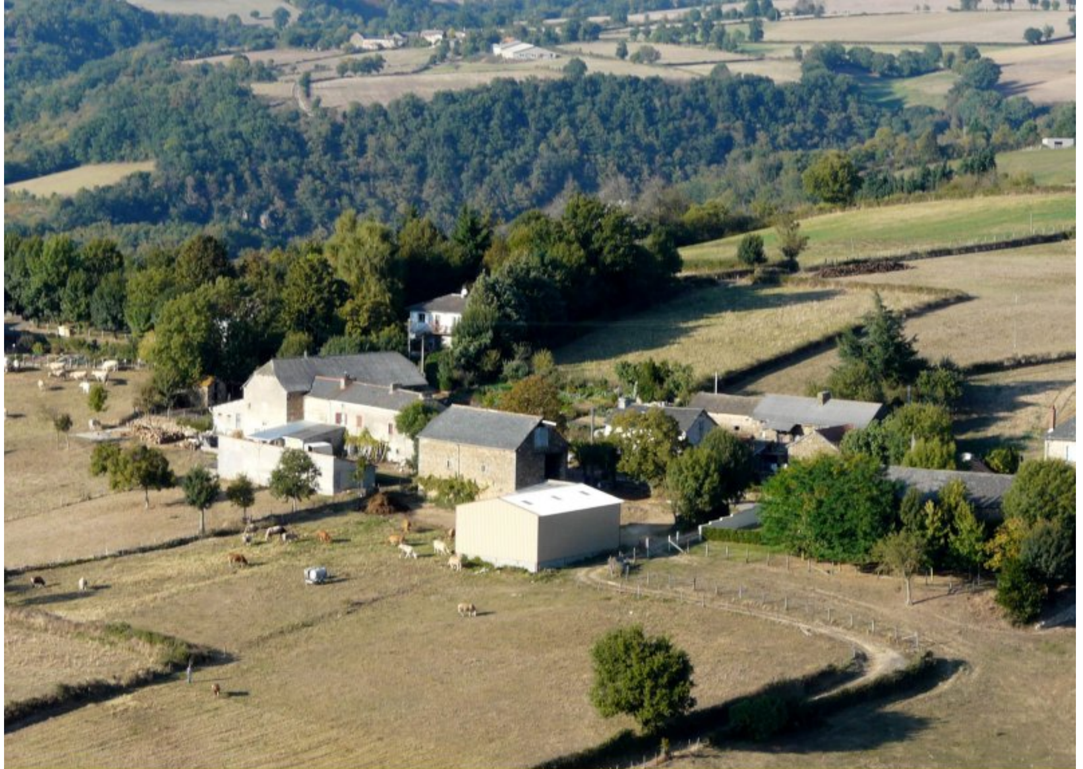
La Tapie - été 2008