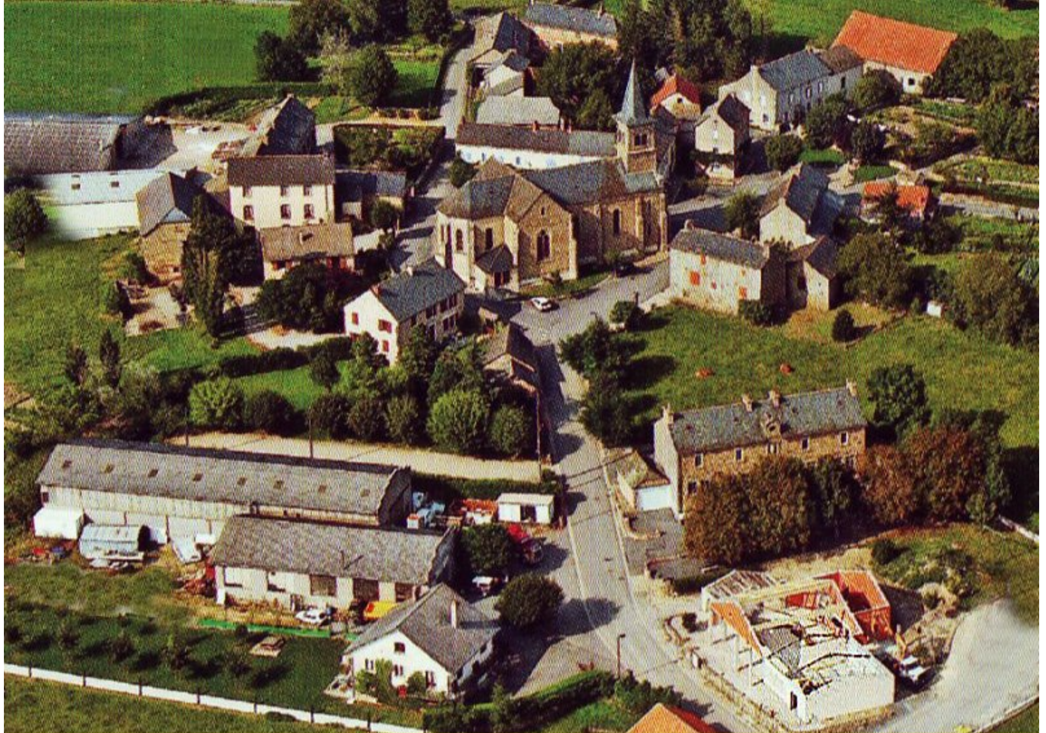
Meljac - Le Bourg - année 2007 (travaux salle des fêtes)