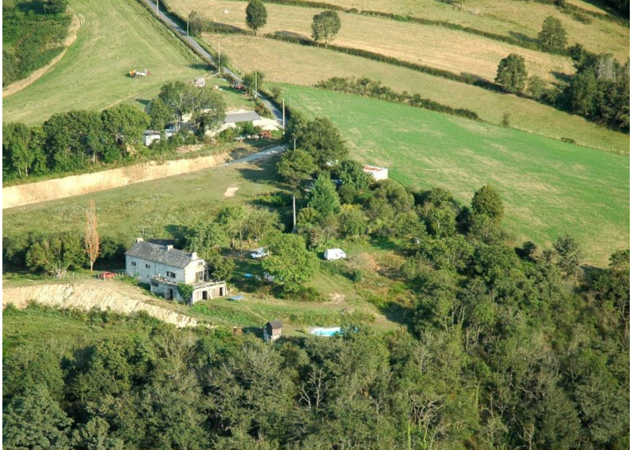
Cabrol août 2007