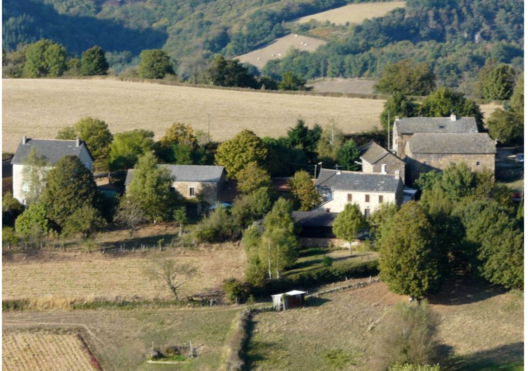
Le Martinesq - maisons Laurent - Barthes J-F - Lebon & Fenoglio - été 2008