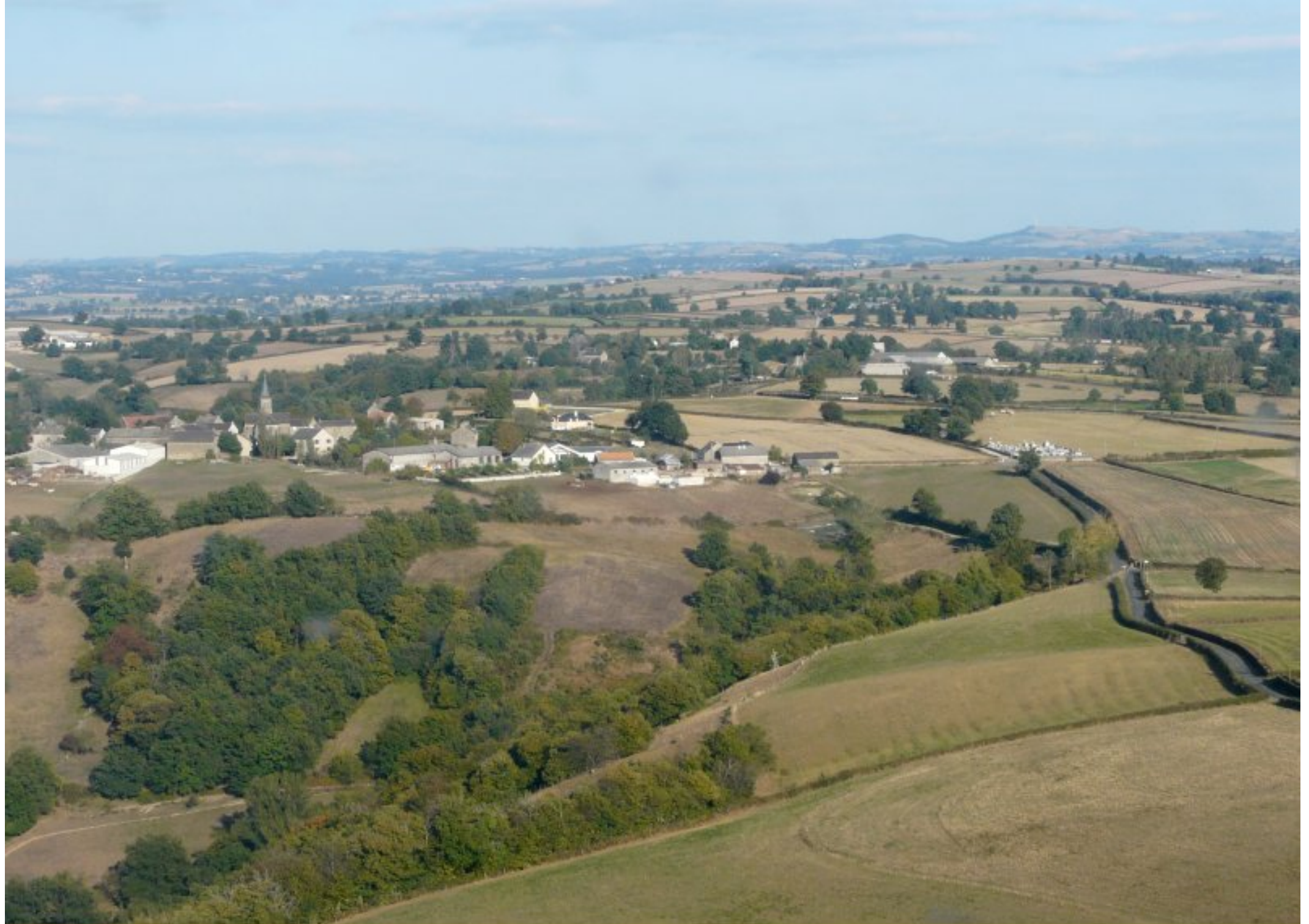
Meljac - vue générale - été 2008