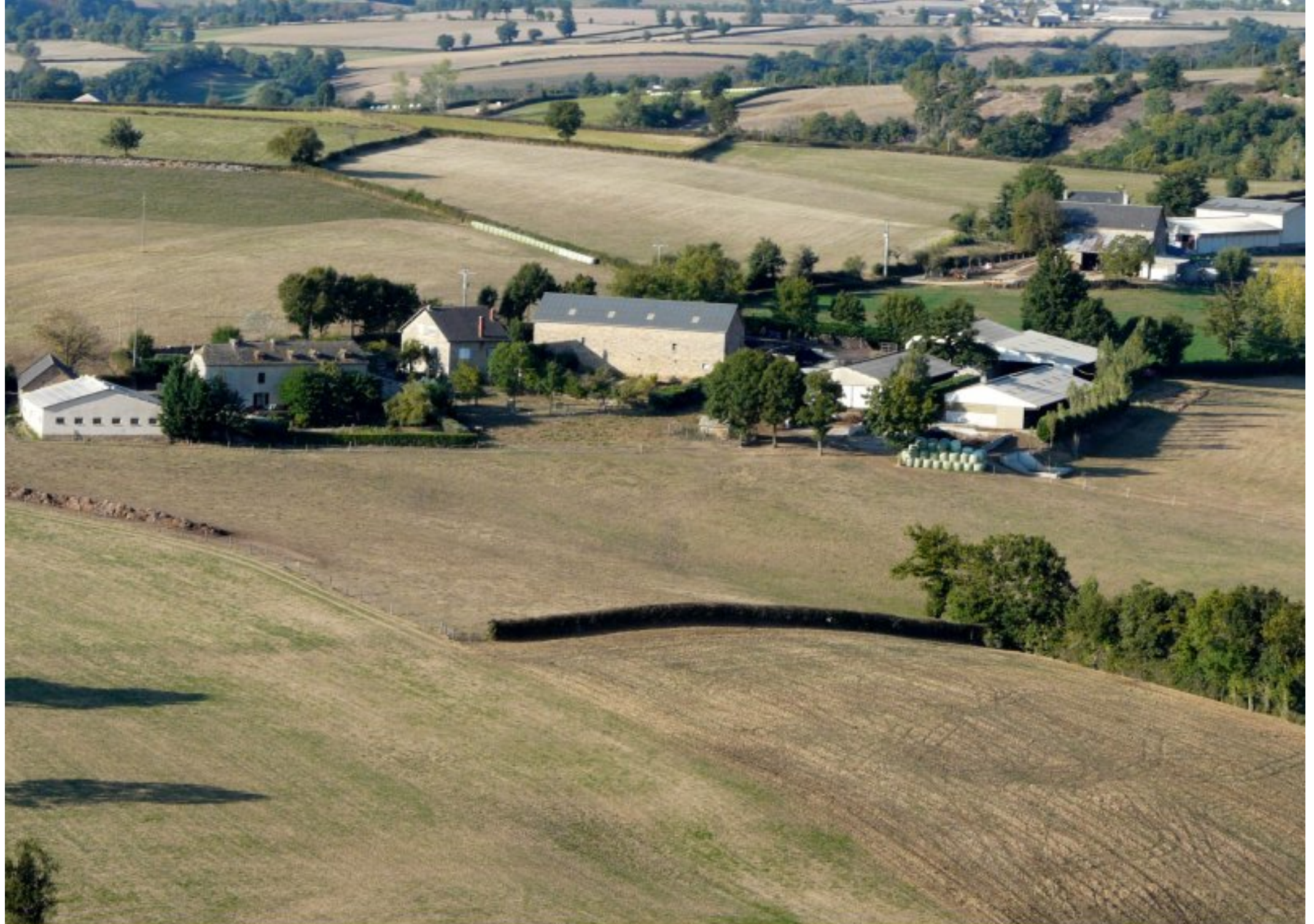
Le Clot & la Tine - été 2008