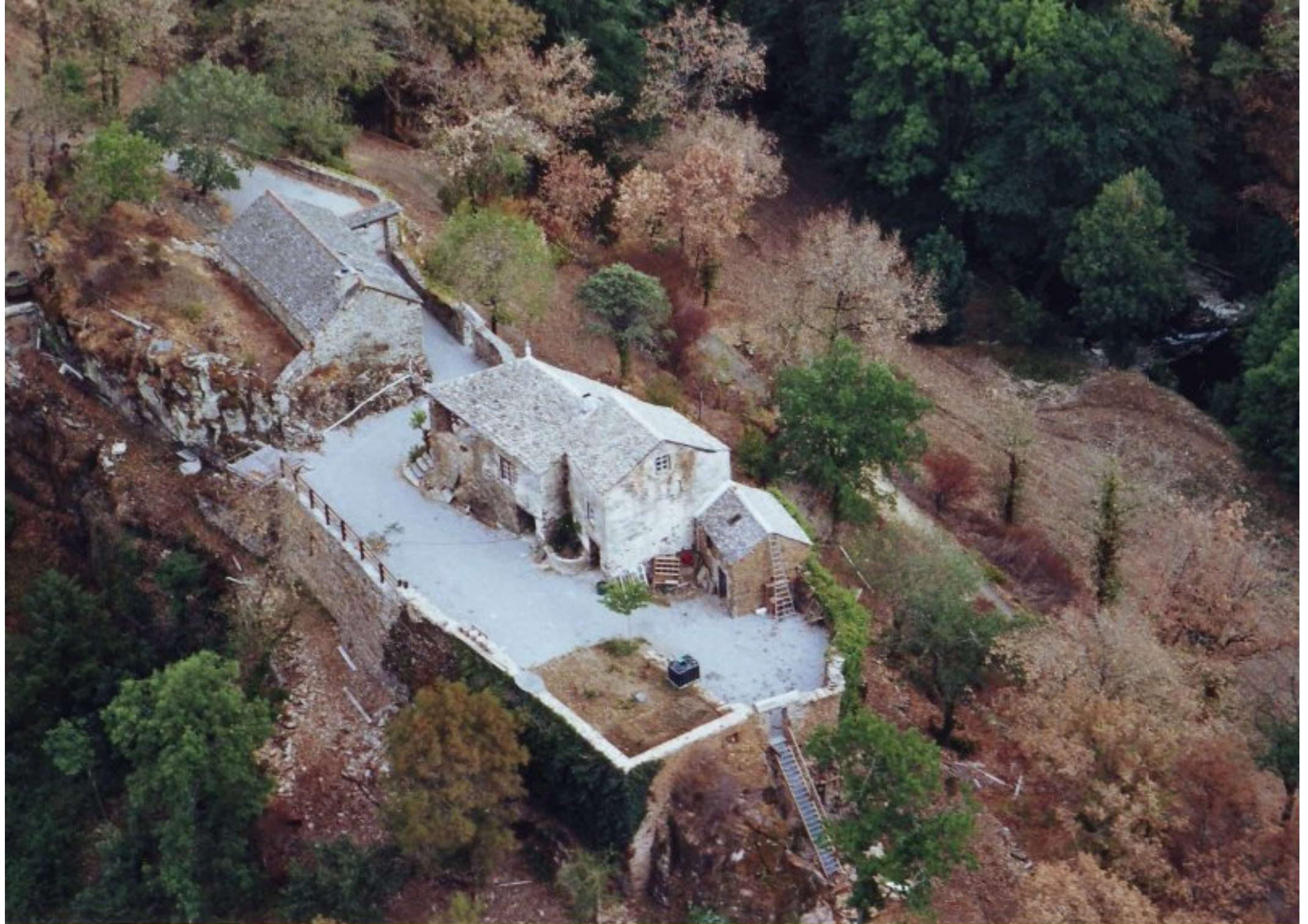
La Bastide - août 2003