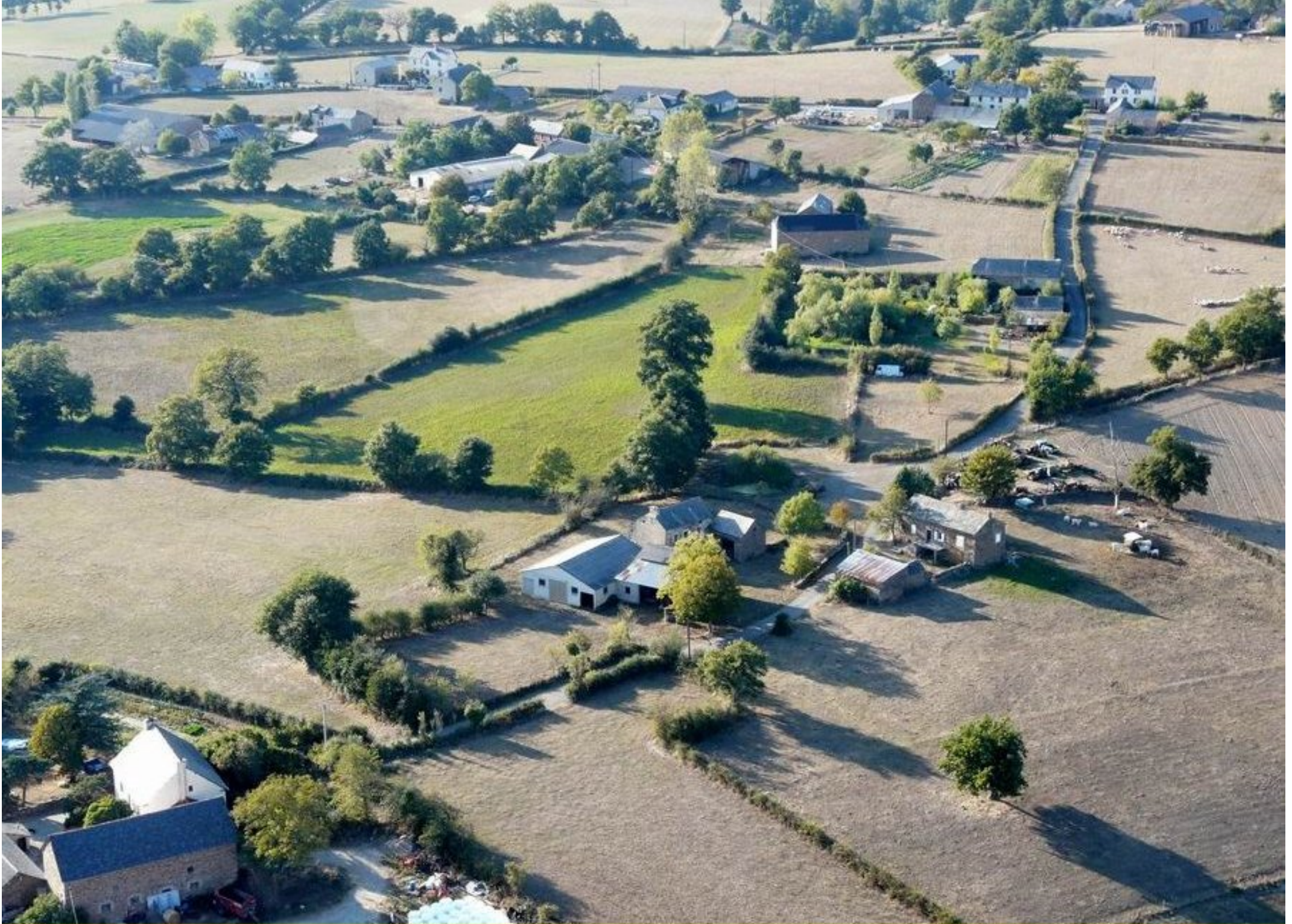
Grascazes - vue générale - été 2008