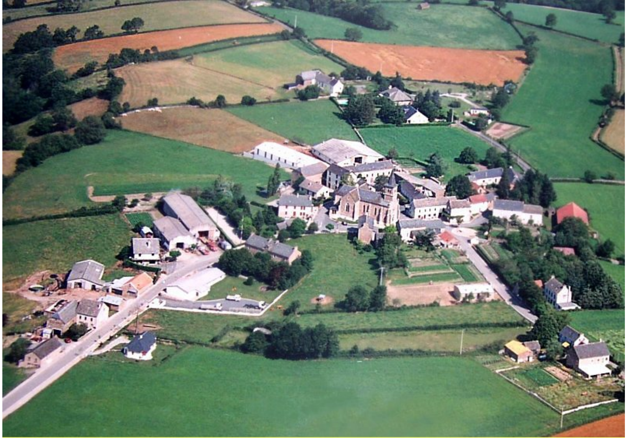
Meljac - Le Bourg - année 2002