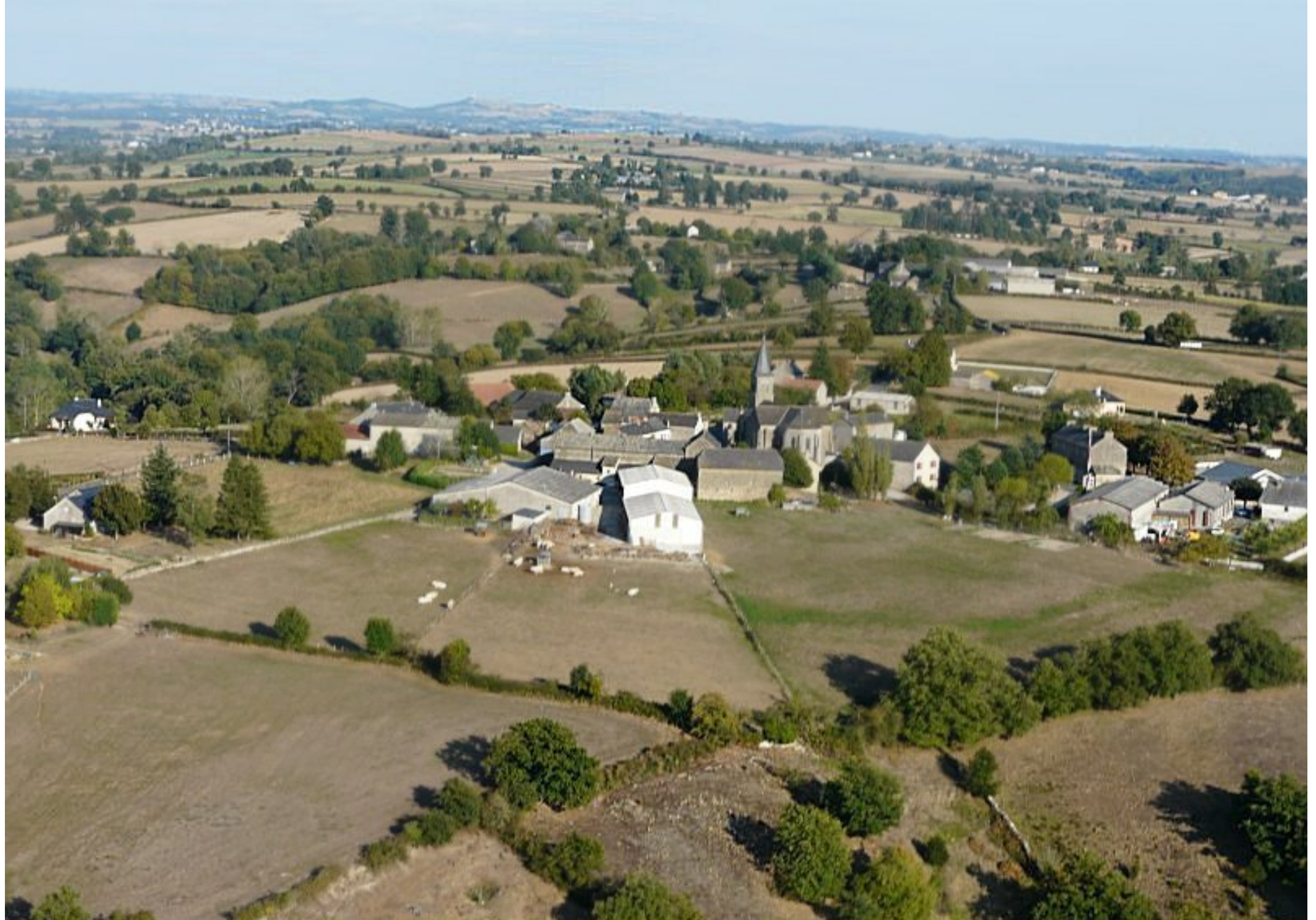
Meljac - vue générale sur la Bourg - année 2008