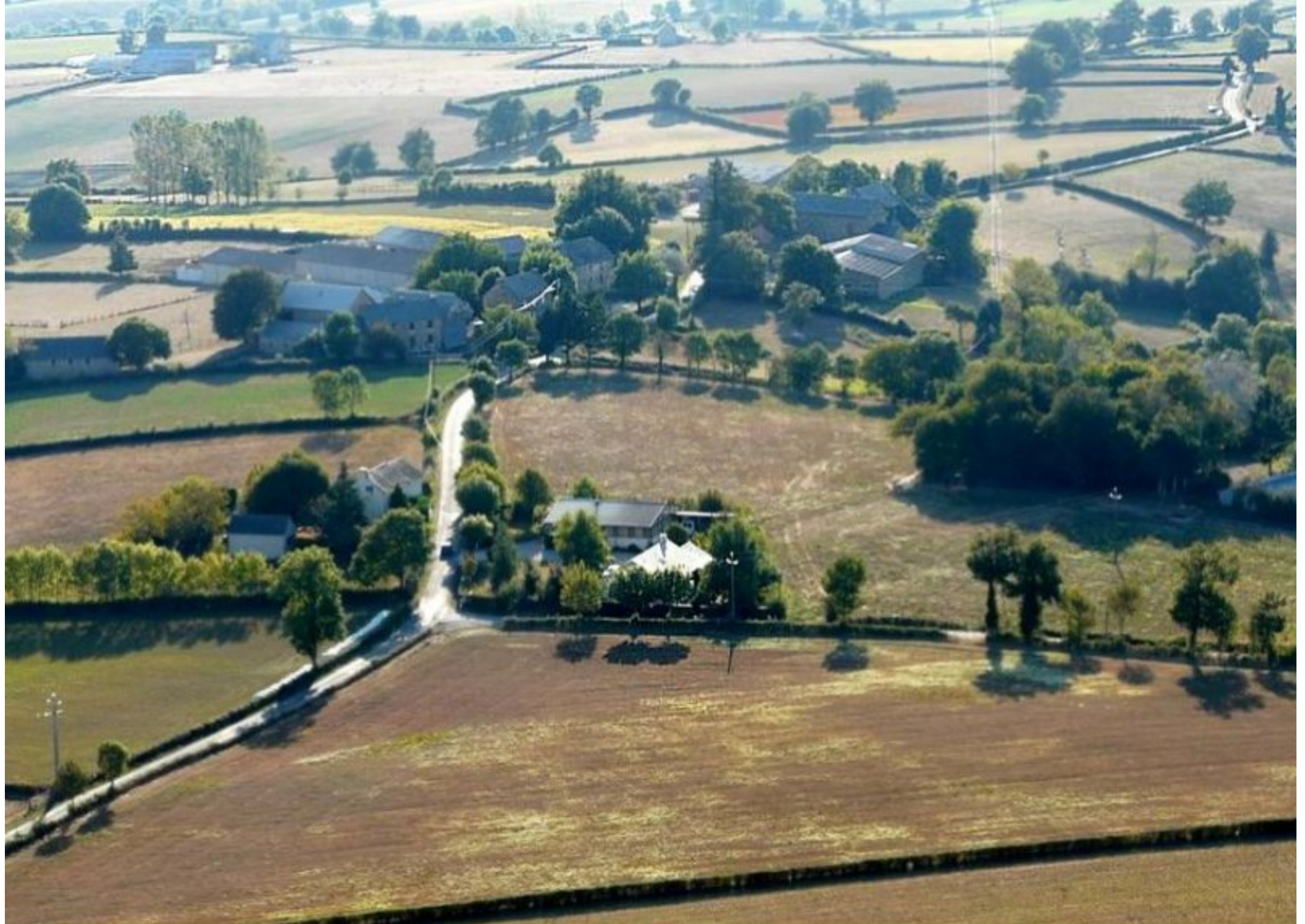
Le Mas Ricard - été 2008