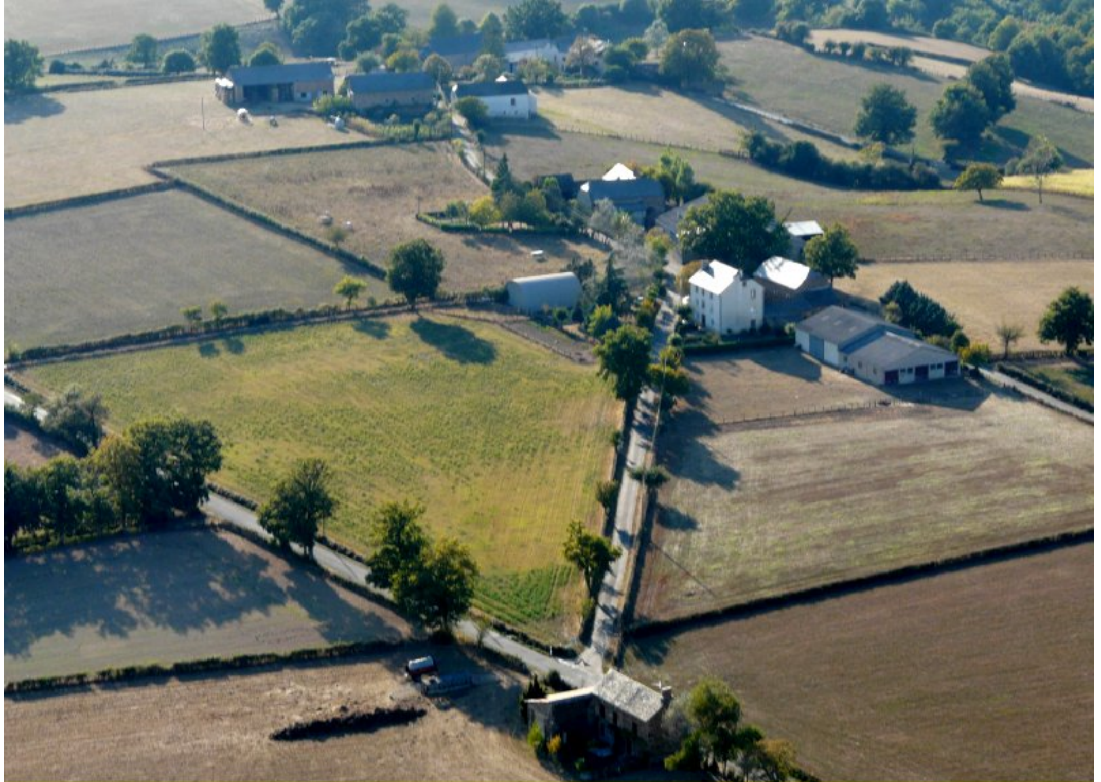
Le Féraldesq & le Cap Fourquet - été 2008