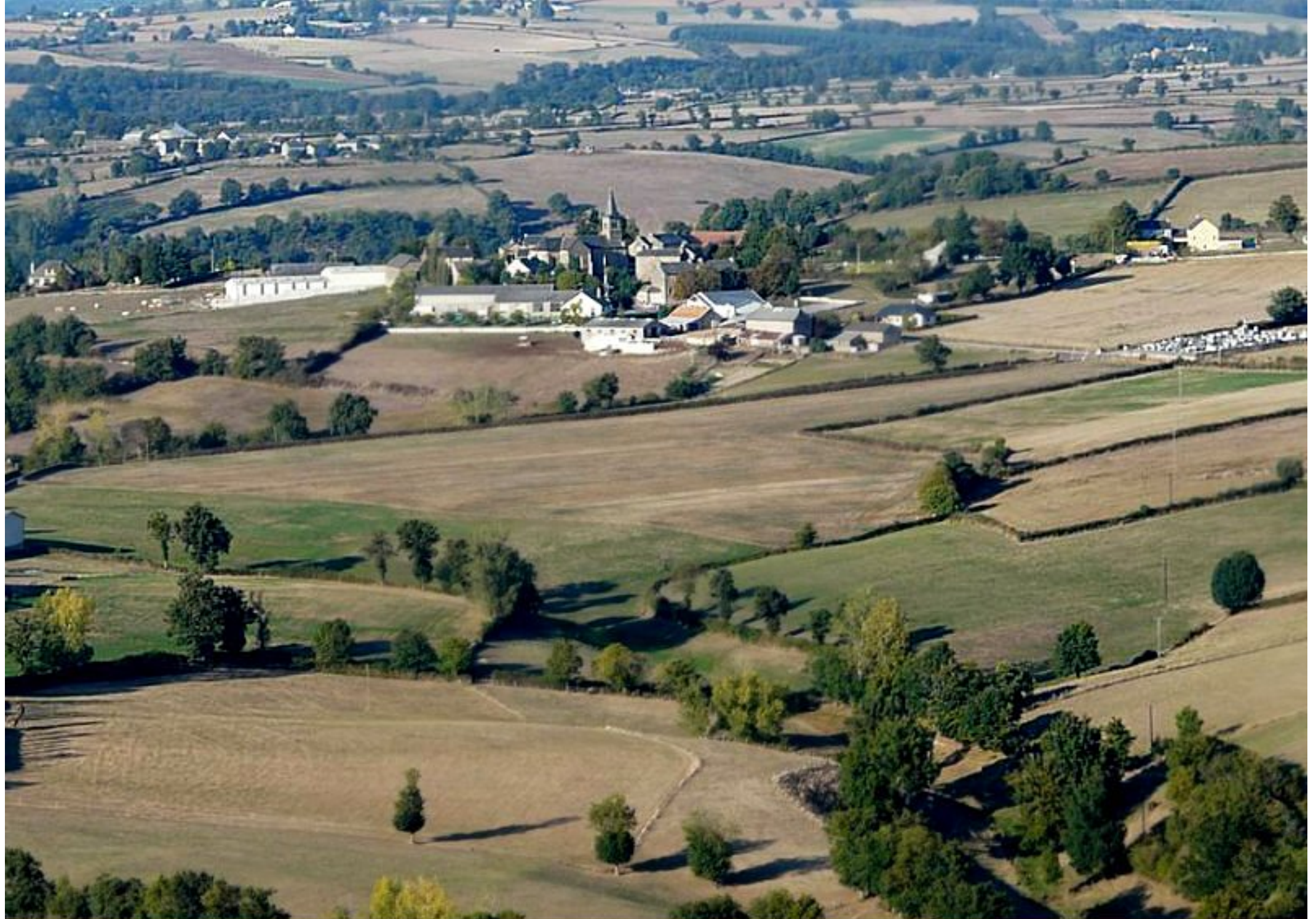
Meljac - Le Bourg - année 2008