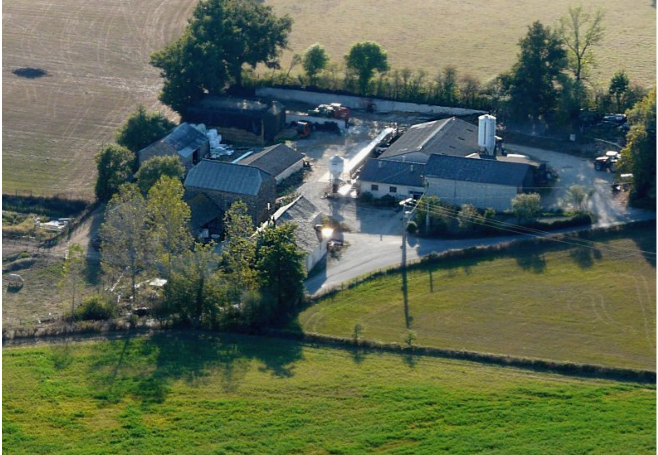
Le Mas Ricard - ferme Guy Enjalbert - été 2008