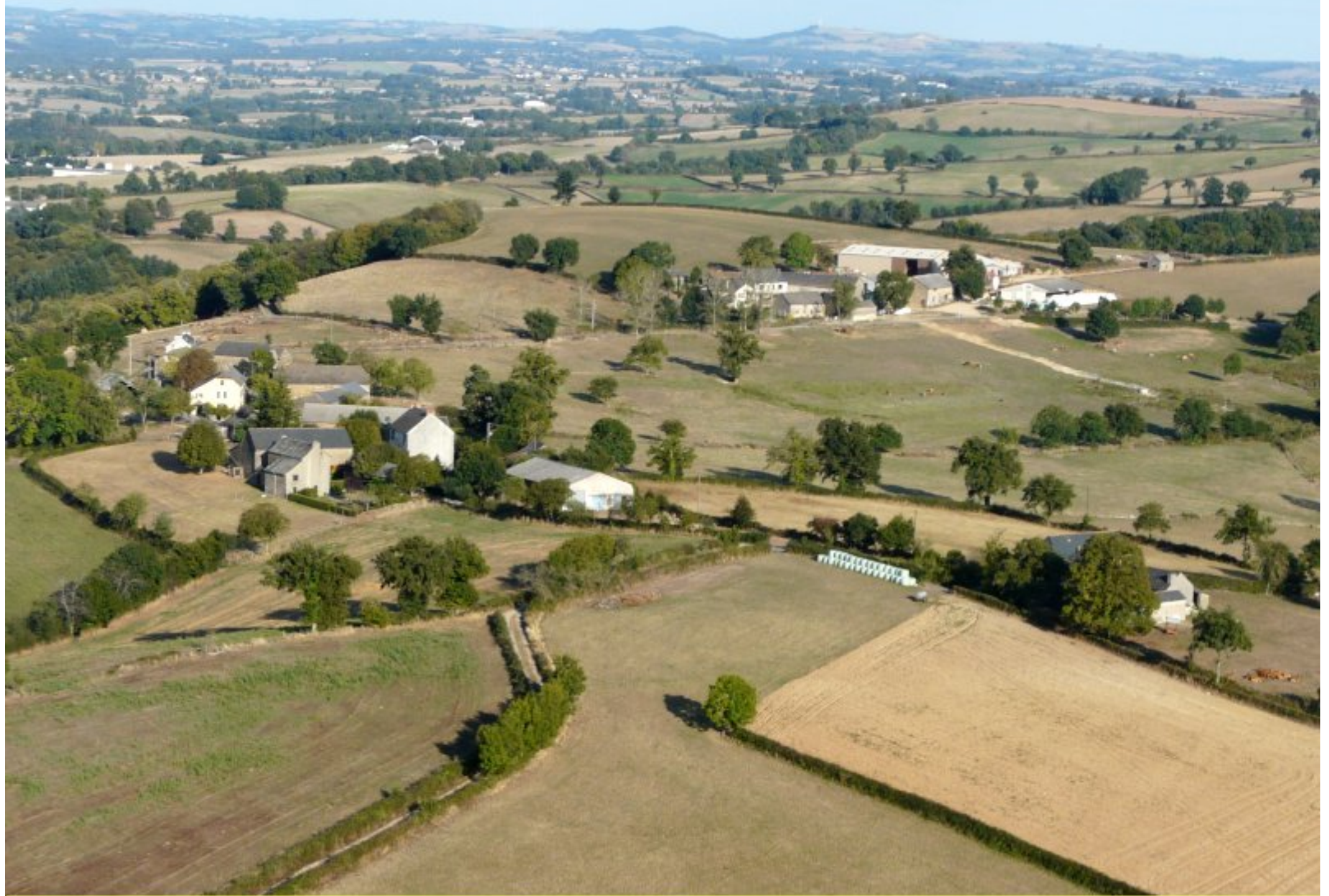
Le Puech Issaly - été 2008