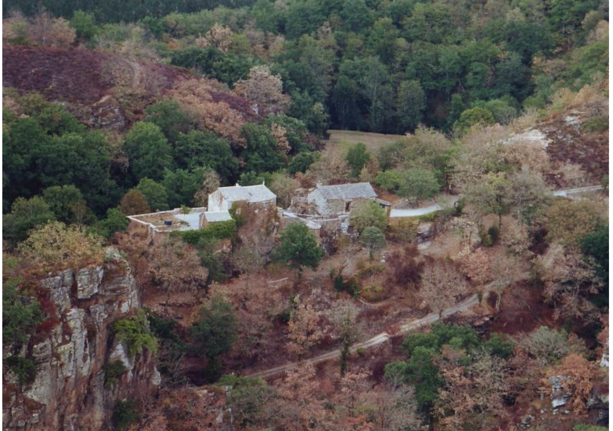
La Bastide - août 2003