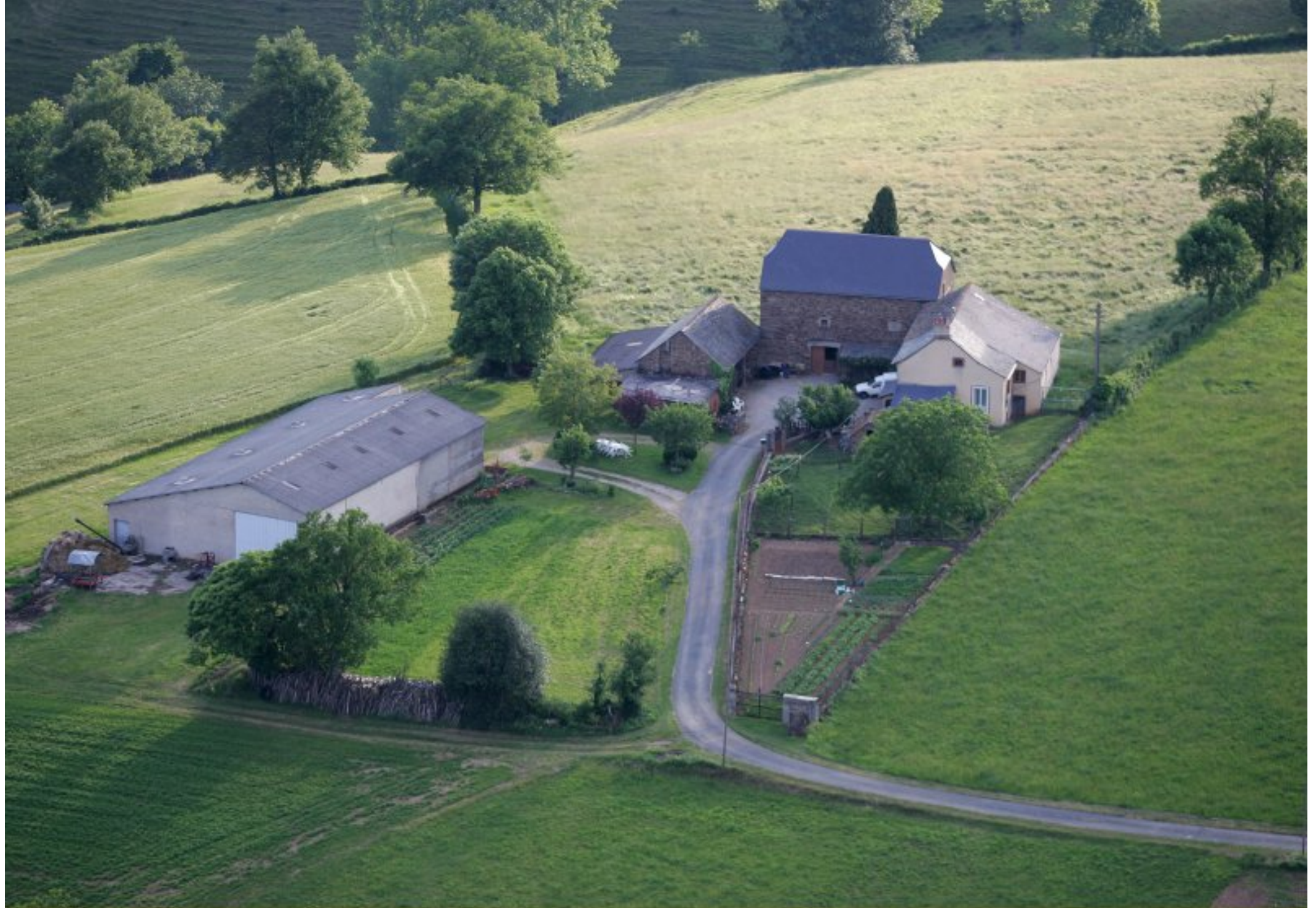
Meljac vu du ciel - les Hameaux - ferme Odile & Georges Bousquet au Pouget - juin 2010