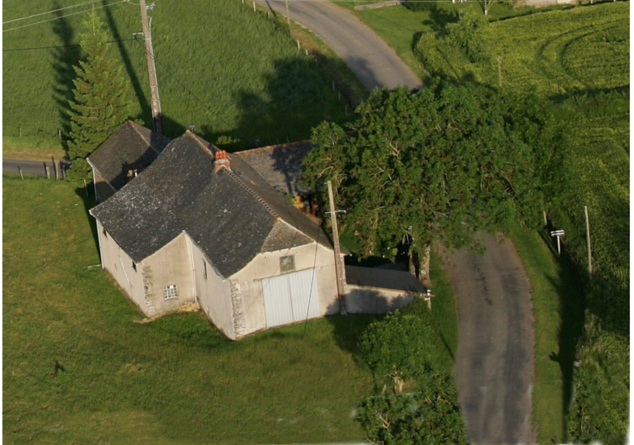
Meljac vu du ciel - les Hameaux - maison Rodriguez de Barros/Molinier de la Pierre Blanche - juin 2010