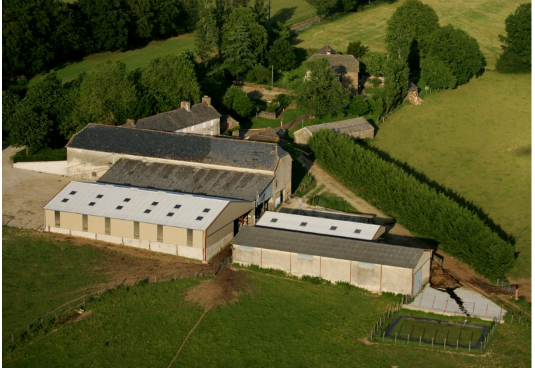
Meljac vu du ciel - les Hameaux - ferme Mazars de la Bessière - juin 2010