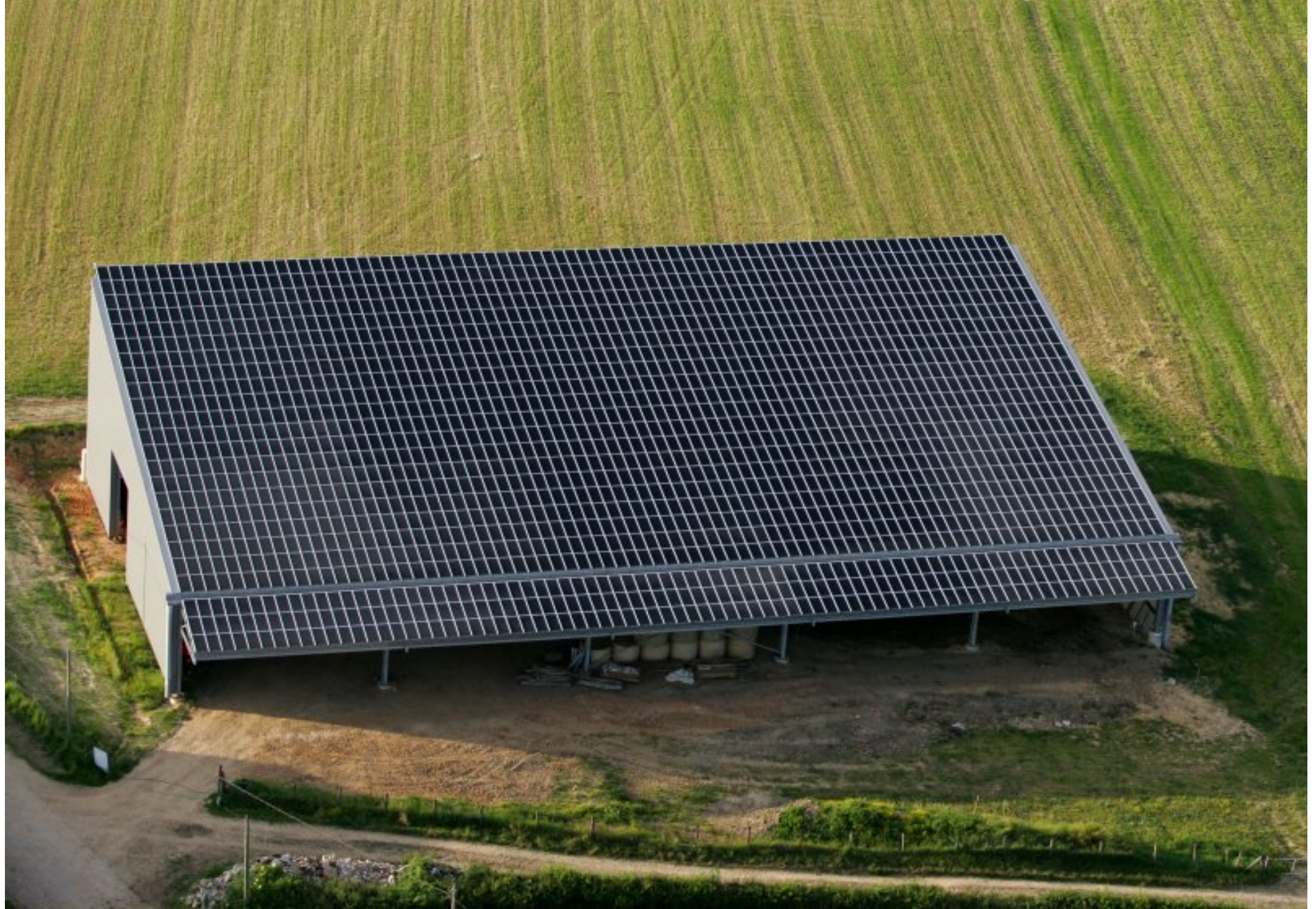
Meljac vu du ciel - les Hameaux - ferme Bosc guy à Soulages - juin 2010 (l'un des 3 hangars à production d'électricité photovoltaïque meljacois construits en 2008-09 également au Clot & au Cluzel)