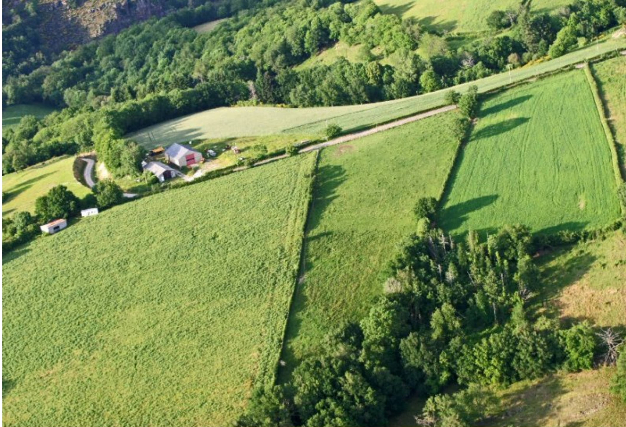
Meljac - vu du ciel - les Hameaux - la descente vers Cabrol le Vergnas - juin 2010 (à gauche les ateliers JPM - musée des machines agricoles anciennes)