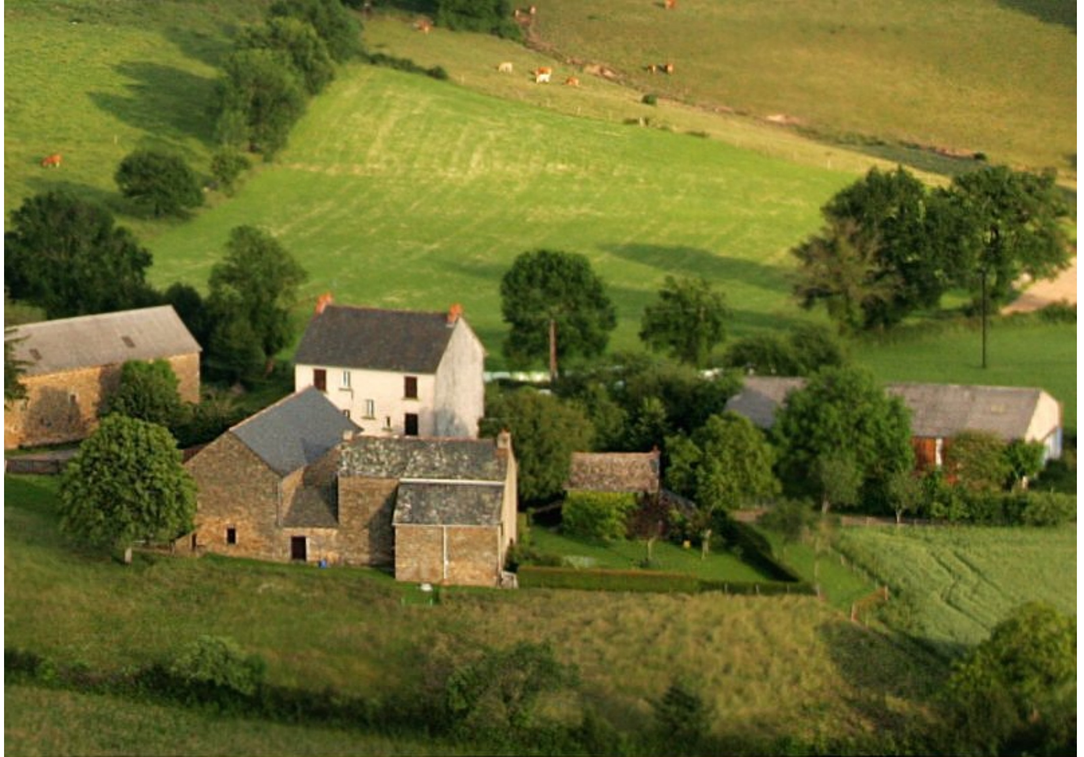
Meljac vu du ciel - Le Puech Issaly: maisons & anciens bâtiments de ferme Bosc-Azam-Loubière & Lacan-Gaben - juin 2010