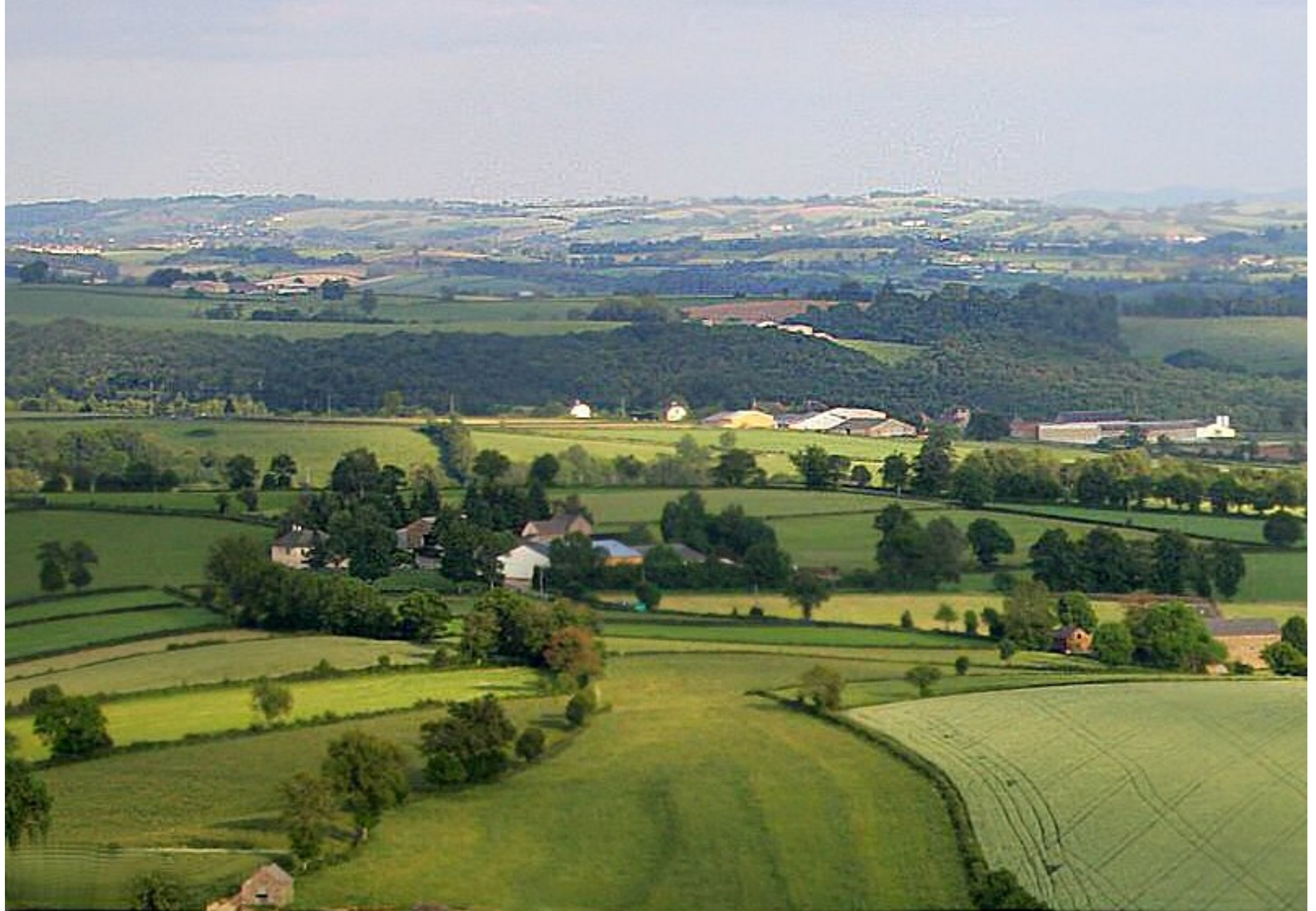
Meljac vu du ciel - les Hameaux - en venant de Centrès vers Rullac - juin 2010 au 1er plan, la Laurentie & le Puech Neuf - à l'arrière, Rullaguet