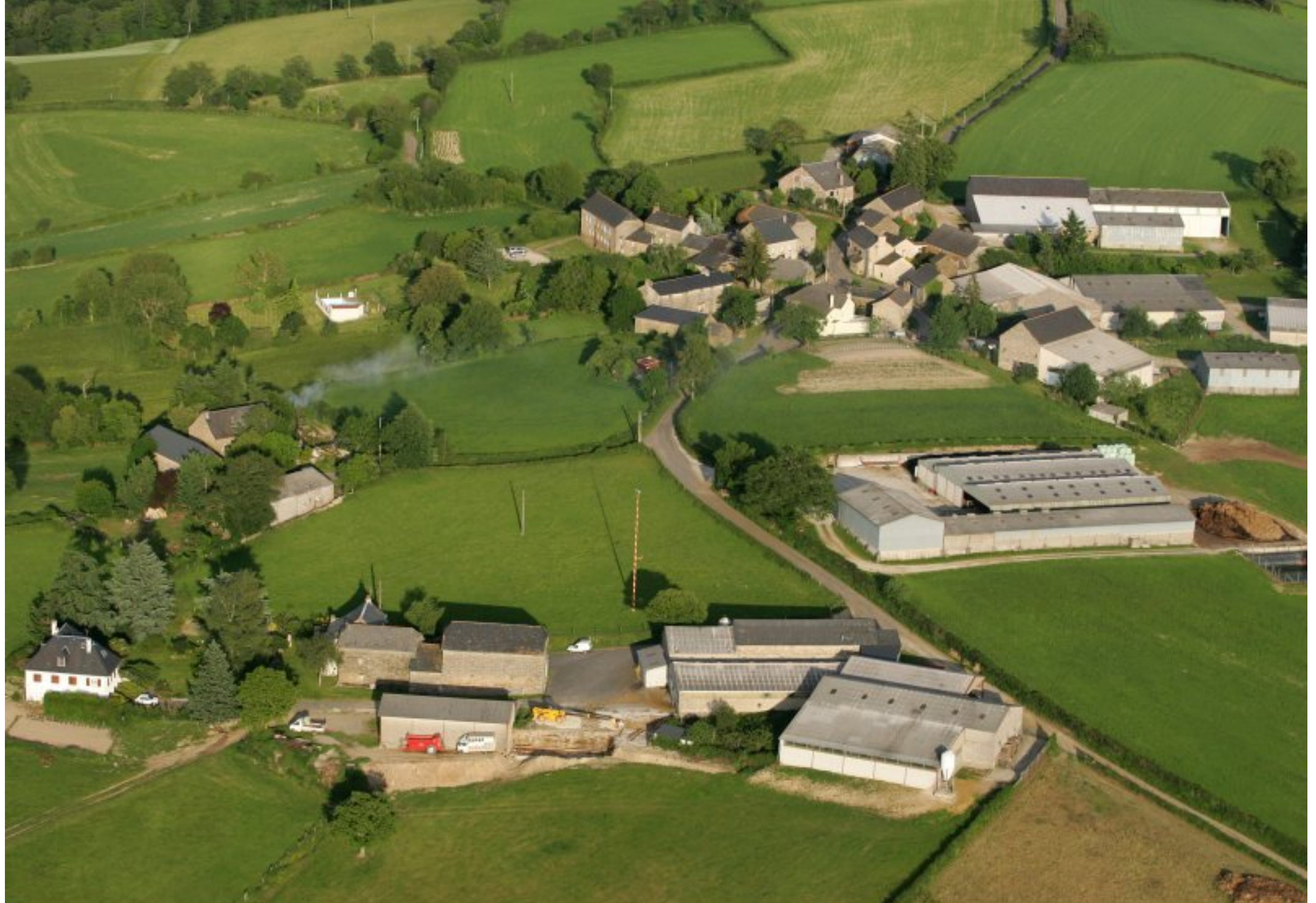
à proximité nord-est de Meljac - vu du ciel - le hameau de Rouffenac (commune de Rullac) - juin 2010