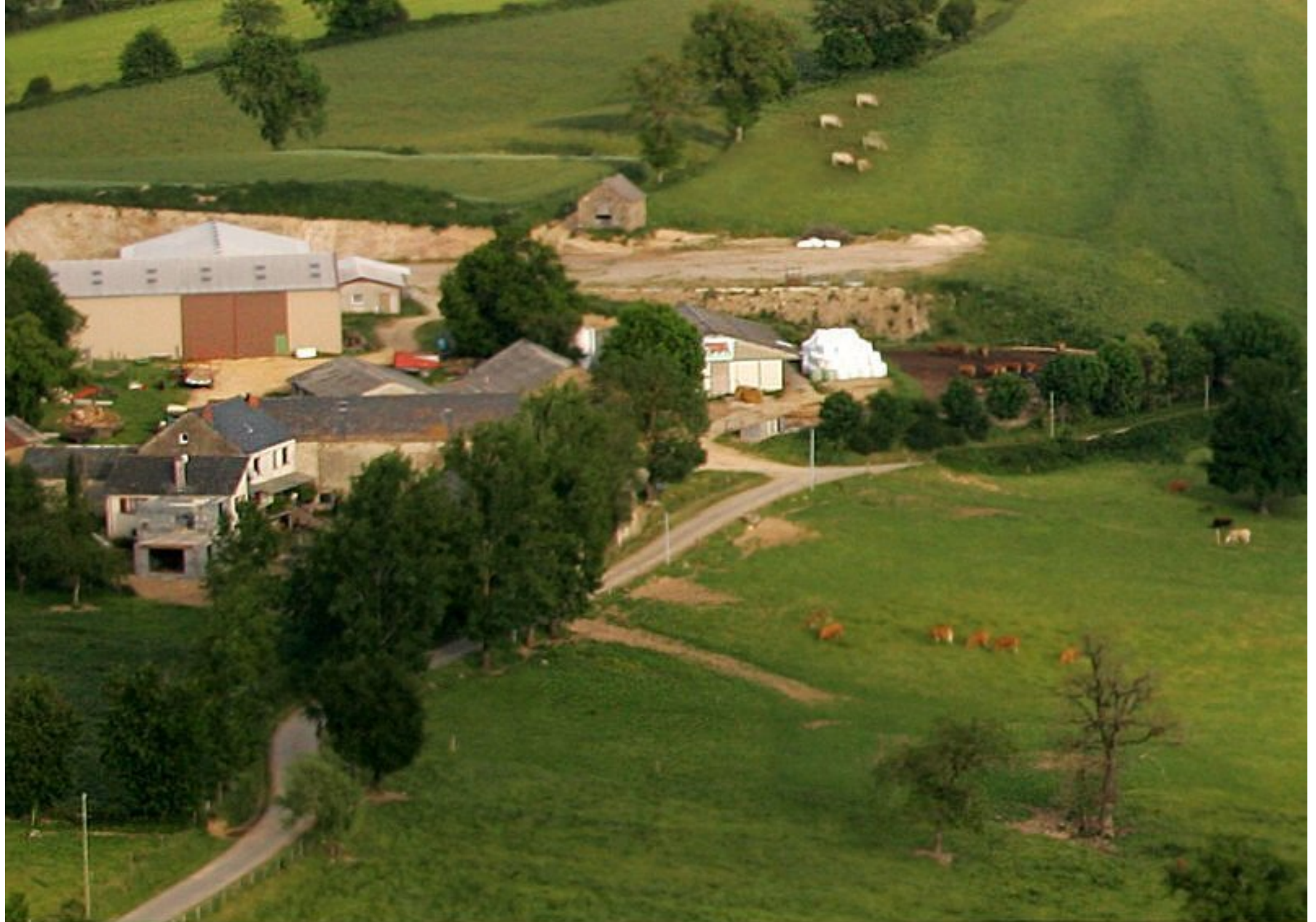
Meljac vu du ciel - les Hameaux - ferme Albinet Henri au Puech Issaly - juin 2010