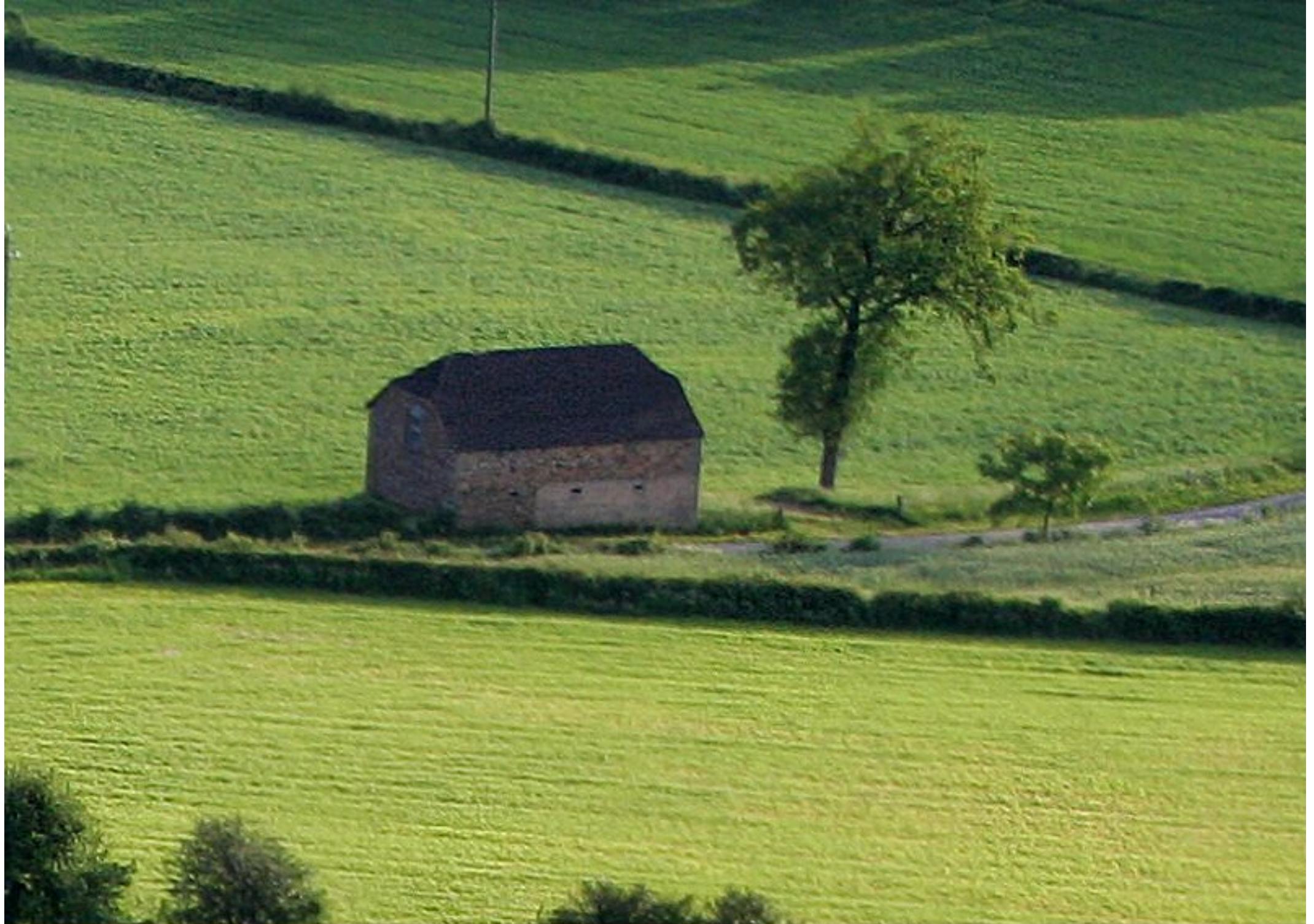
Meljac vu du ciel - les Hameaux - la jaça de Bonal d'Henri Albinet du Puech Issaly au Mas Ricard - juin 2010