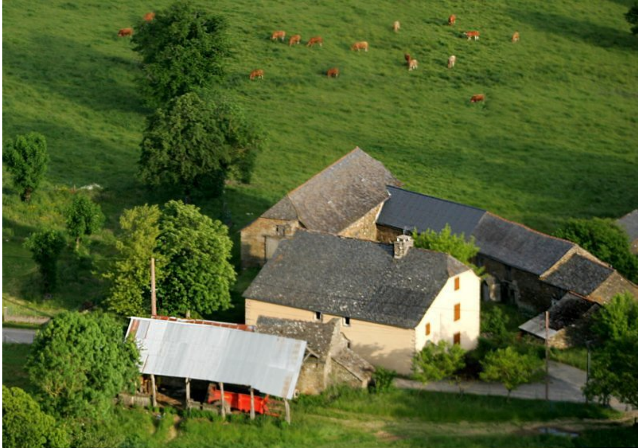
Meljac vu du ciel - les Hameaux - ferme Gérard Enjalbert au Puech Issaly - juin 2010