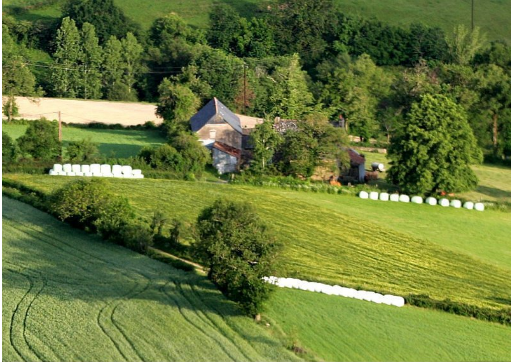
Meljac vu du ciel - ferme Hervé Albinet de la Tine (ancienne propriété Philou Enjalbert) au Puech Issaly - juin 2010