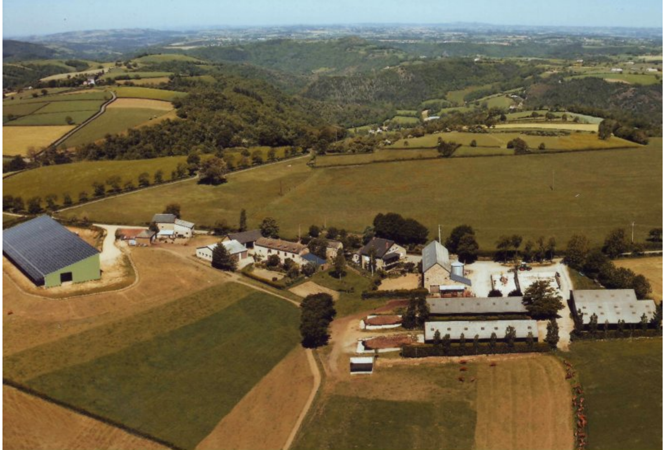
Meljac vu du ciel - les Hameaux - ferme Capoulade-Gaubert du Clot - 2010

à droite sur la photo, l'un des 3 hangars à production photovoltaïque meljacois construits en 2008-09, également au Cluzel et à Soulages