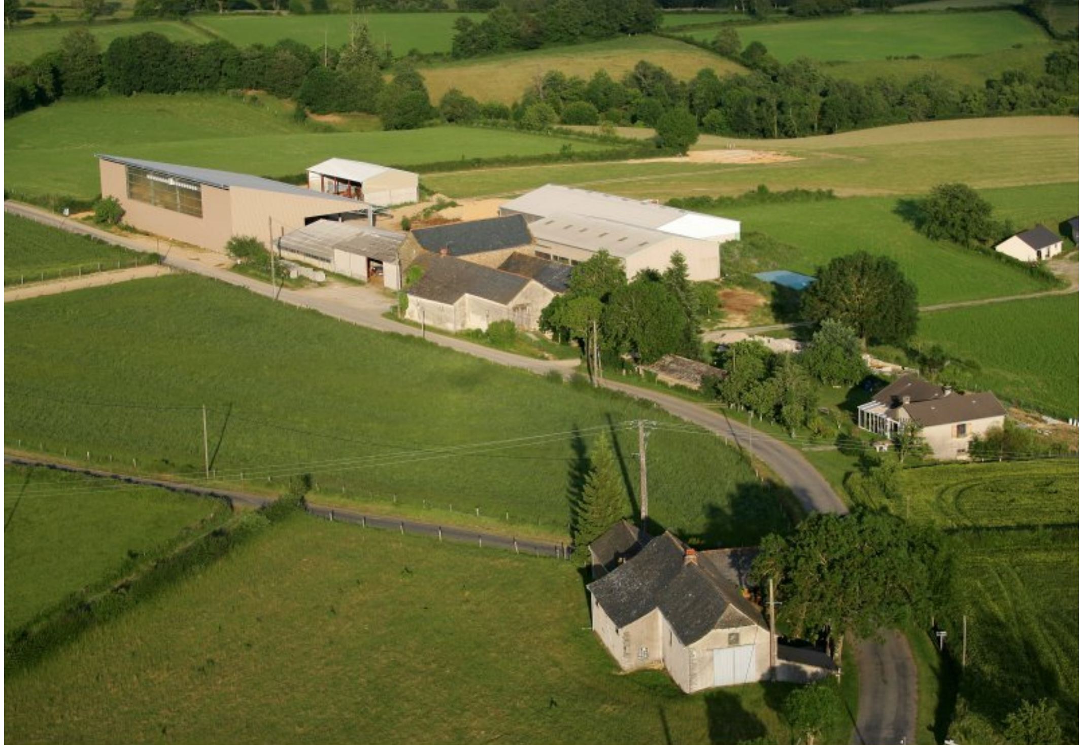
Meljac vu du ciel - au 1er plan la Pierre Blanche (maison Rodriguez de Barros), au 2ème, le Cluzel (ferme Baudy-Tayac) - juin 2010 à droite sur la photo, l'un des 3 hangars à production d'électricité photovoltaïque meljacois construits en 2008-09 également au Clot & à Soulages