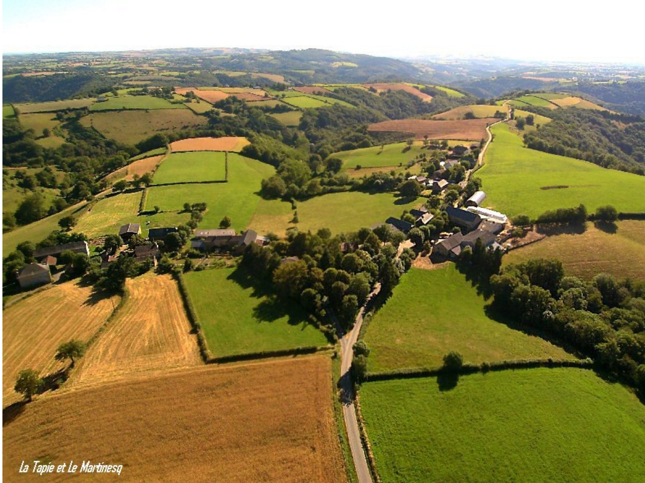
La Tapie et Le Martinesq