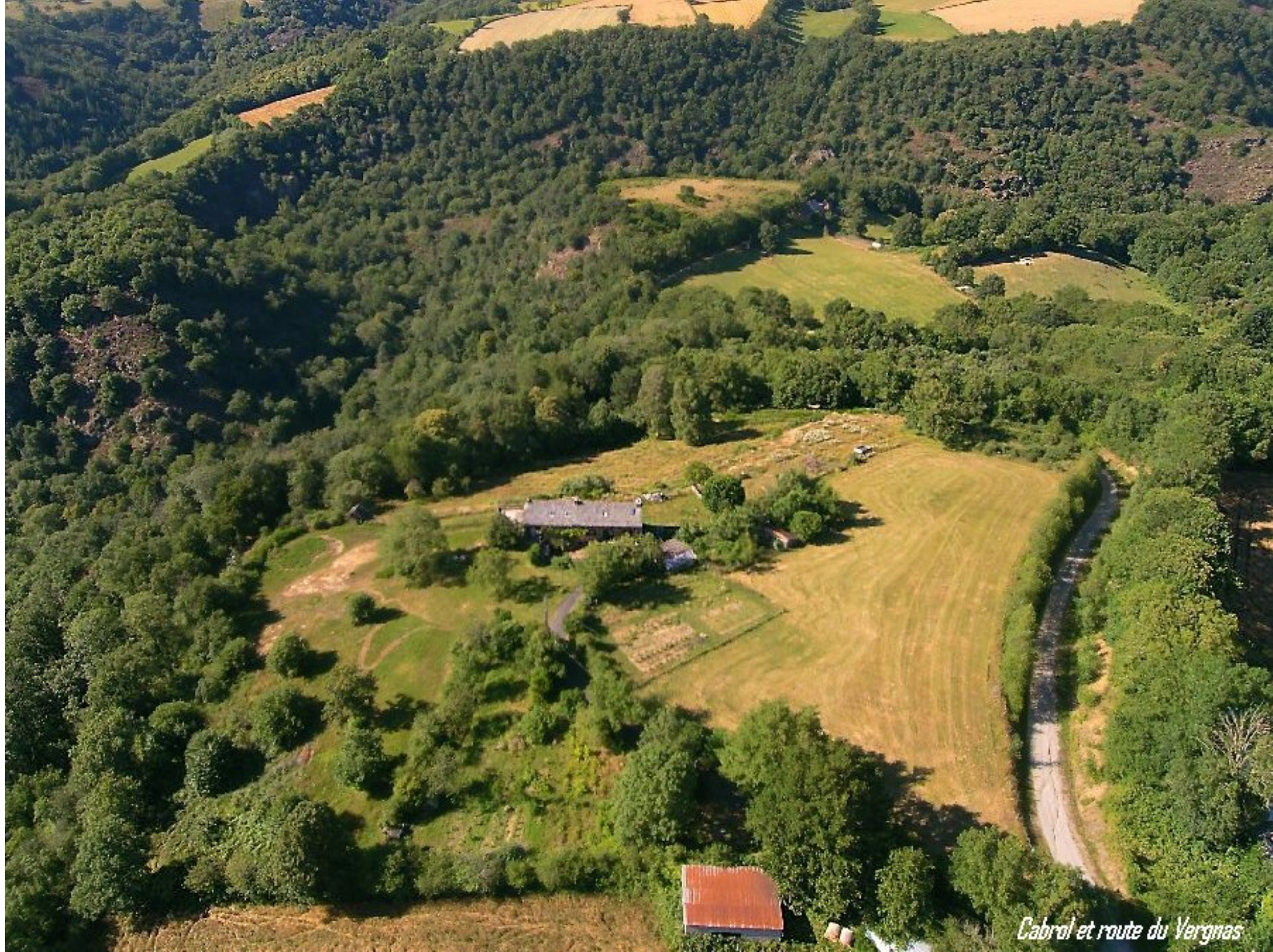
Cabrol et route du Vergnas