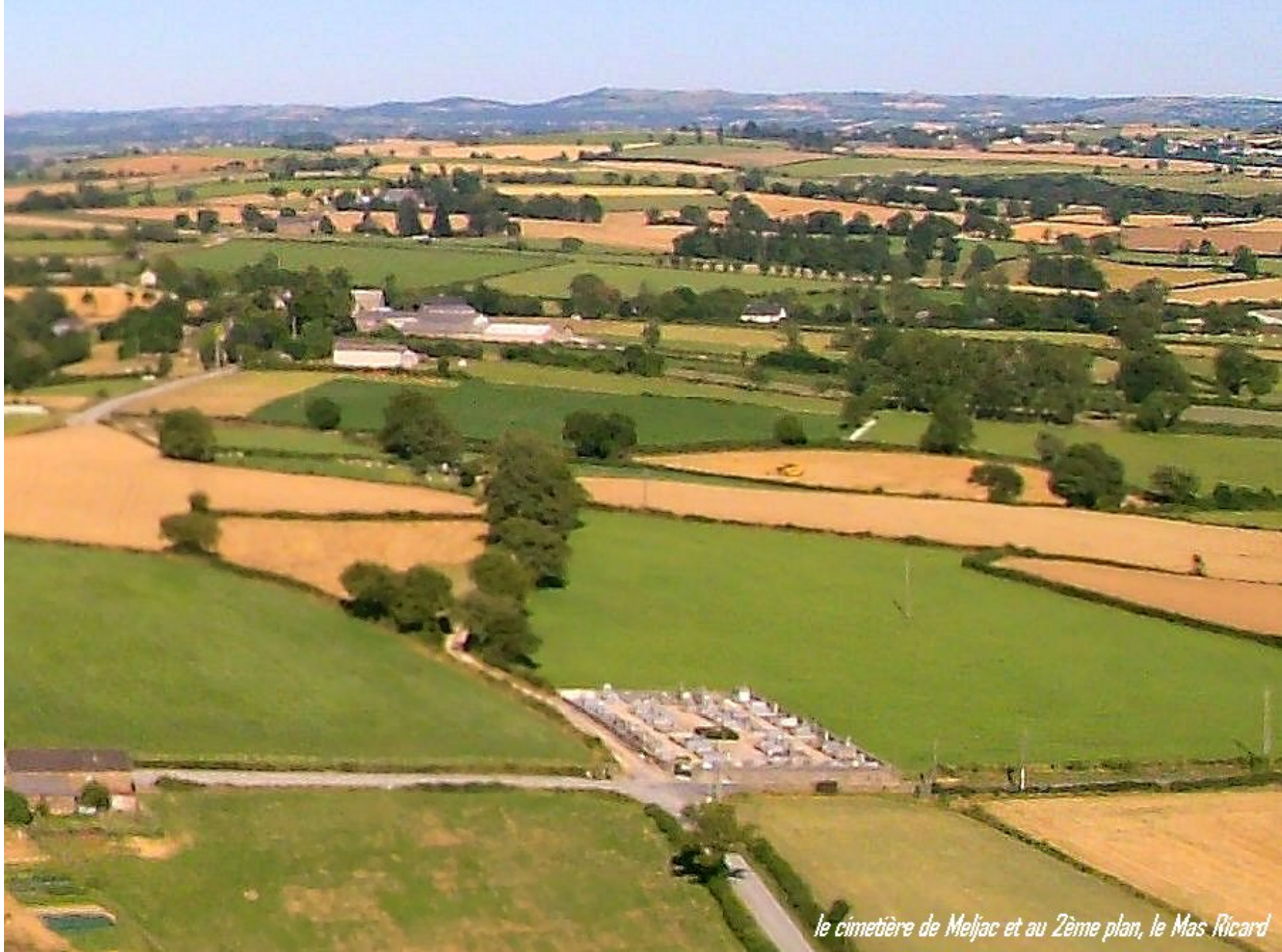
le cimetière de Meljac et au Zème plan, le Mas Ricard