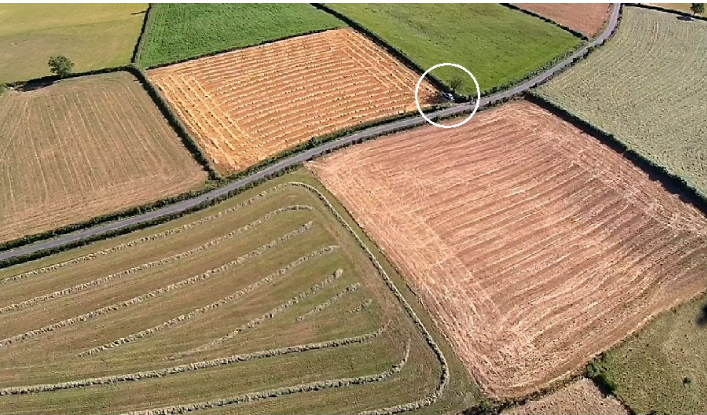
Moissons et fenaçons en cours dessinent au sol des tapis variés au gré des conducteurs d'engins. Dans le cercle, le site de pilotage du 2ème envol.