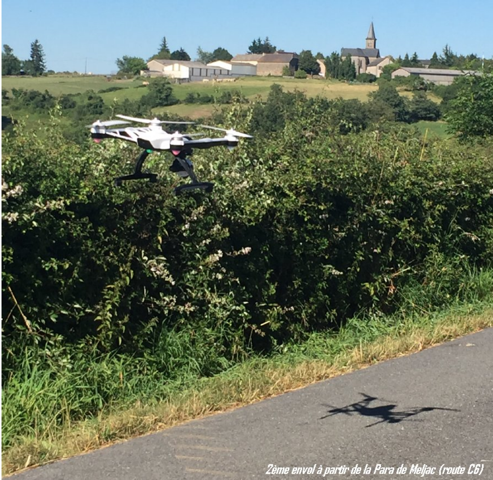
2ème envol à partir de la Para de Meljac (route C6)