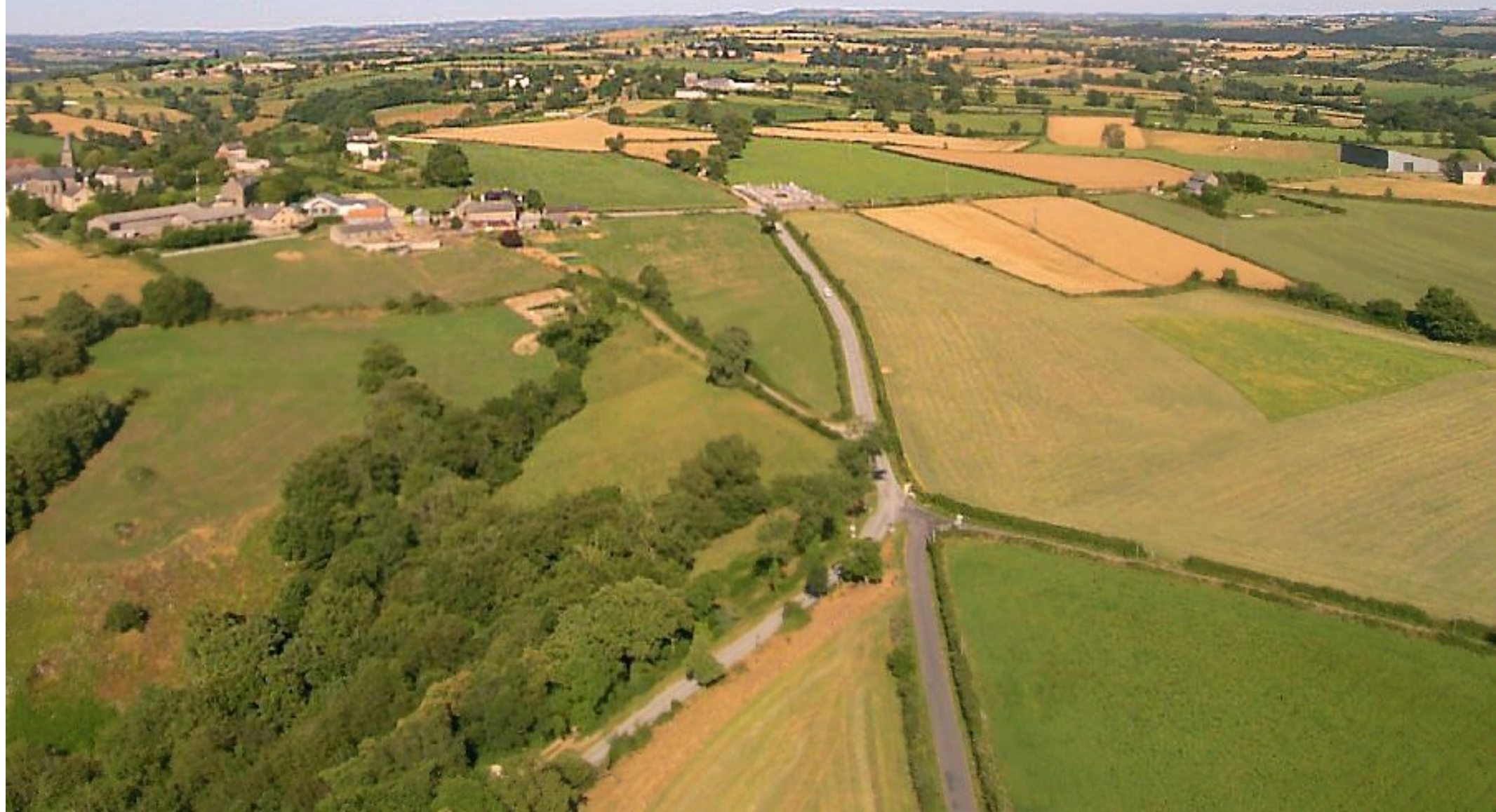
vue générale avec au 1er plan la croix du Clot et de gauche à droite le Bourg, le cimetière et Soulages