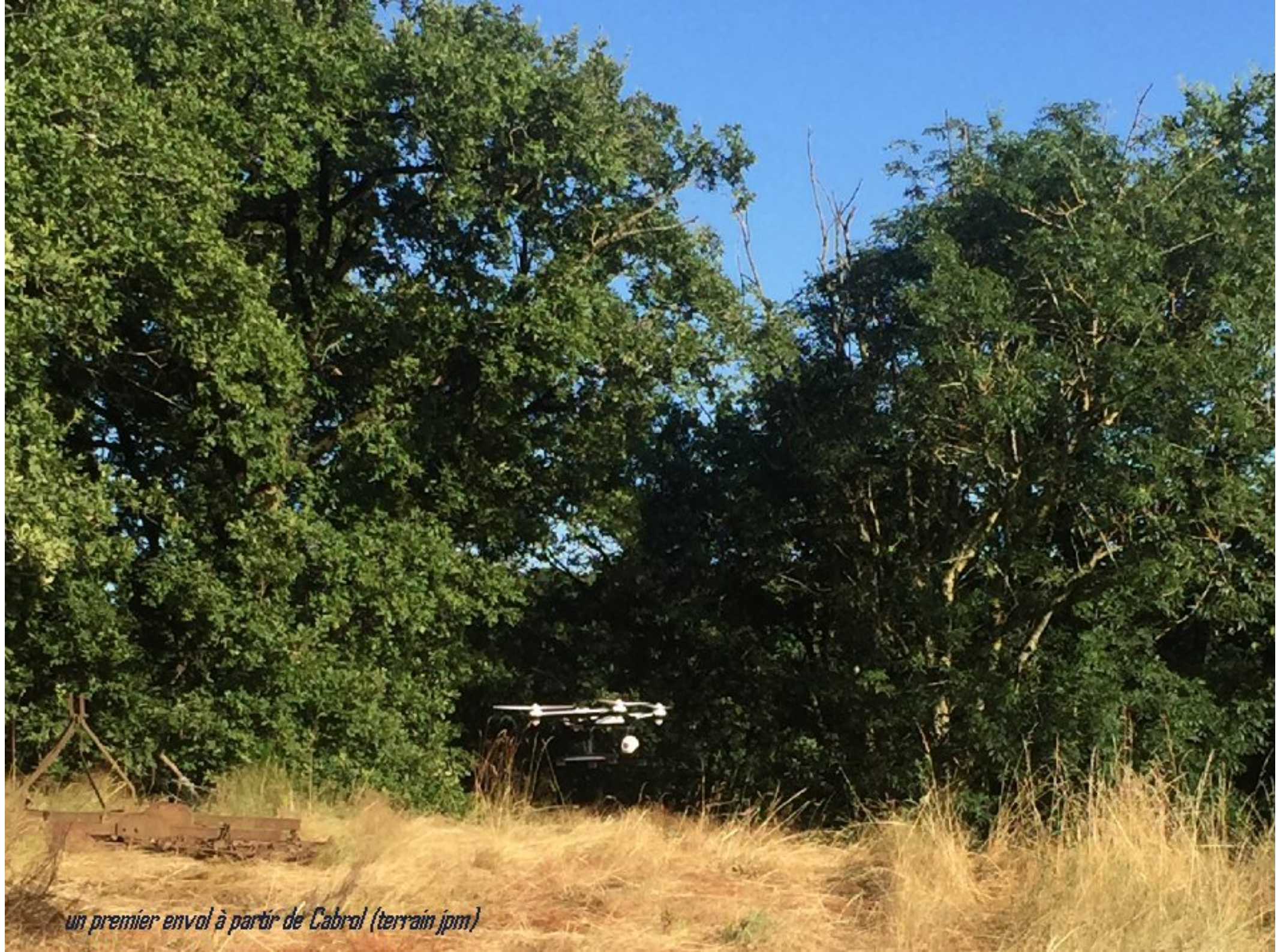
un premier envol à partir de Cabrol (terrain jpm)