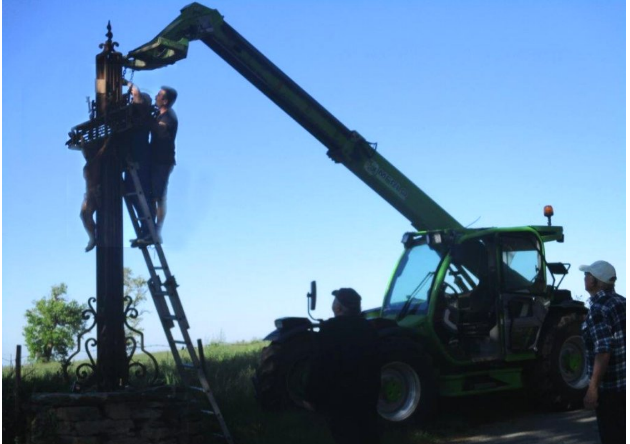
la croix de l'homme Mort va être descendue de son socle