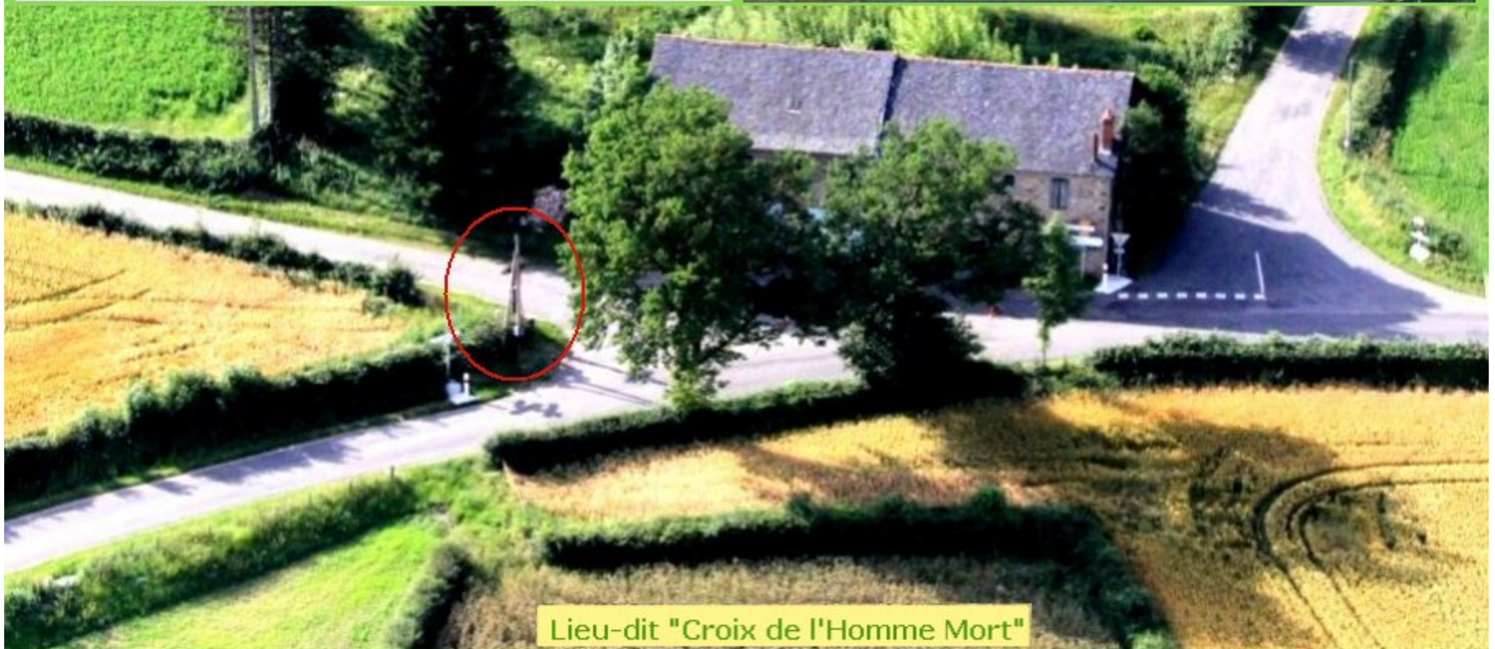
Lieu-dit "Croix de l'Homme Mort"