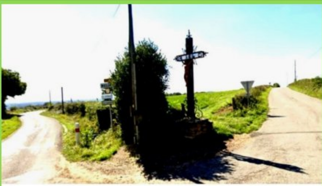
au carrefour de la D592 et de la D63, se dresse la "Croix de l'Homme Mort"