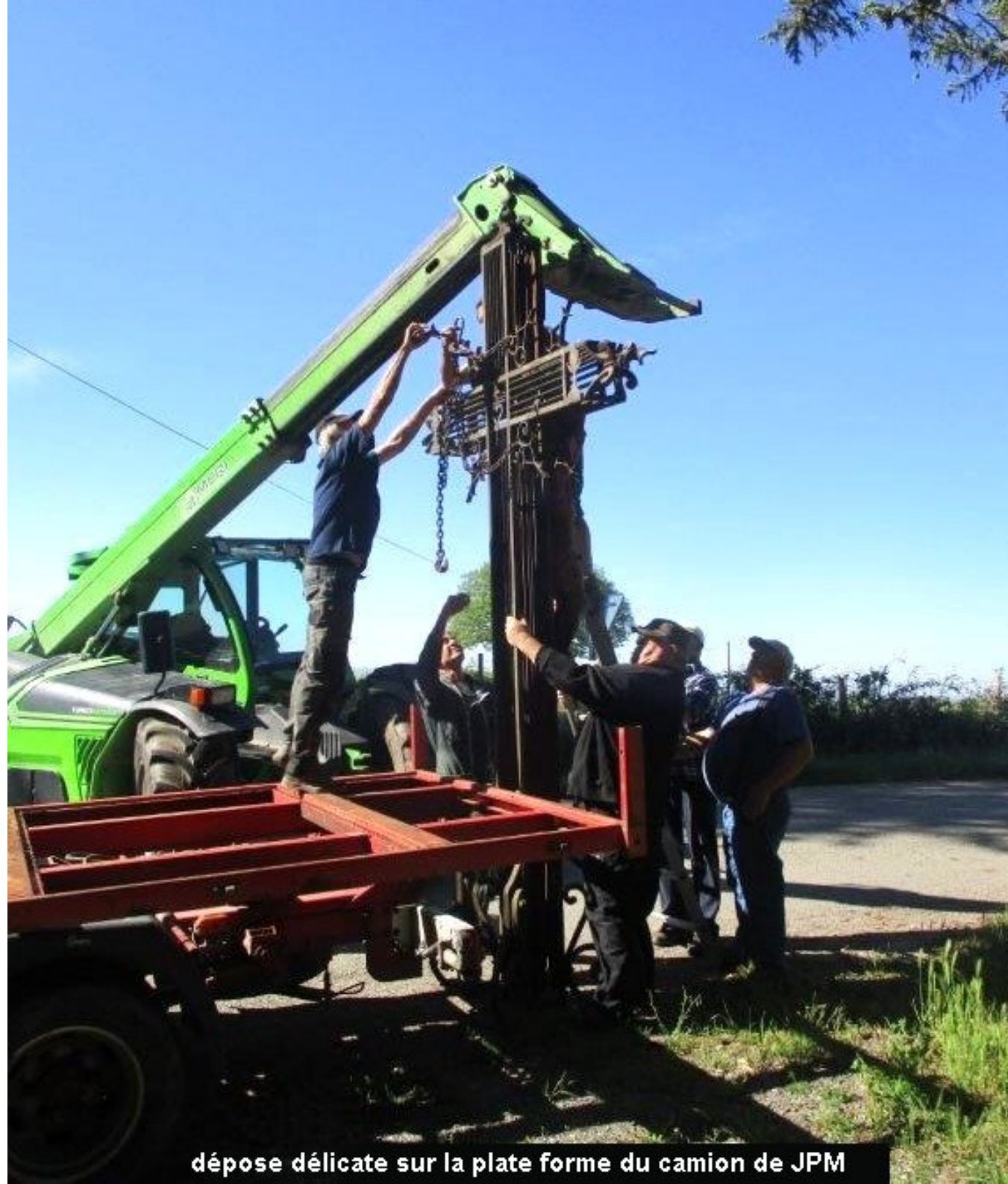
dépose délicate sur la plate forme du camion de JPM