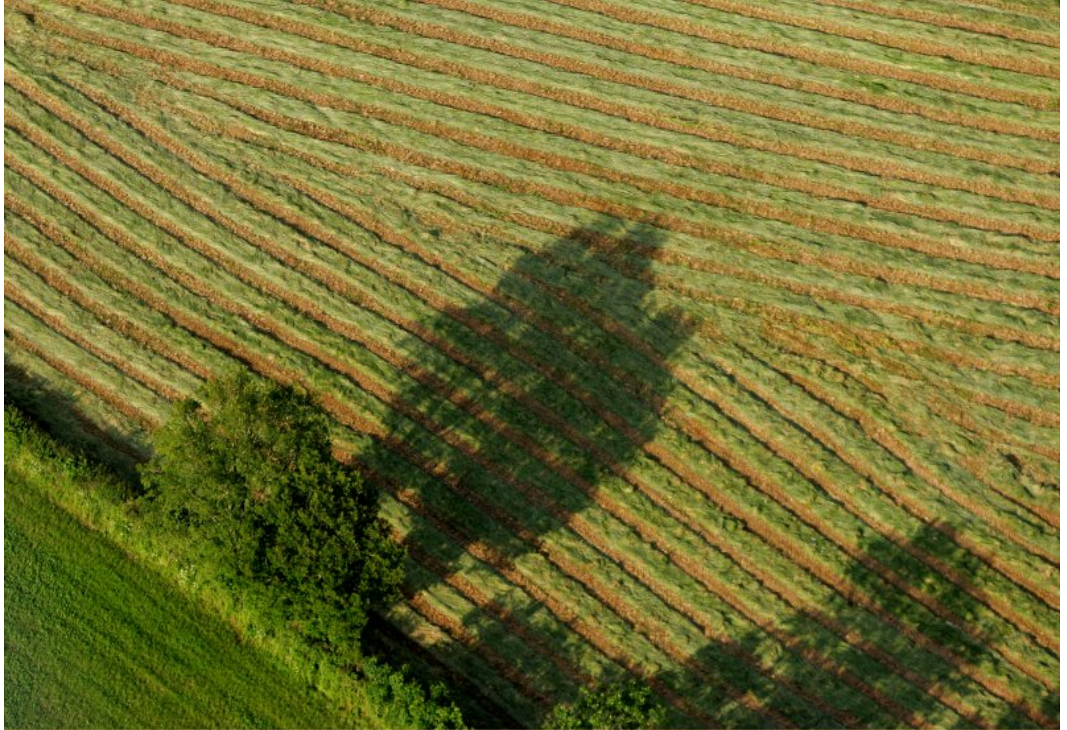
Meljac vu du ciel - à travers champs - au Clot - juin 2010