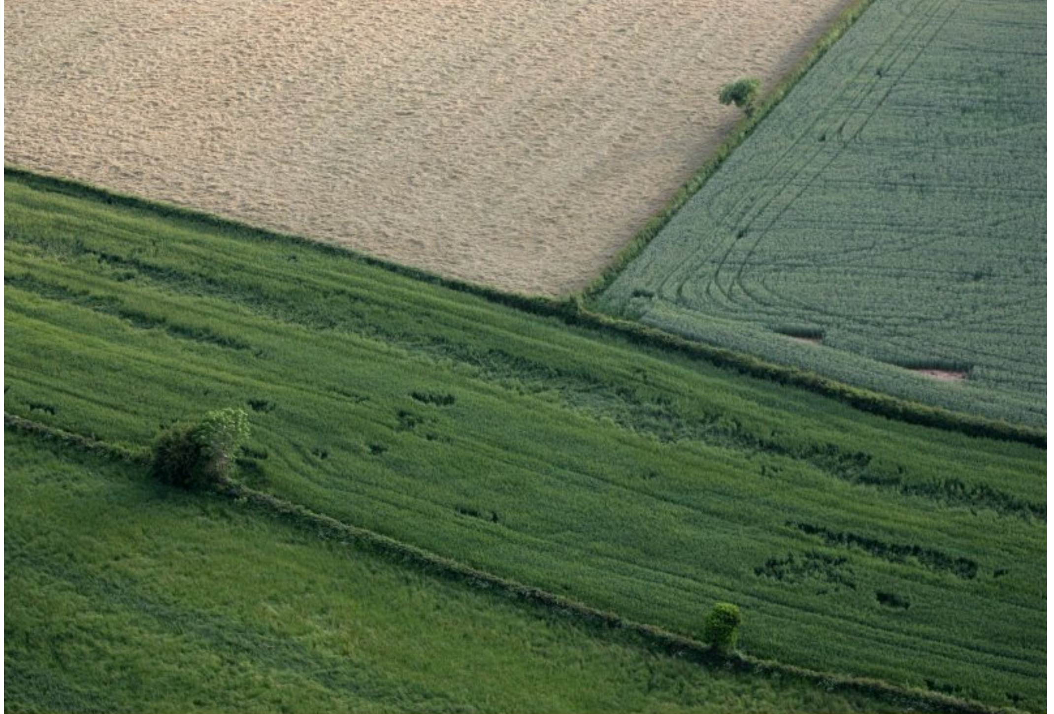
Meljac vu du ciel - à travers champs - juin 2010