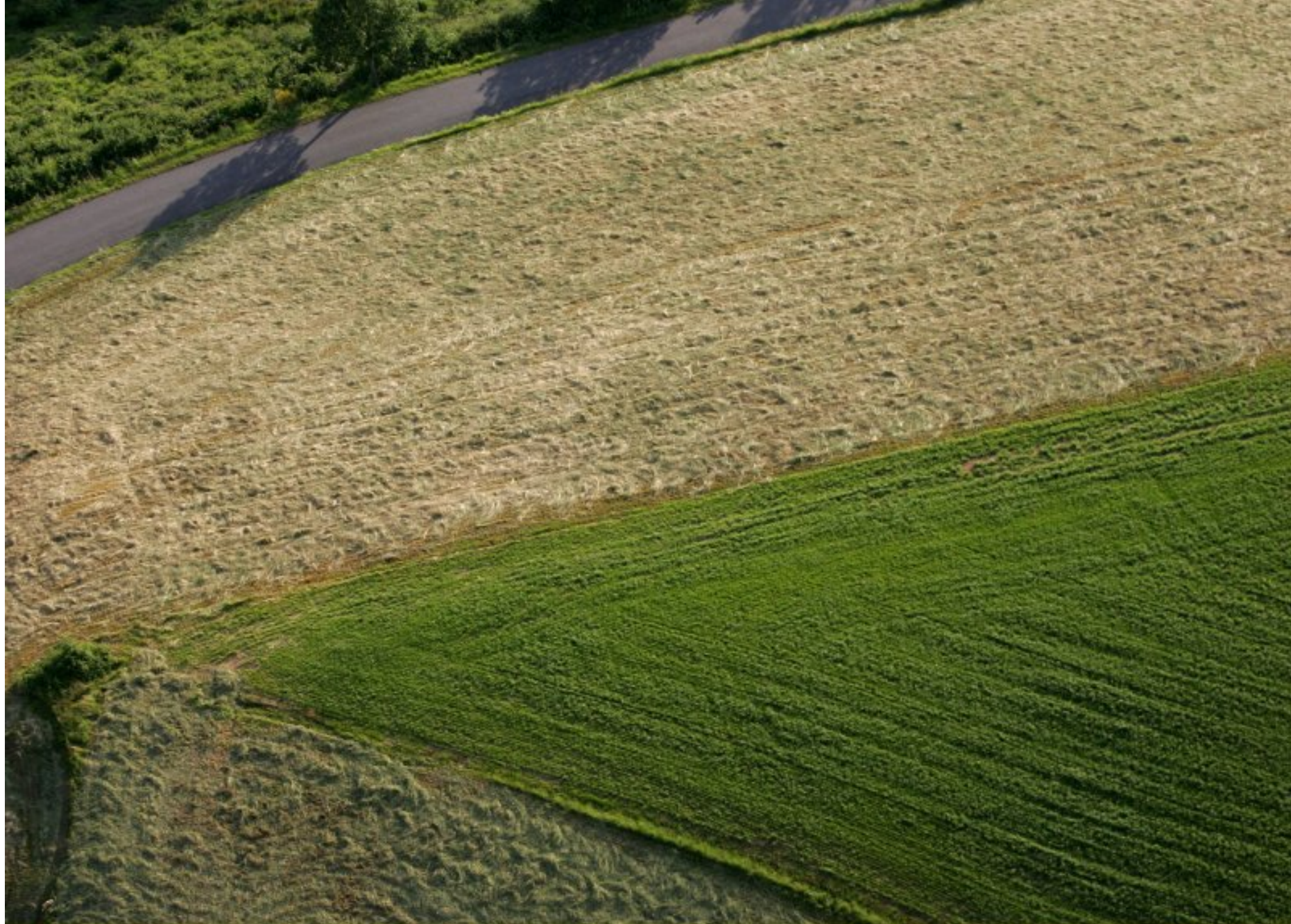
Meljac vu du ciel - à travers champs - au dessus de Triol - juin 2010