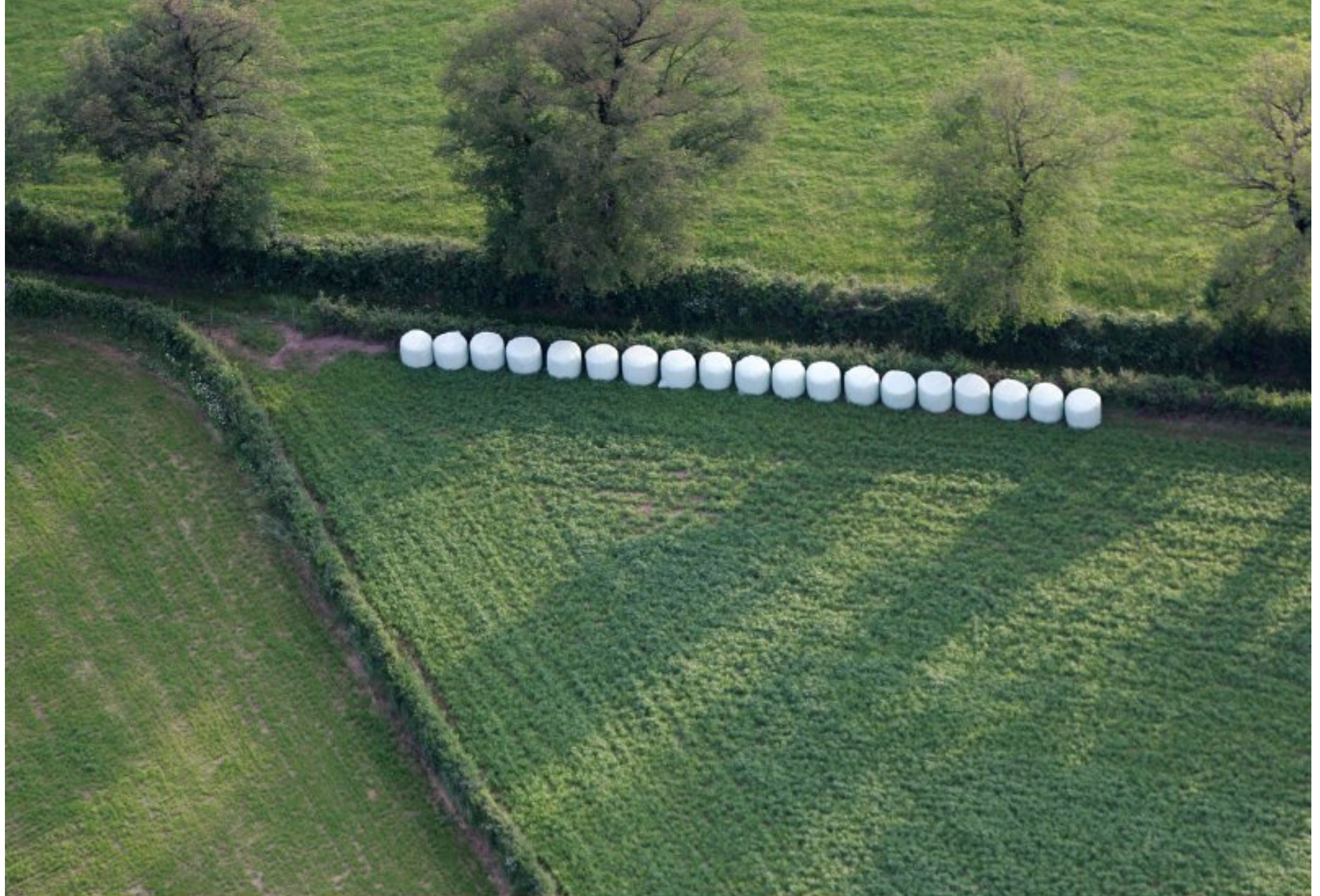
Meljac vu du ciel - à travers champs - juin 2010