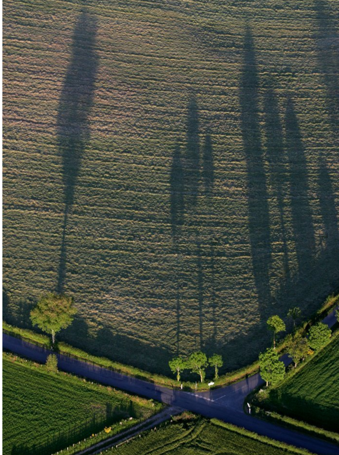
Meljac vu du ciel - à travers champs - juin 2010