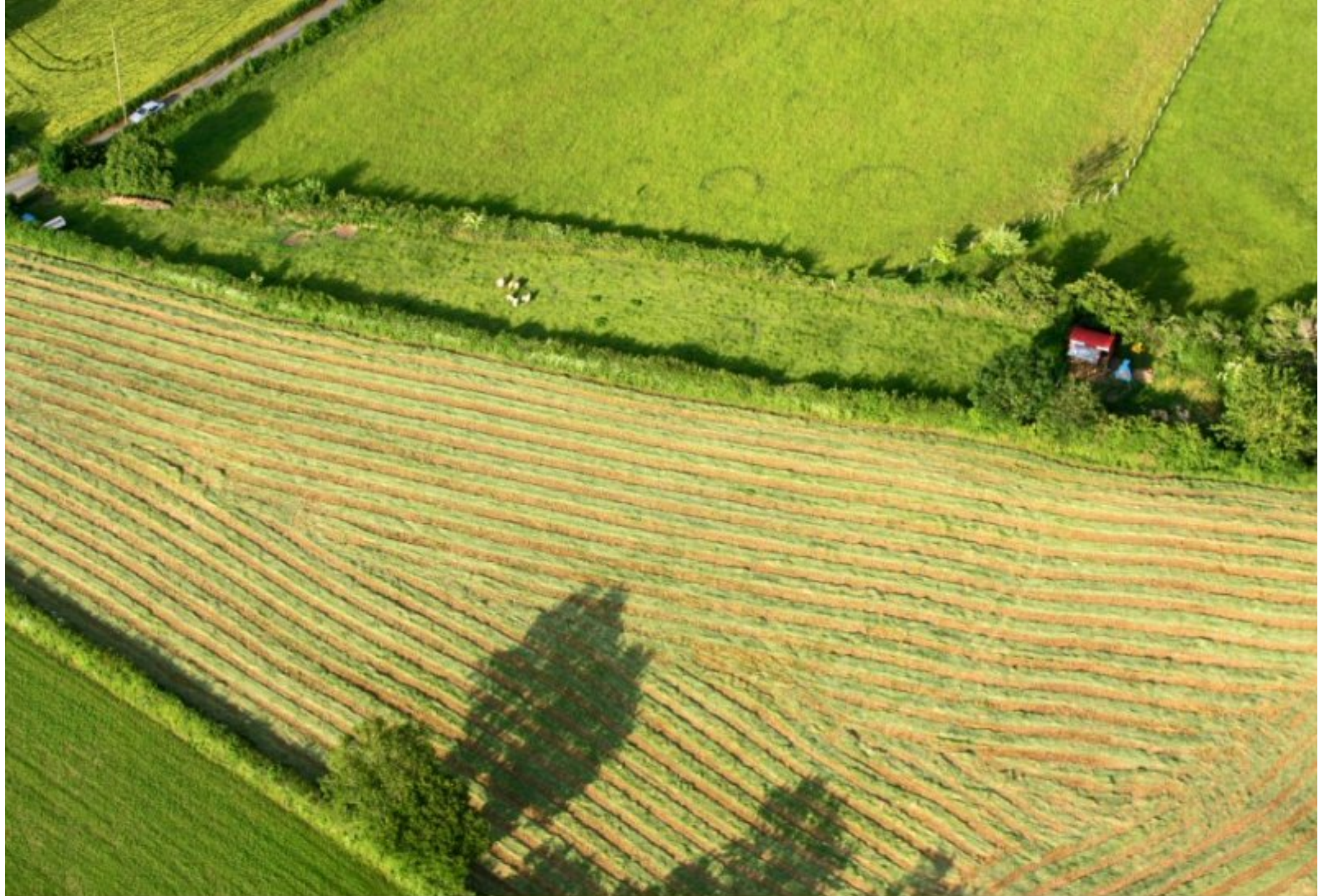
Meljac vu du ciel - à travers champs vers Cabrol, les brebis de Gérard Deleuze - juin 2010