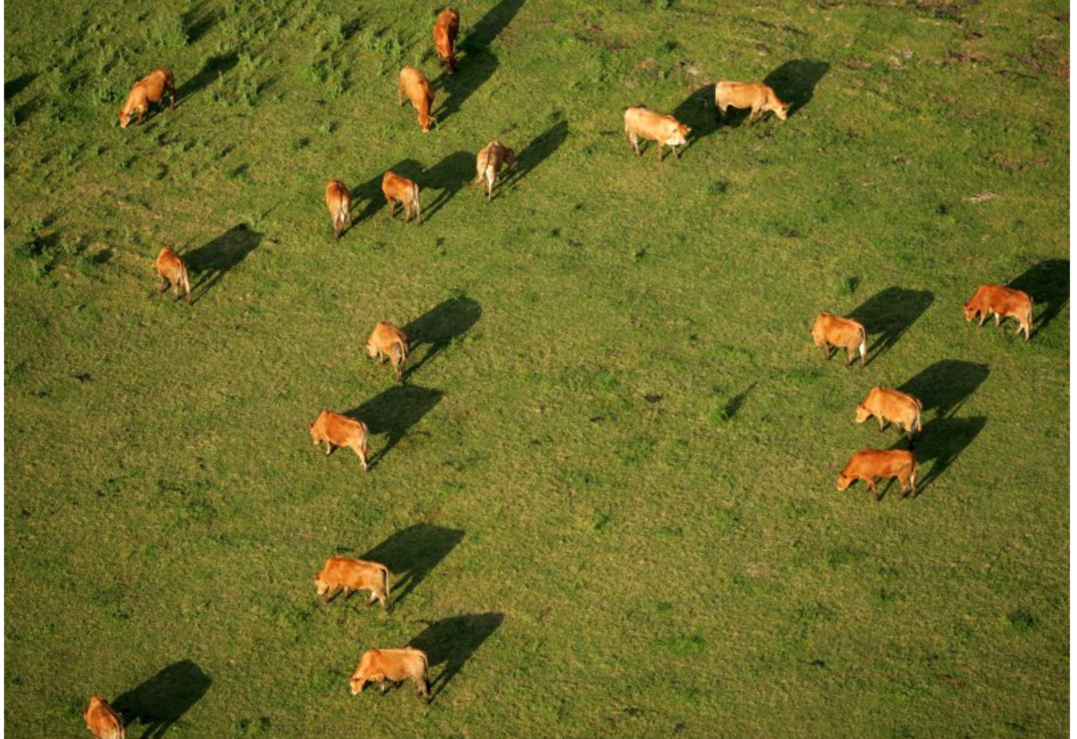
Meljac vu du ciel - à travers champs - survol d'un troupeau à la Bessière - juin 2010