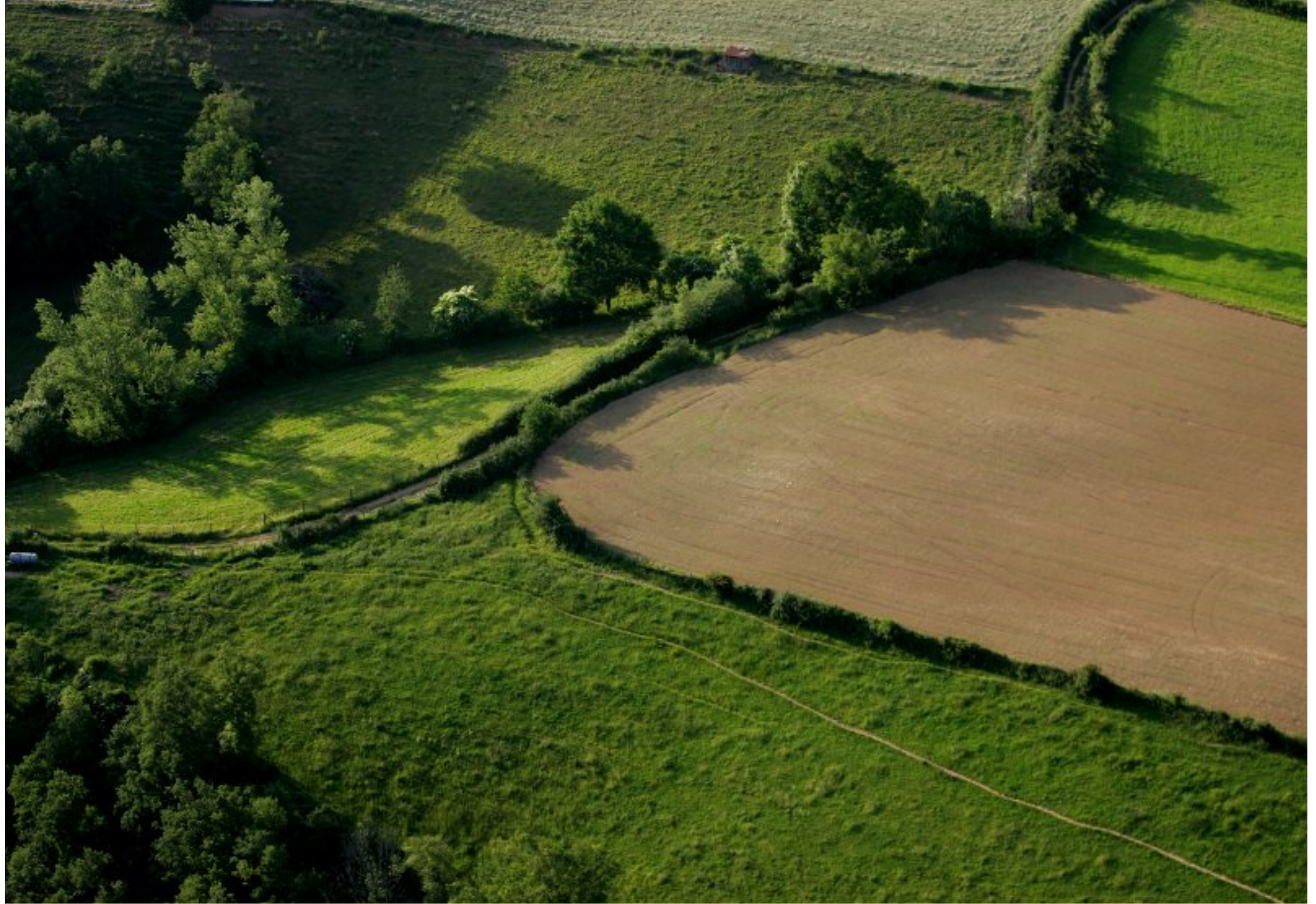
Meljac vu du ciel - à travers champs - Triol - juin 2010