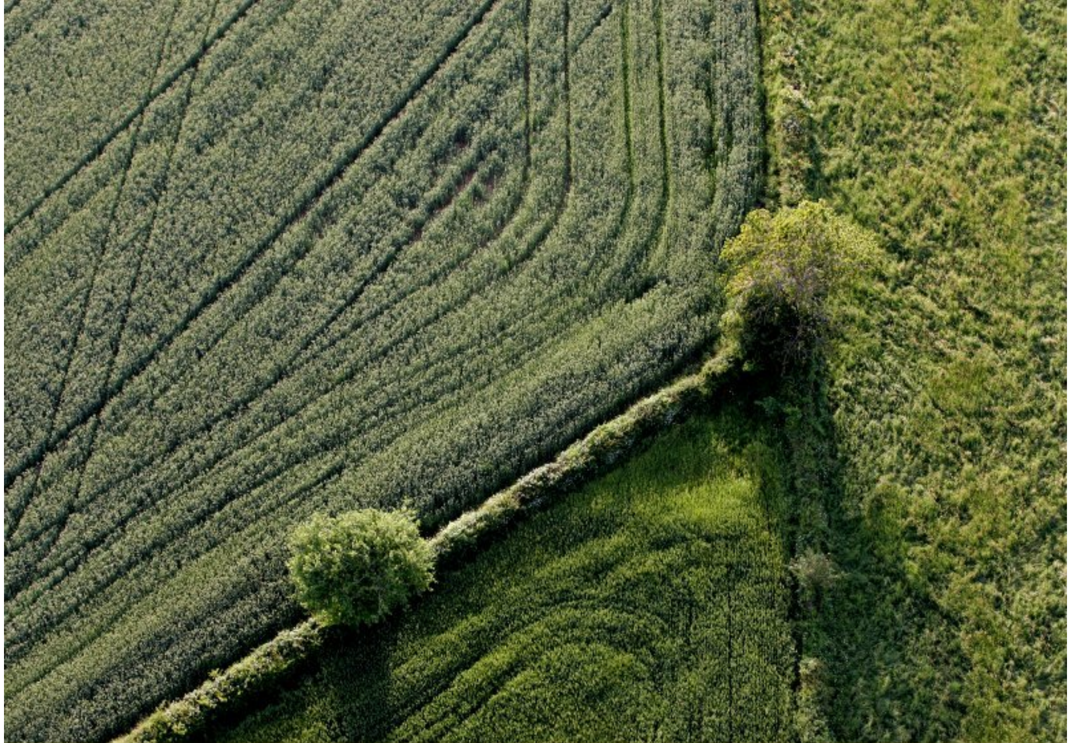
Meljac vu du ciel - à travers champs - juin 2010