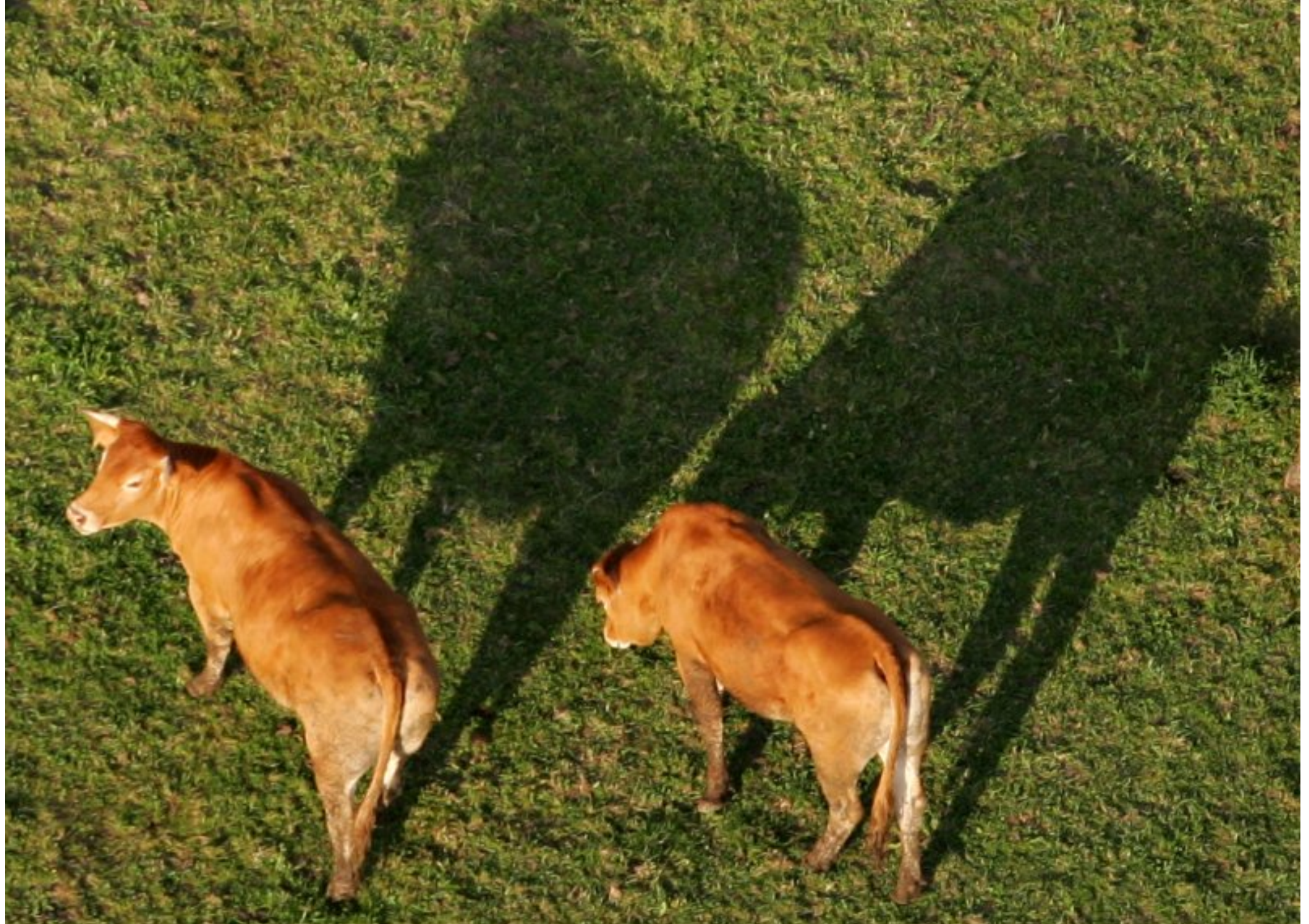
Meljac vu du ciel - à travers champs à la Bessière - juin 2010