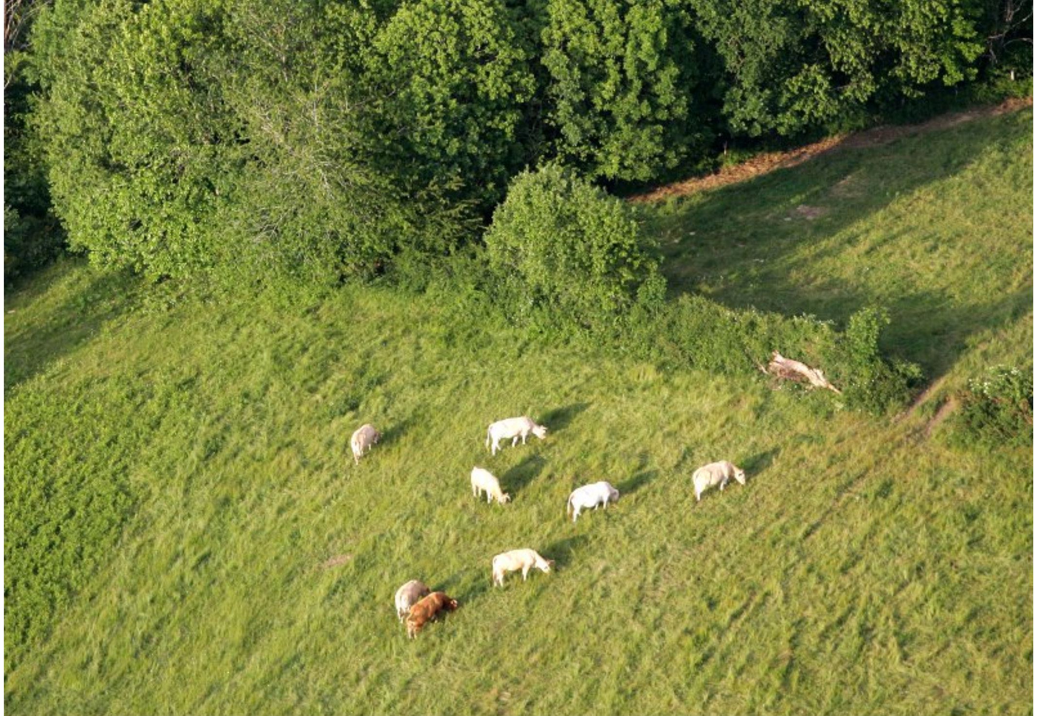
Meljac vu du ciel - à travers champs, des vaches de Guy Loubière du Mas Ricard - juin 2010