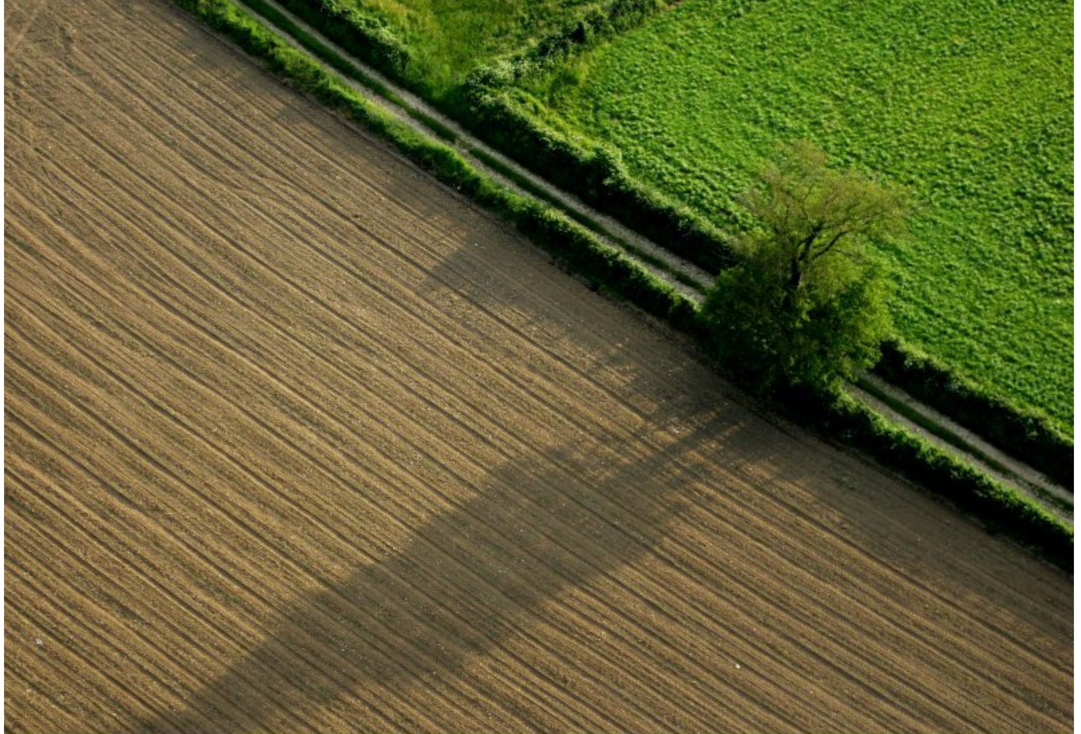
Meljac vu du ciel - à travers champs - juin 2010