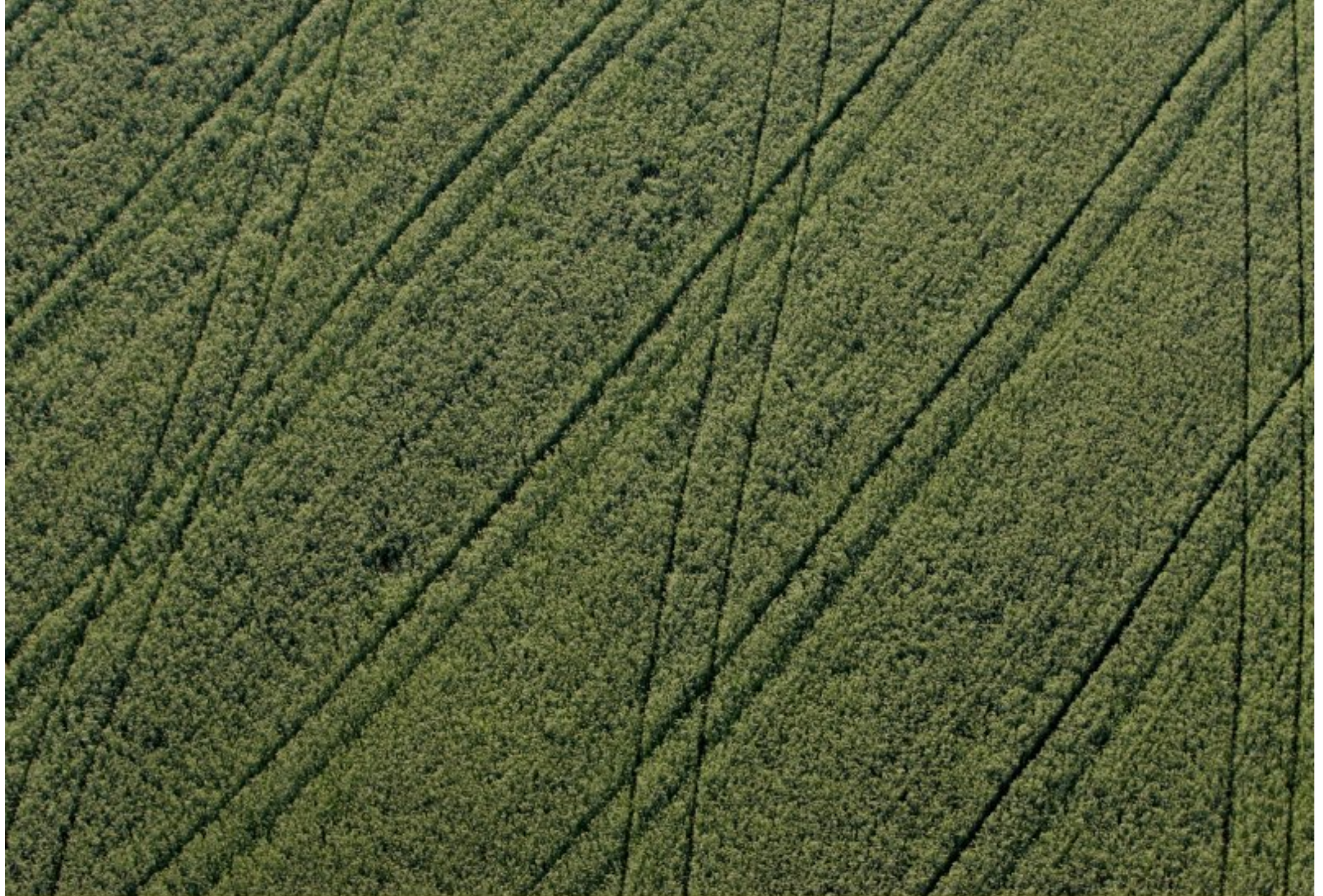
Meljac vu du ciel - à travers champs - juin 2010