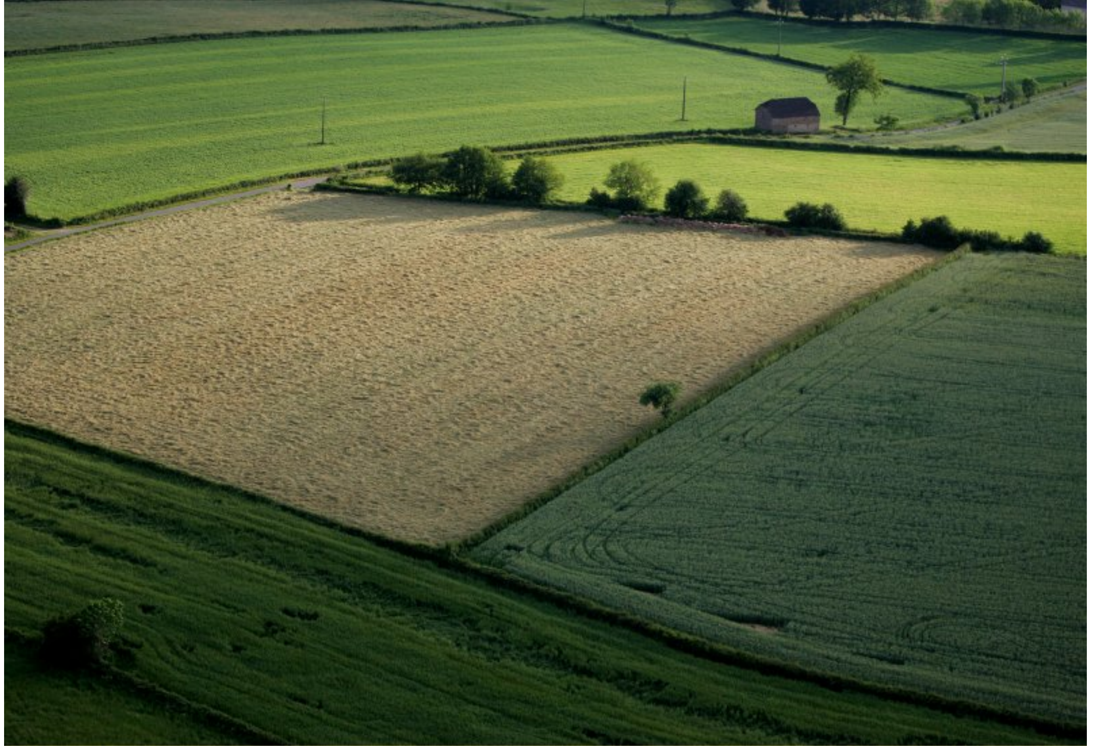
Meljac vu du ciel - à travers champs - le Puech de Bonal (le long de la D592) - juin 2010