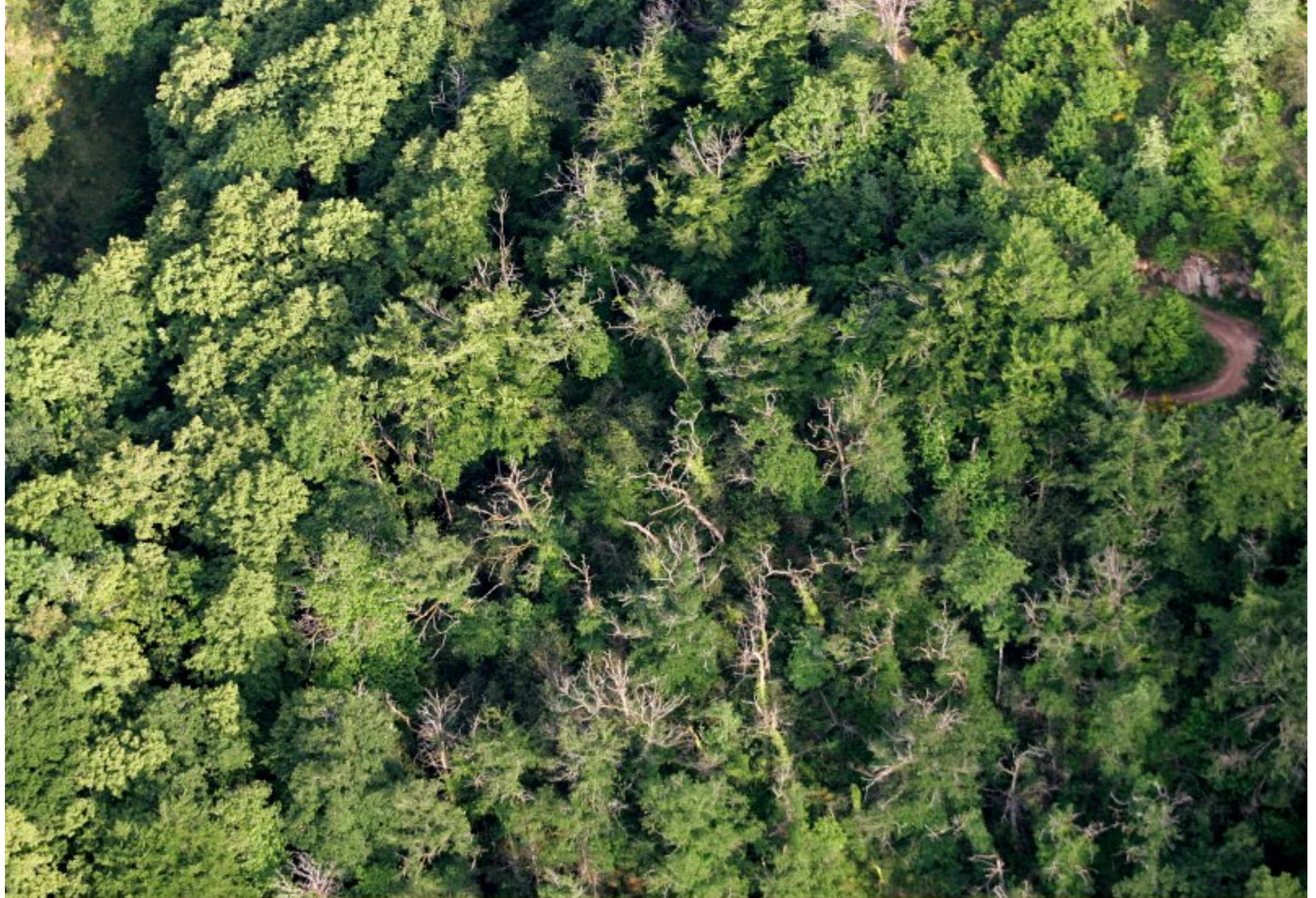
Meljac vu du ciel - à travers champs - au dessus des bois du Batut - juin 2010 (à droite sur la photo le chemin qui conduit à l'ancienne "usine Delaure")