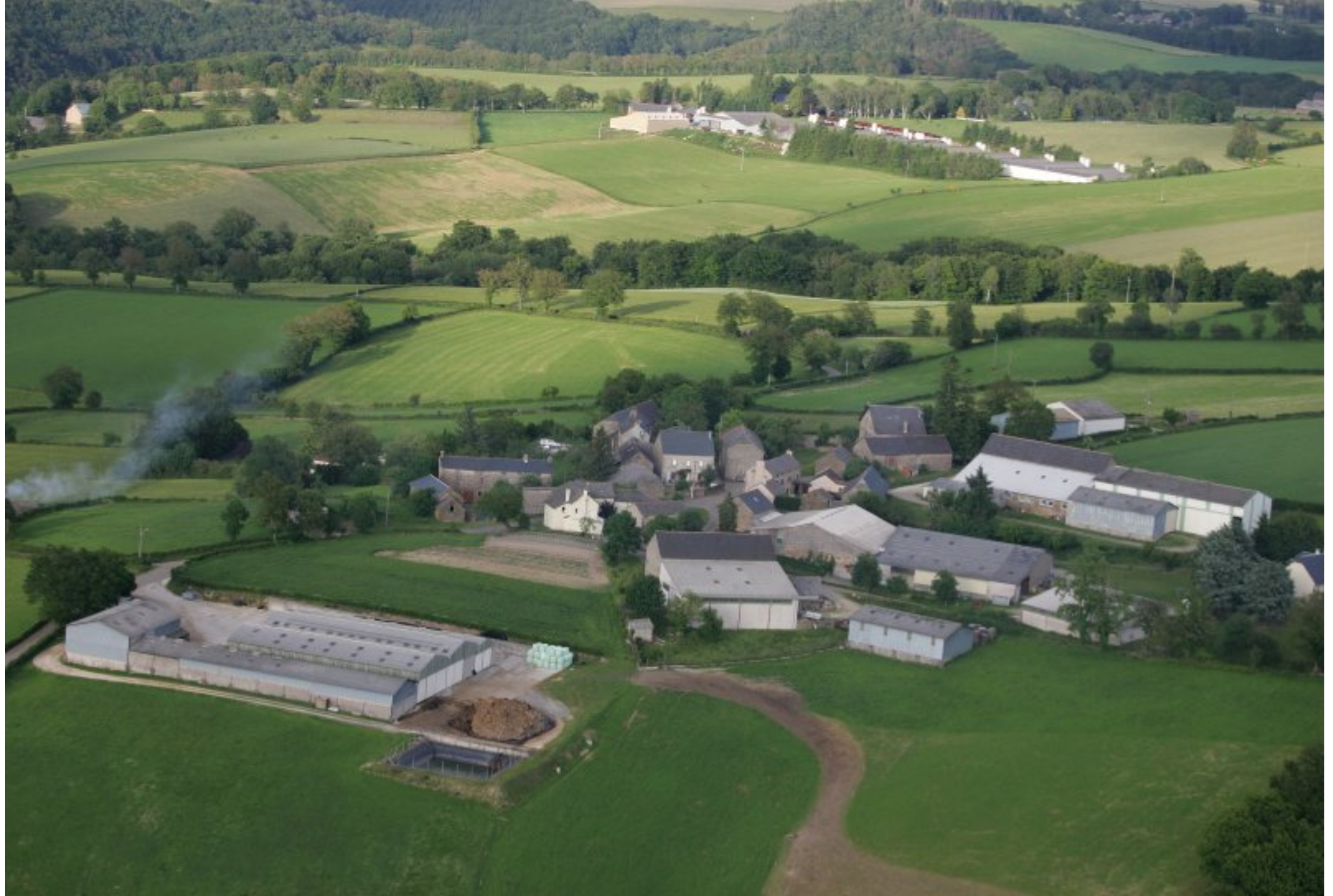
proximité Meljac - vu du ciel - les Hameaux - de Rouffrenac (1er plan) à Parisot (2ème plan) - juin 2010