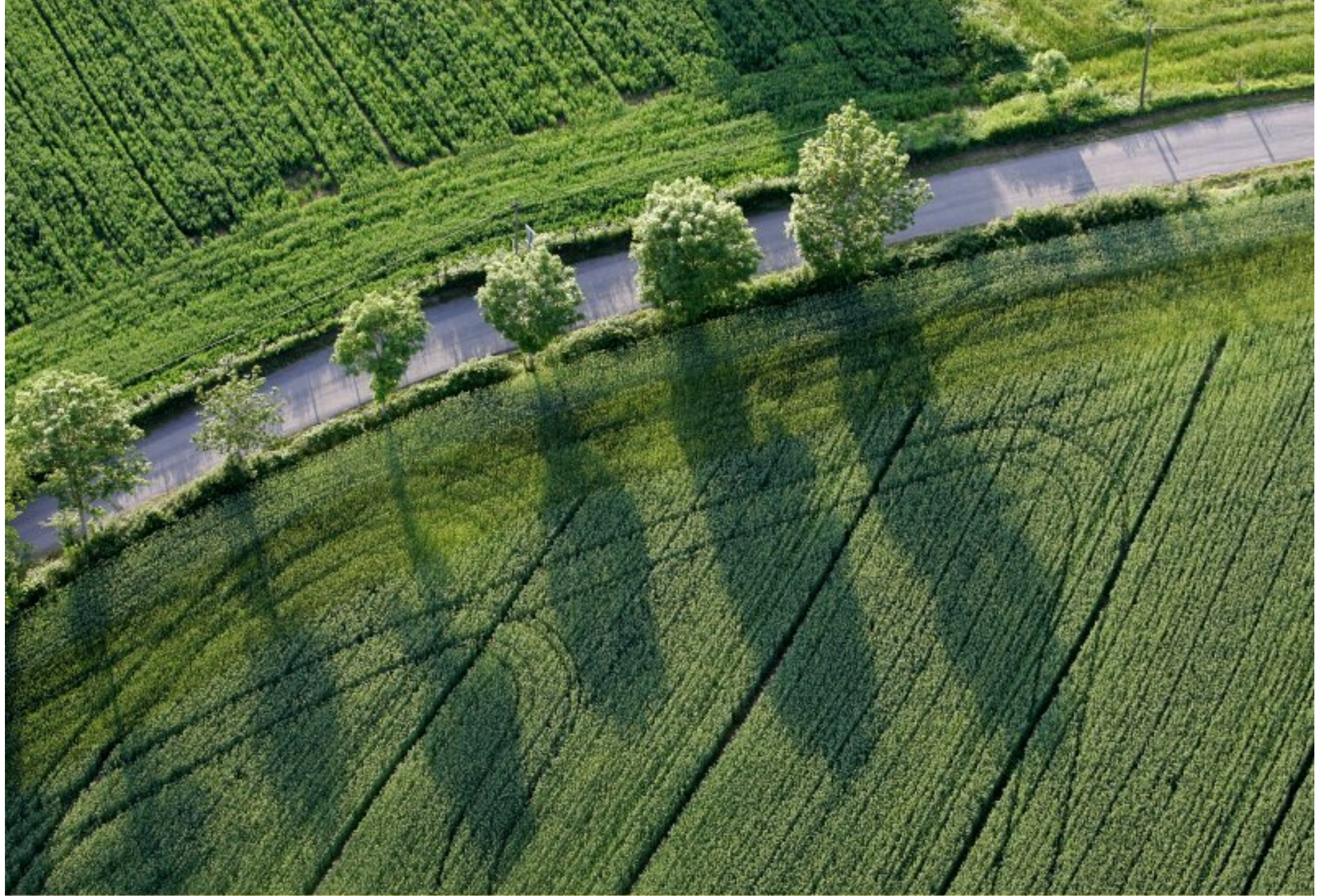
Meljac vu du ciel - à travers champs - juin 2010