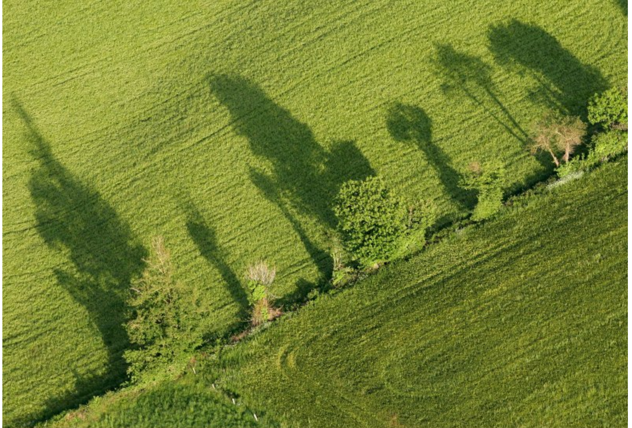
Meljac vu du ciel - à travers champs - juin 2010