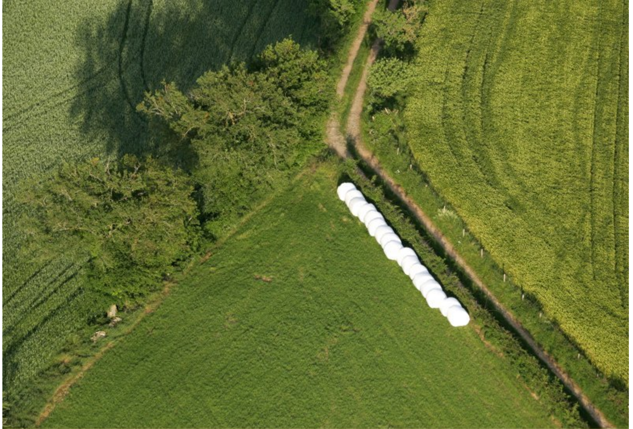
Meljac vu du ciel - à travers champs - juin 2010