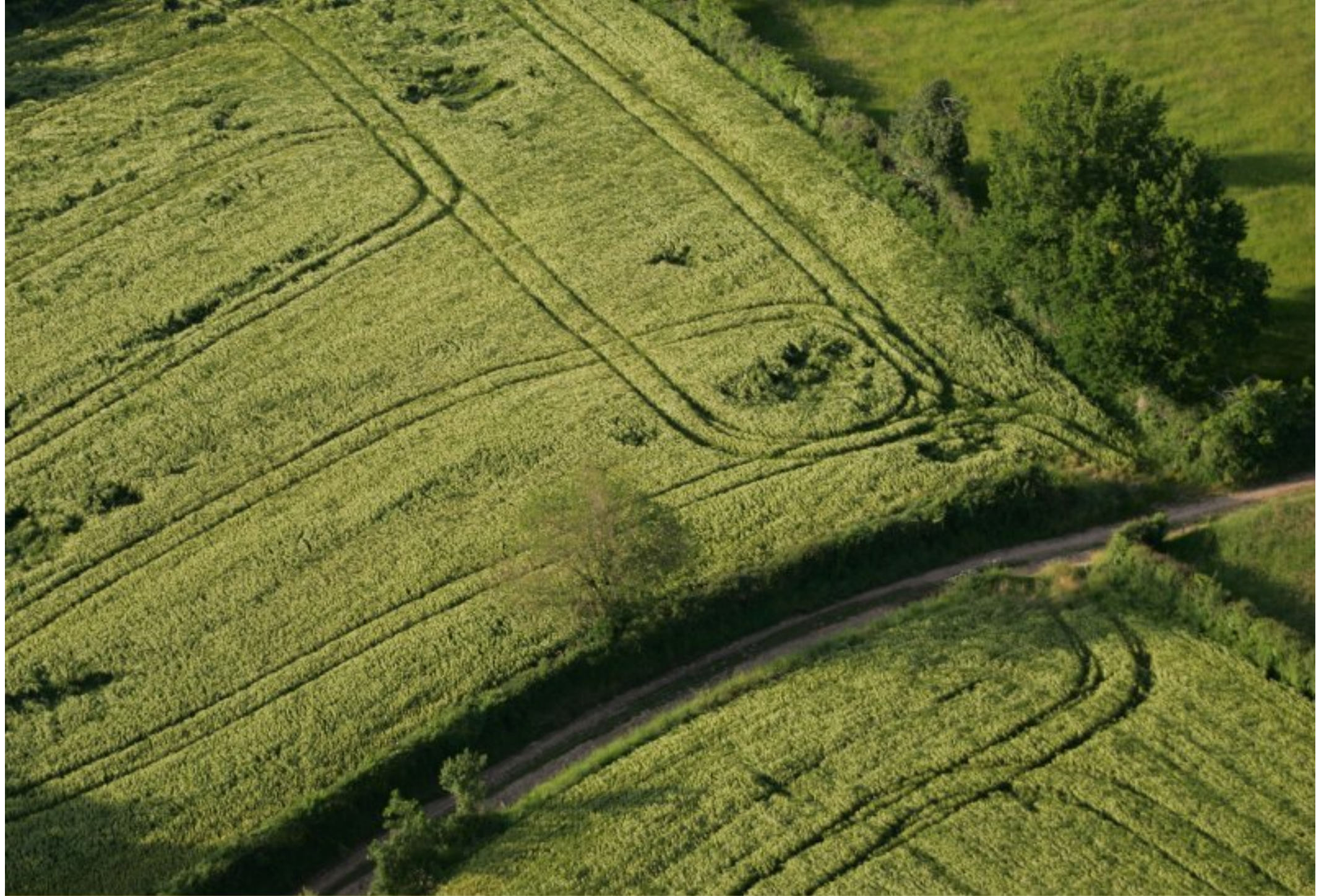
Meljac vu du ciel - à travers champs - juin 2010