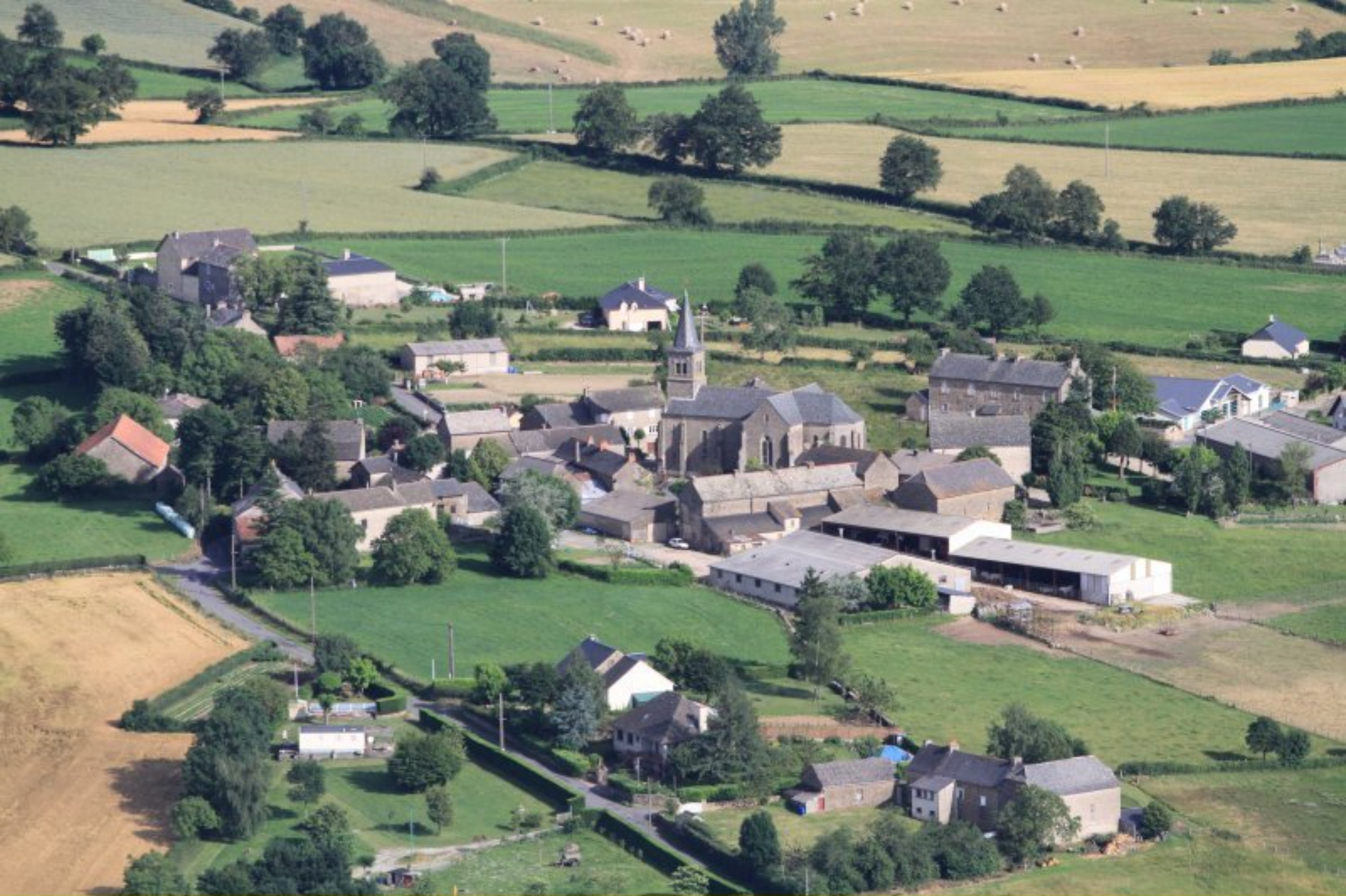
Meljac - Le Bourg - 20 juin 2012