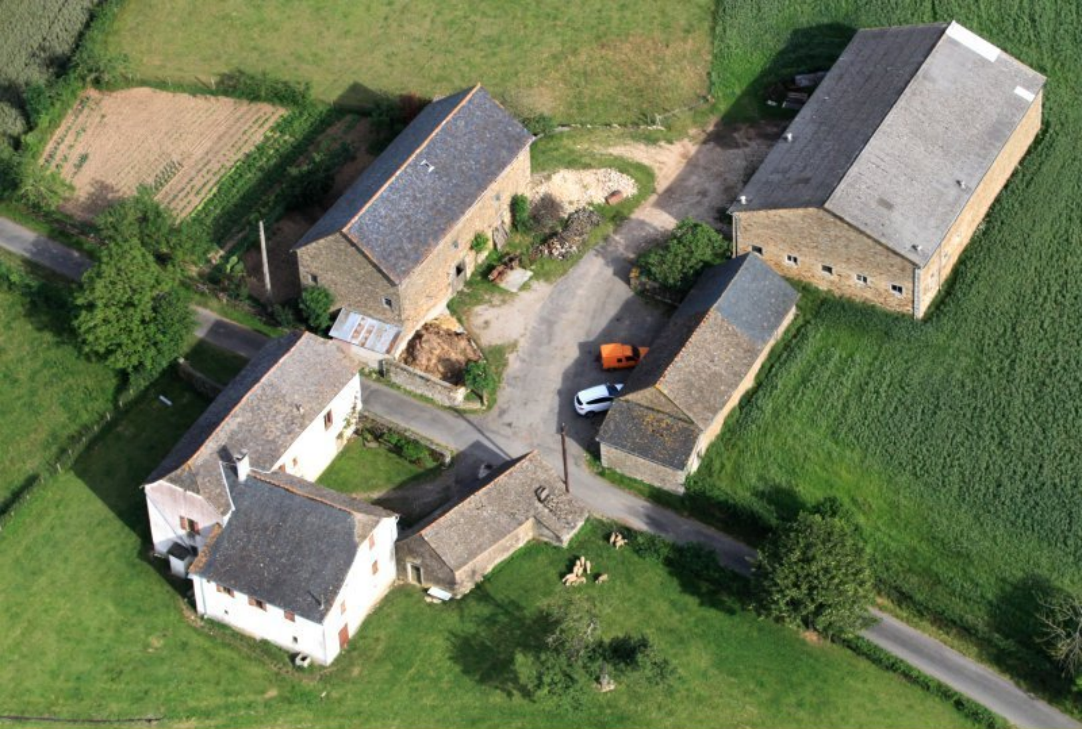
Le Féraldesq - ferme Alary-Pomiès - 20 juin 2012