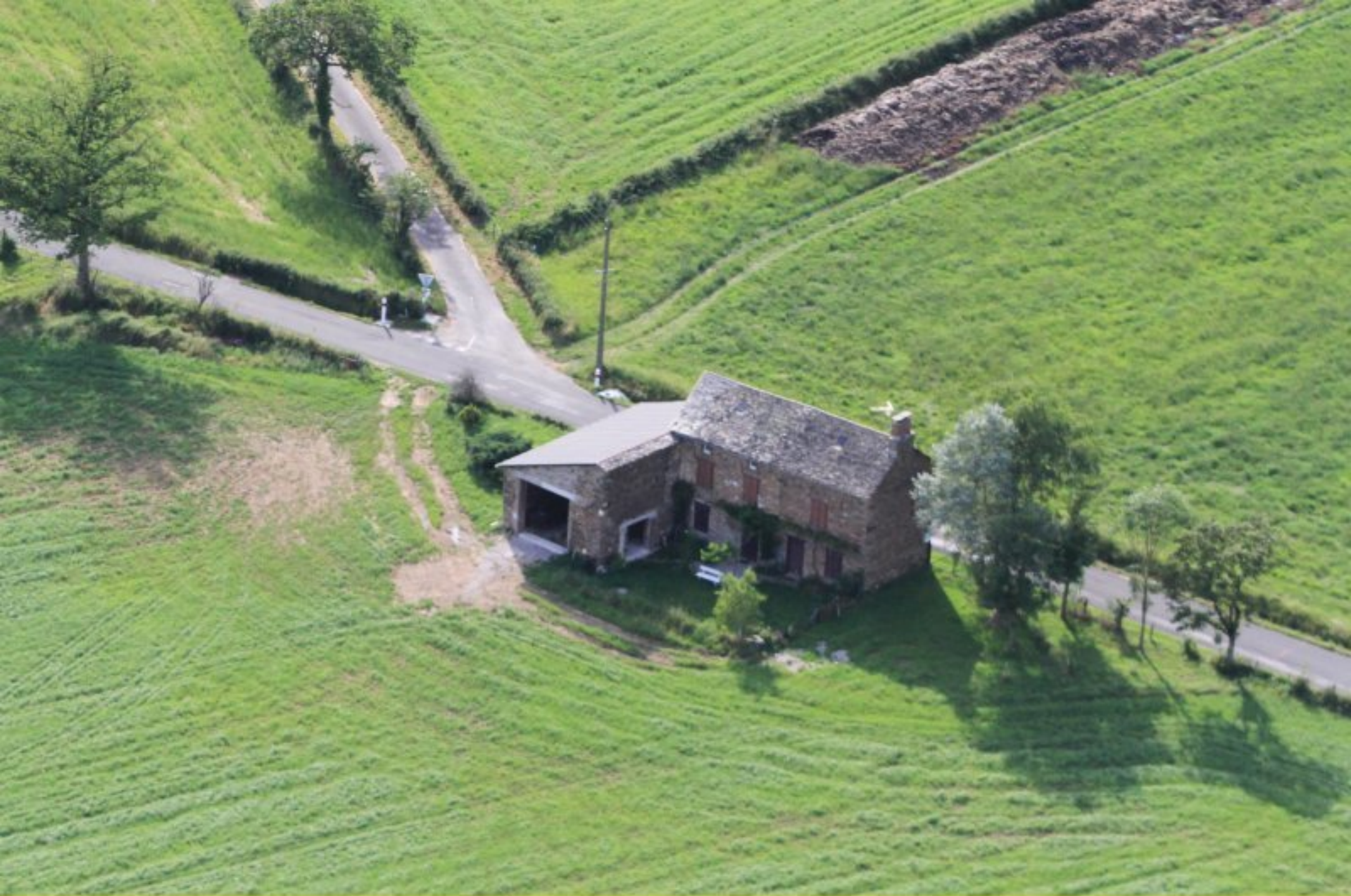
Le Cap Fourquet de Meljac - 20 juin 2012