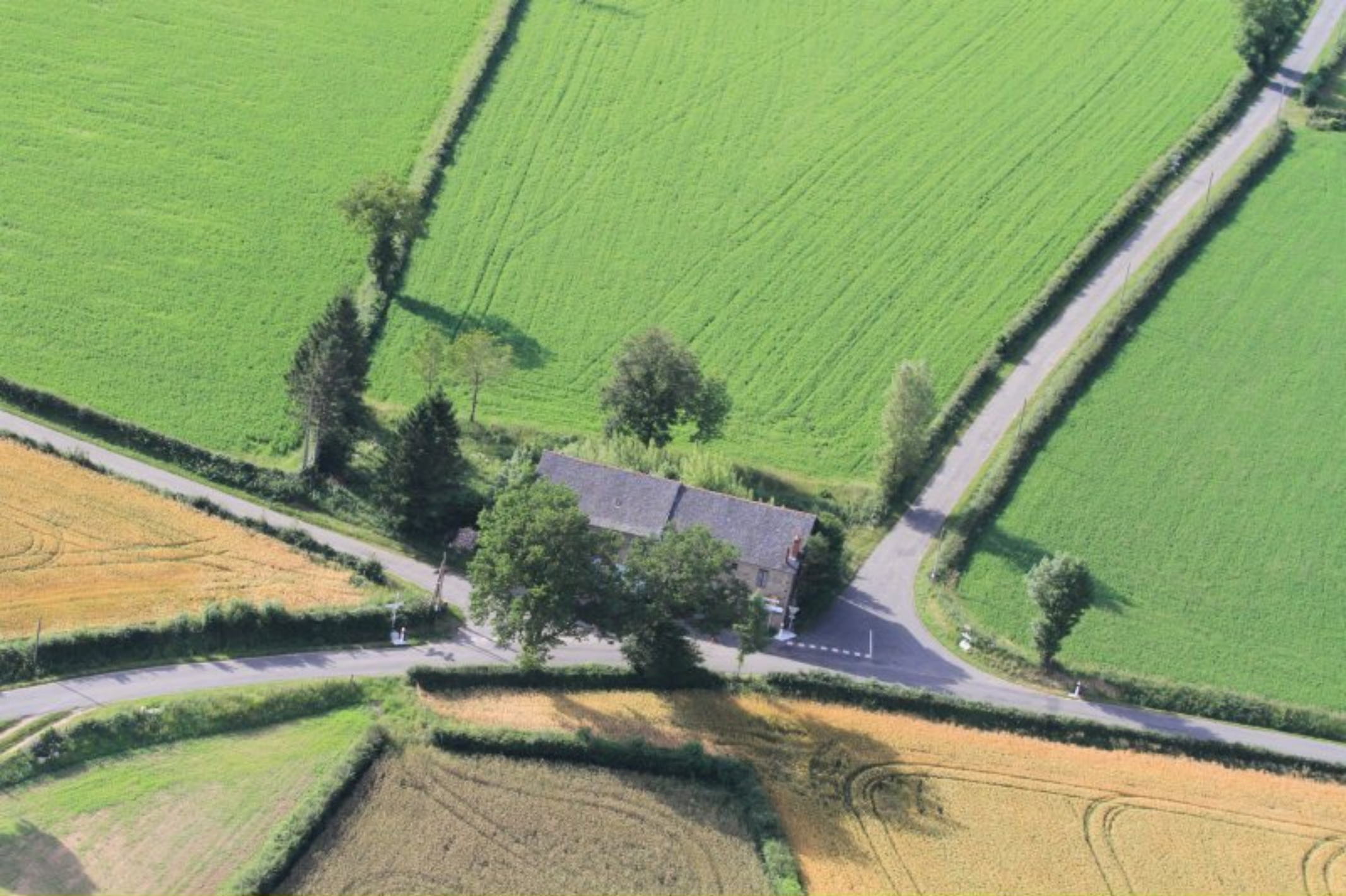
La Croix de L'Homme Mort de Rullac - 20 juin 2012