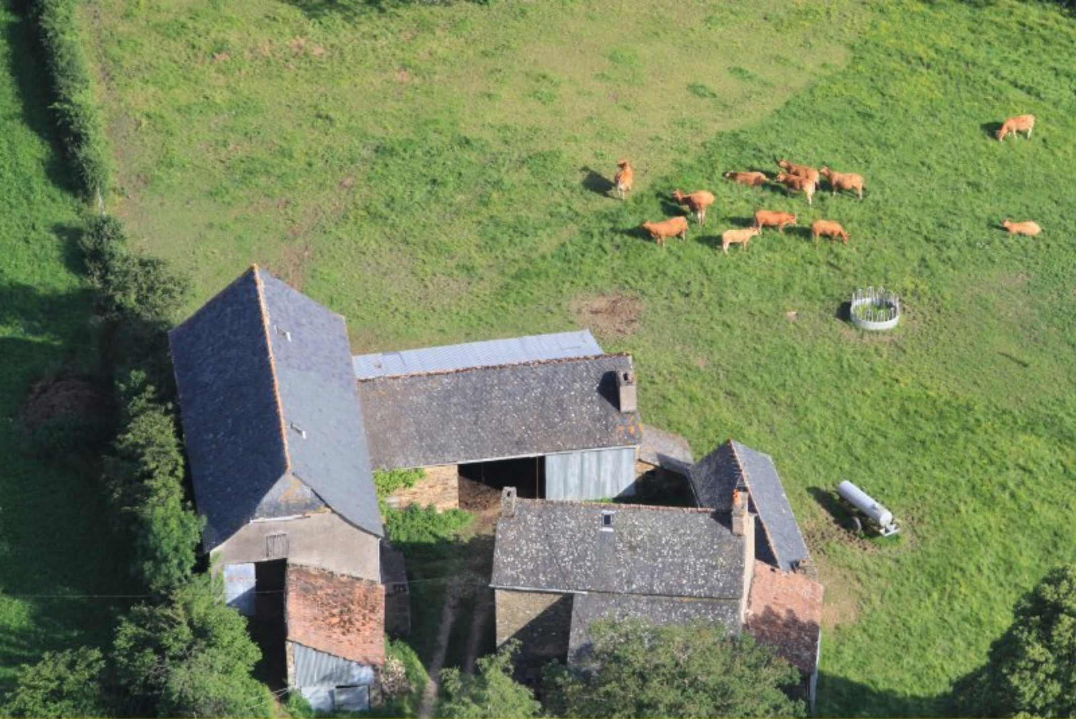
Le Puech Issaly de Meljac - ferme Hervé Albinet (anciennement Théophile Enjalbert) - 20 juin 2012