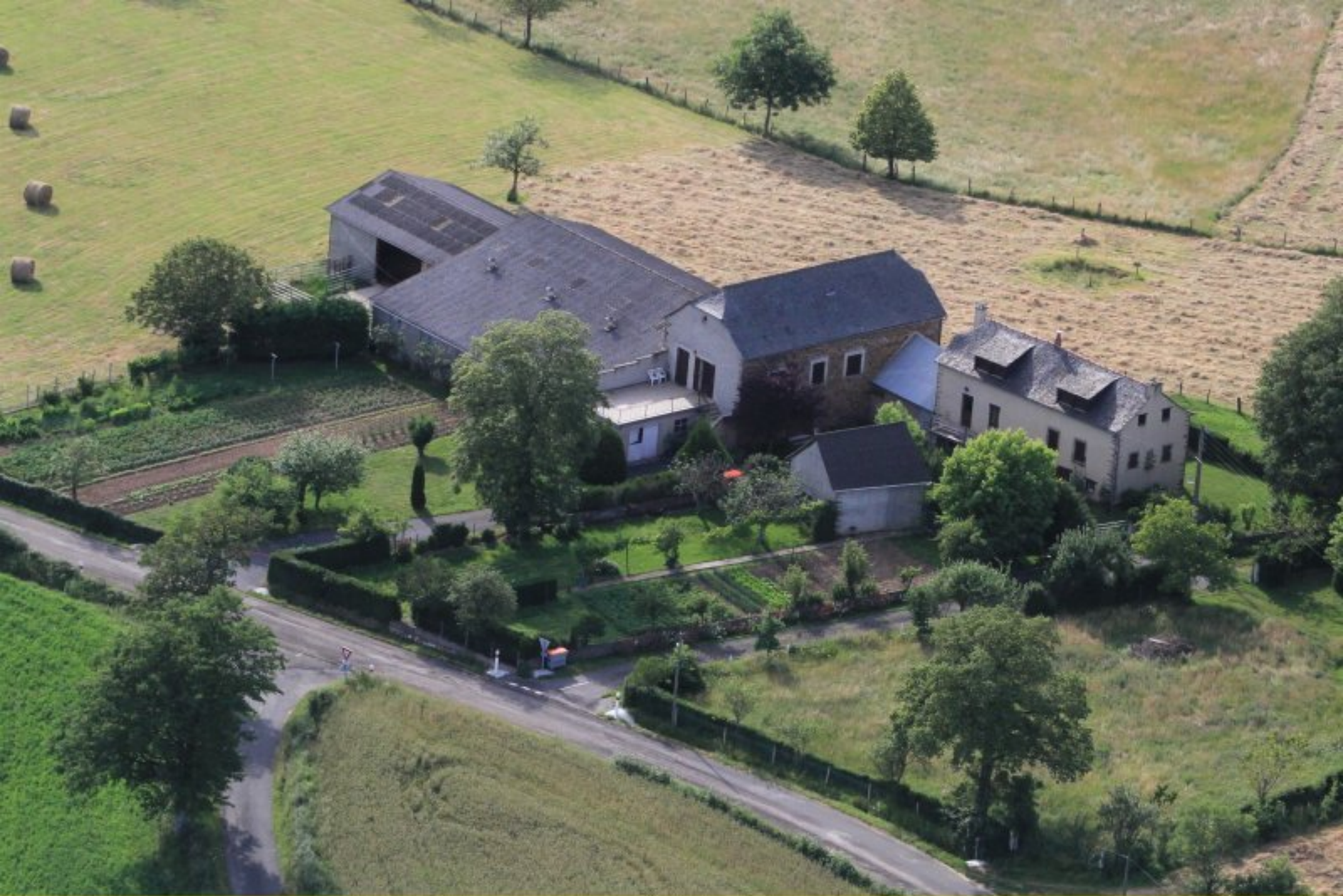
Le Rial de Rullac - maisons Suau & Nespoulous - 20 juin 2012