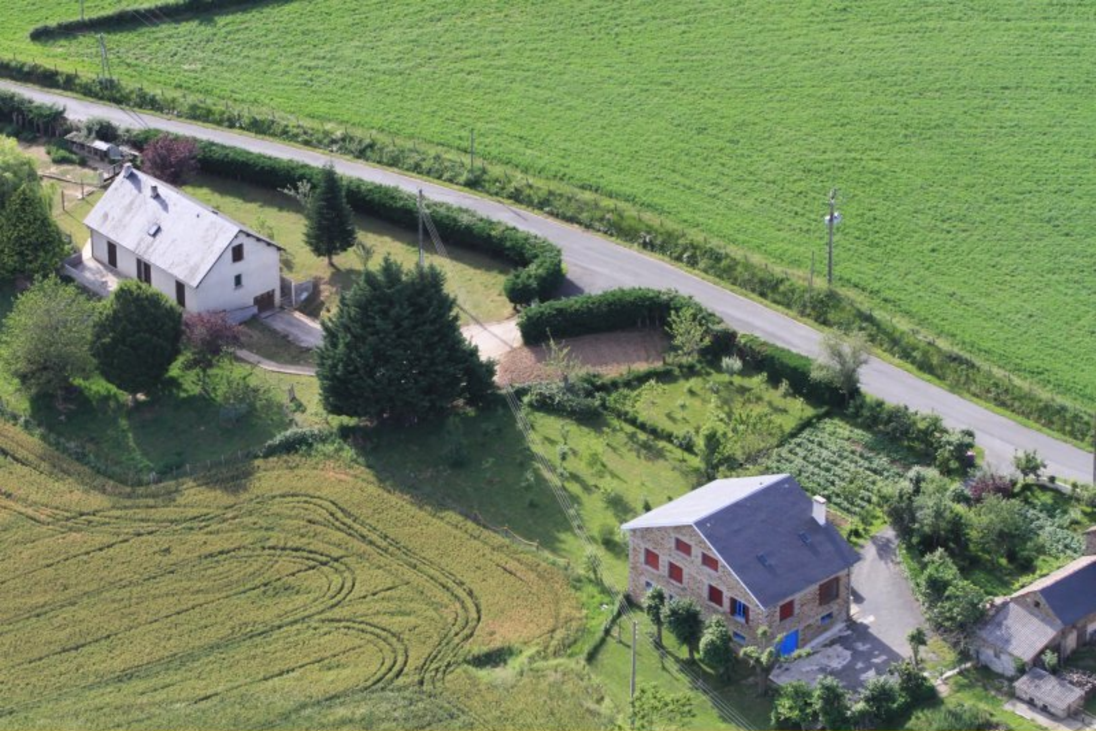
Les Combets de Rullac - 20 juin 2012