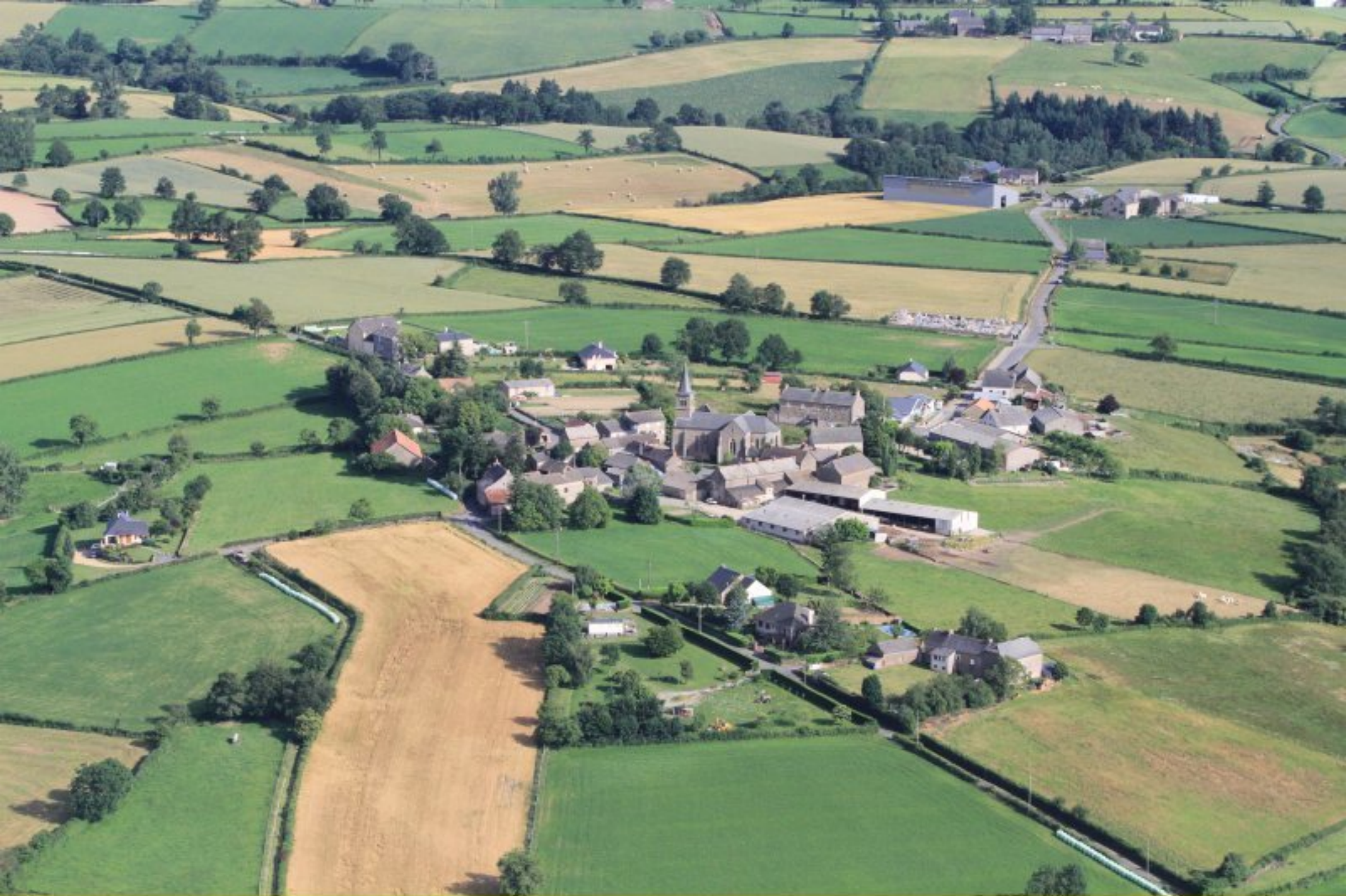
Meljac - vue générale sur le Bourg, Soulages, Le Féraldesq- 20 juin 2012