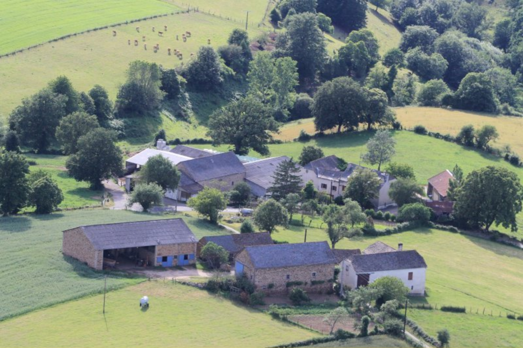
Le Féraldesq de Meljac - fermes Alary-Pomiès (1er plan) & Tayac (2ème plan) - 20 juin 2012