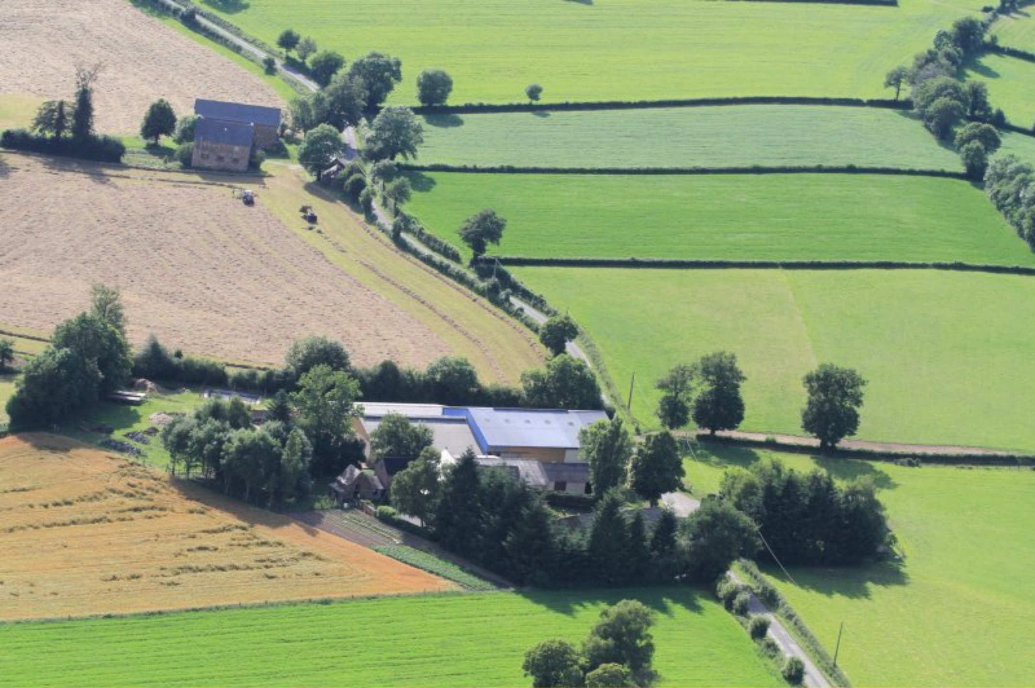
La Laurentie & le Puech Nau en suivant la D592 de Rullac vers Meljac - 20 juin 2012