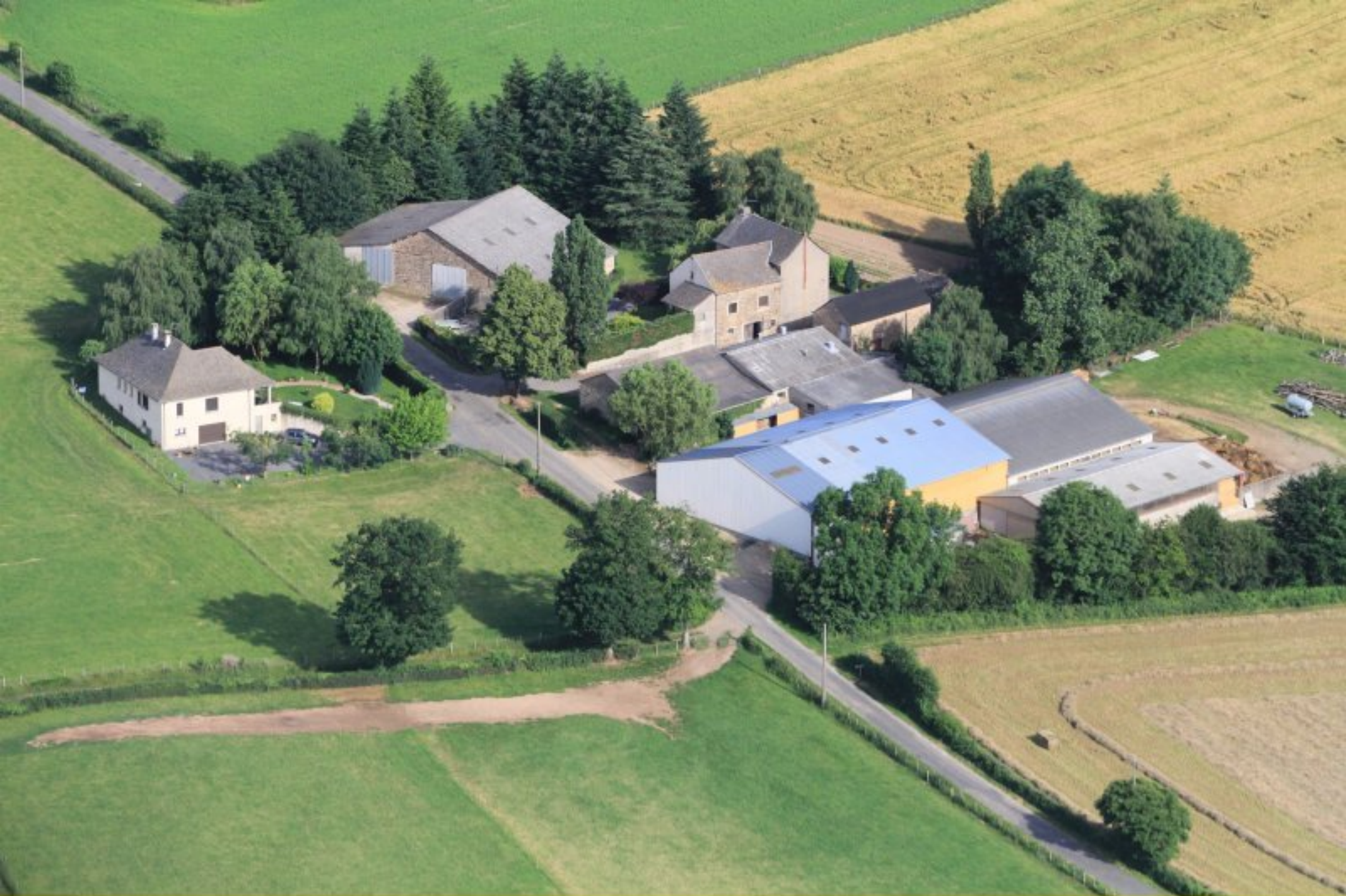
La Laurentie de Rullac - 20 juin 2012