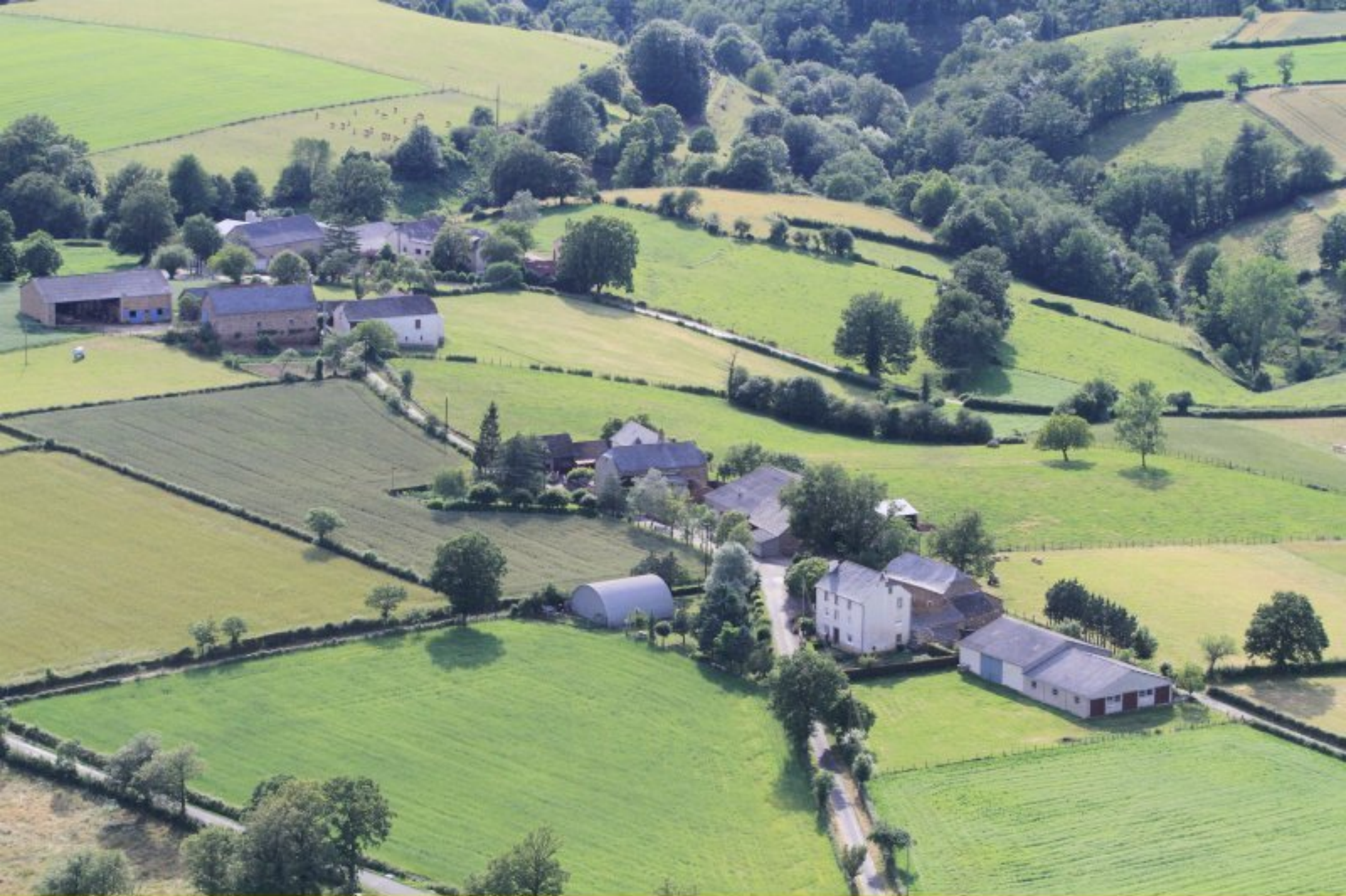
Le Féraldesq de Meljac - 20 juin 2012