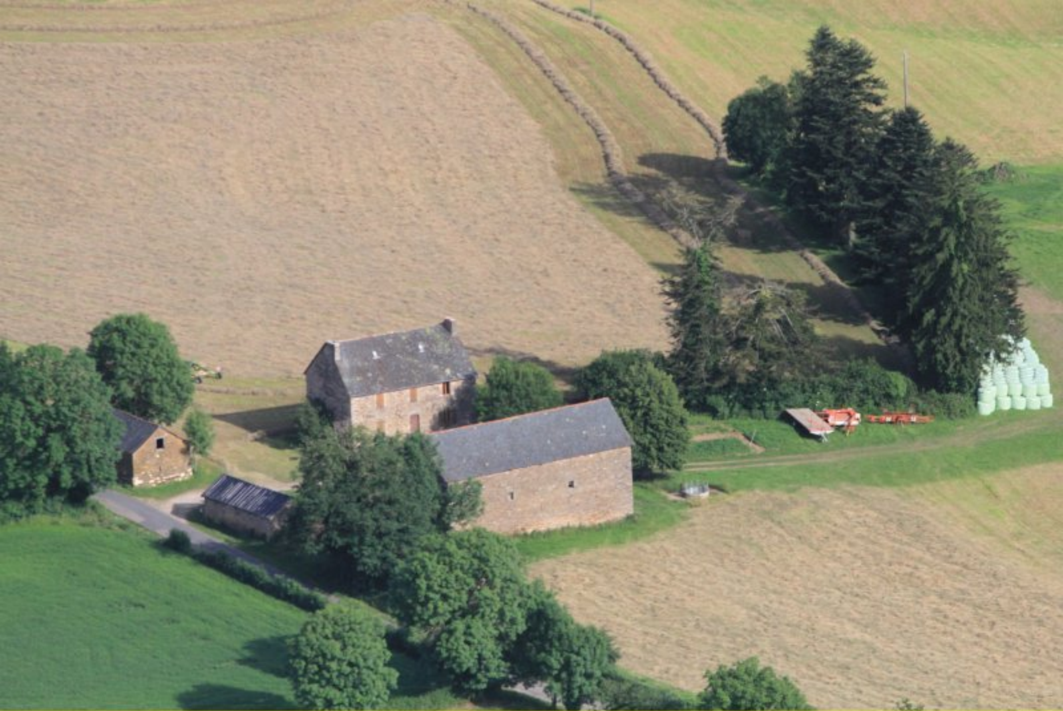
Le Puech Nau de Rullac - 20 juin 2012