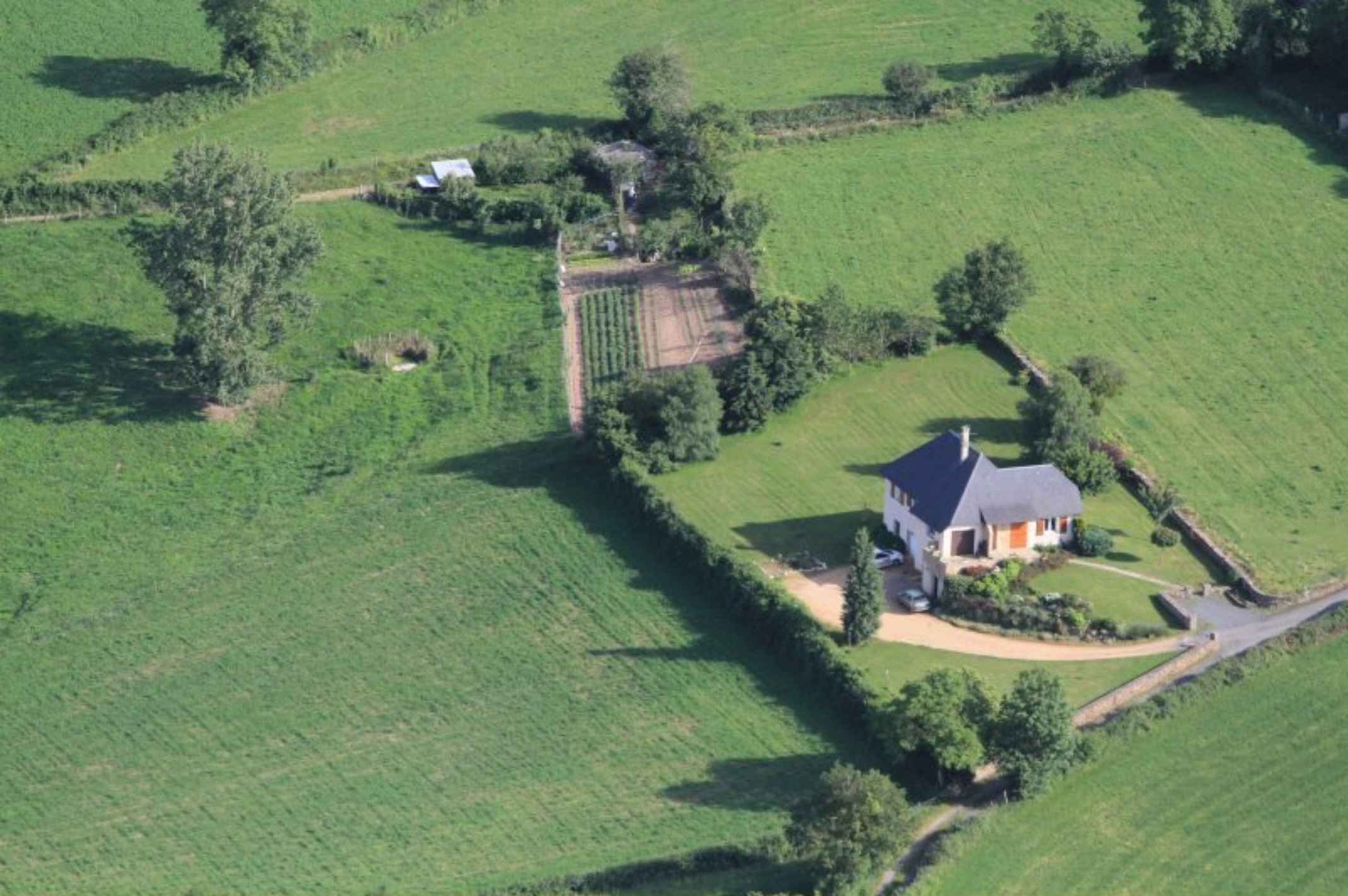
Le Bourg de Meljac - maison Pierre & Nelly Bousquet - 20 juin 2012