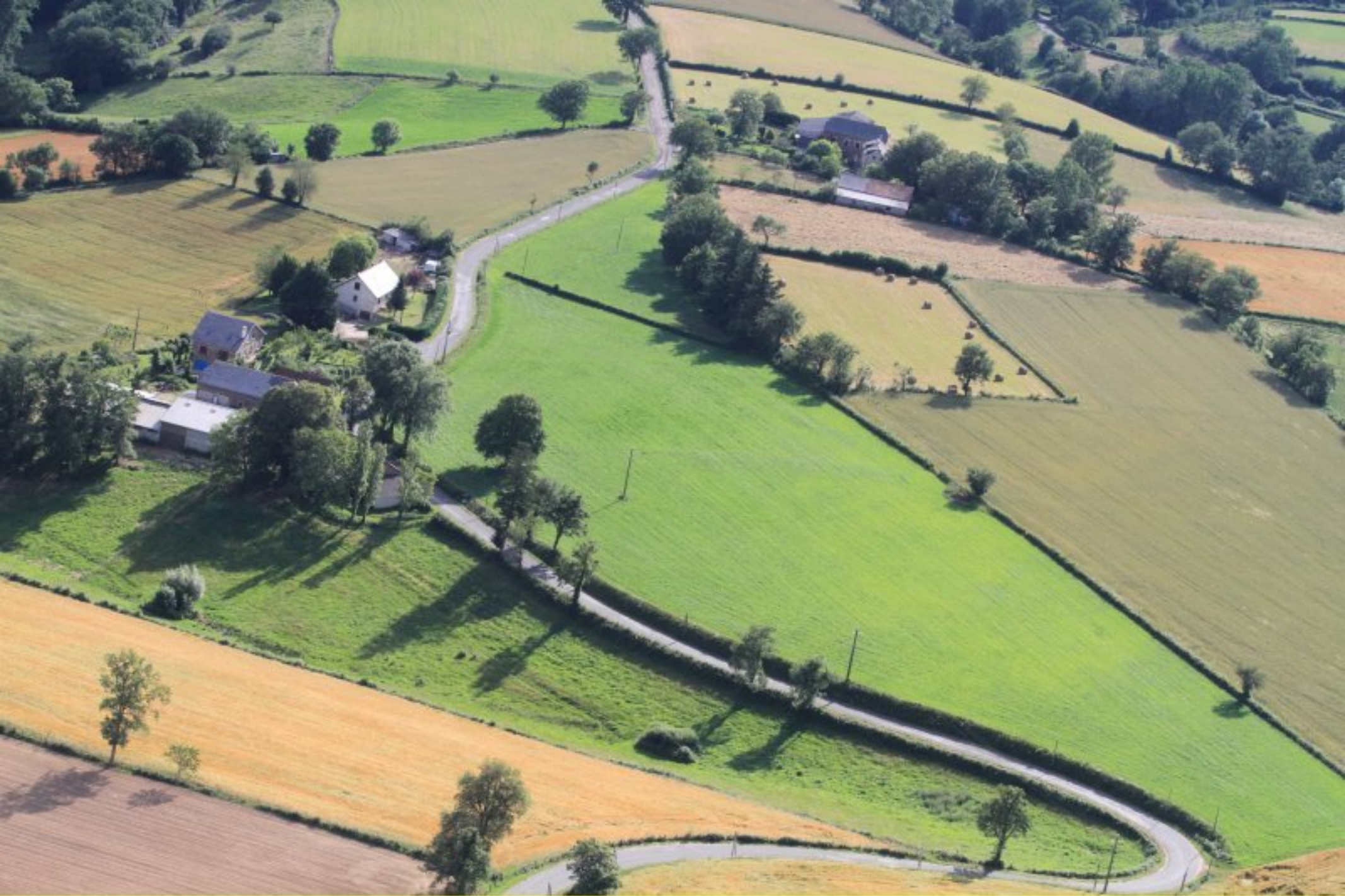
Les Combets et le Rial de Rullac (retour vers Meljac) - 20 juin 2012