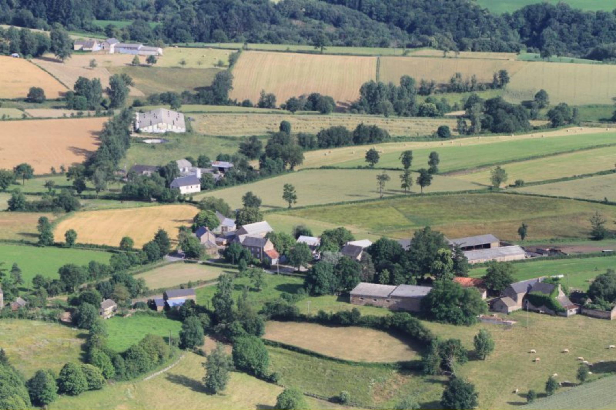
Le Mas Ricard de Meljac - 20 juin 2012