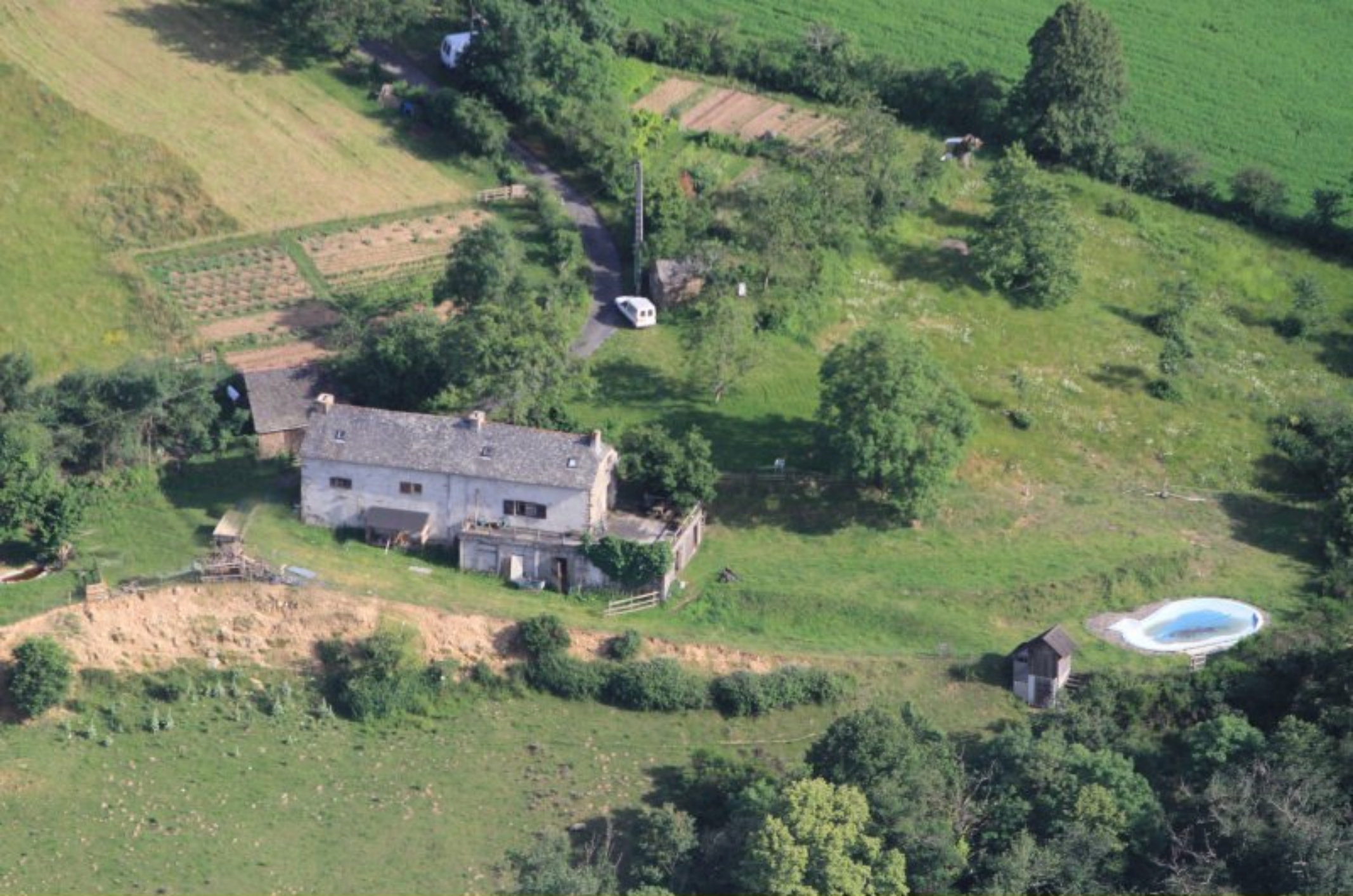
Cabrol de Meljac - 20 juin 2012