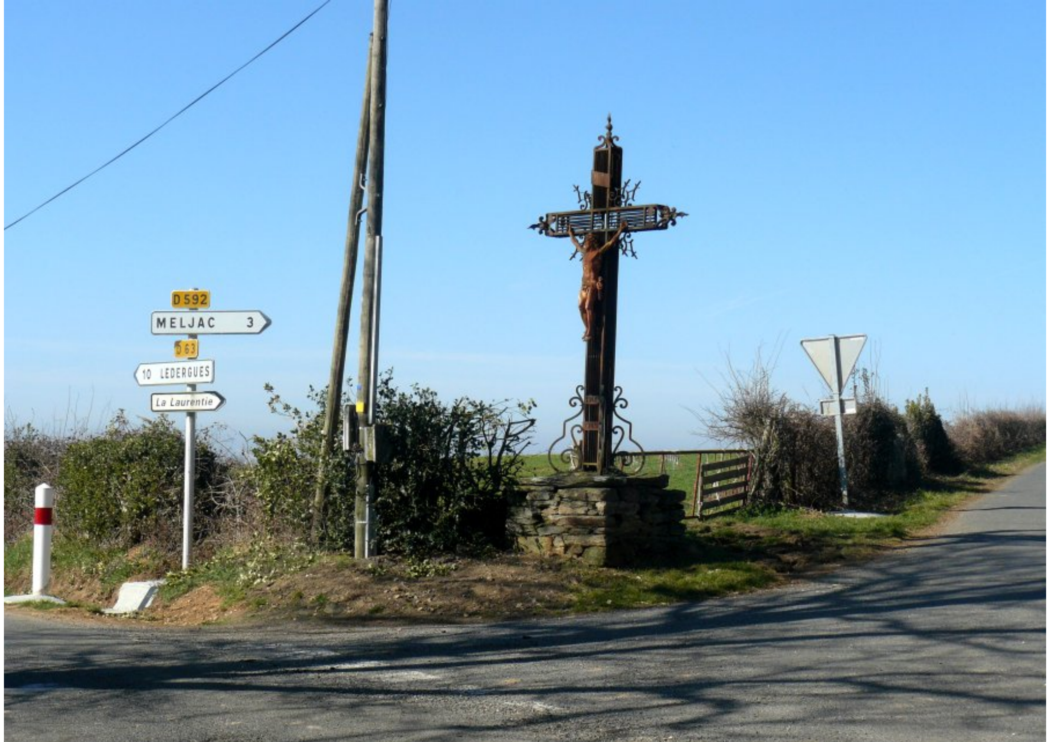
2012 => après déplacement des panneaux indicateurs