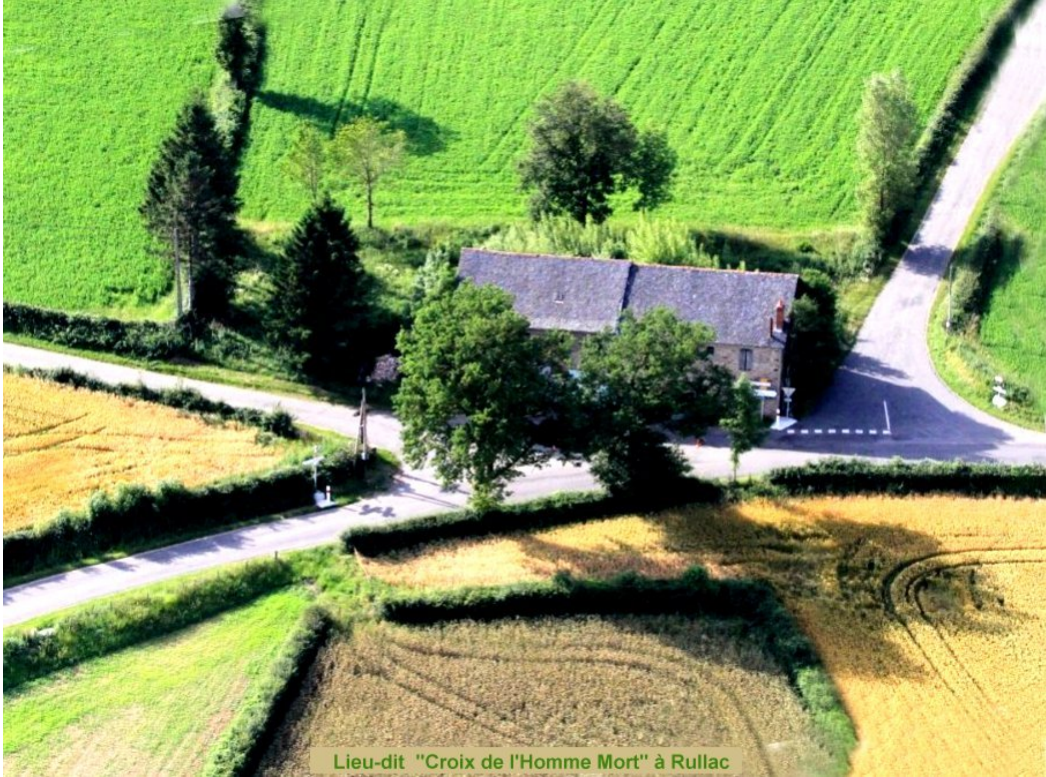
Lieu-dit "Croix de l'Homme Mort" à Rullac