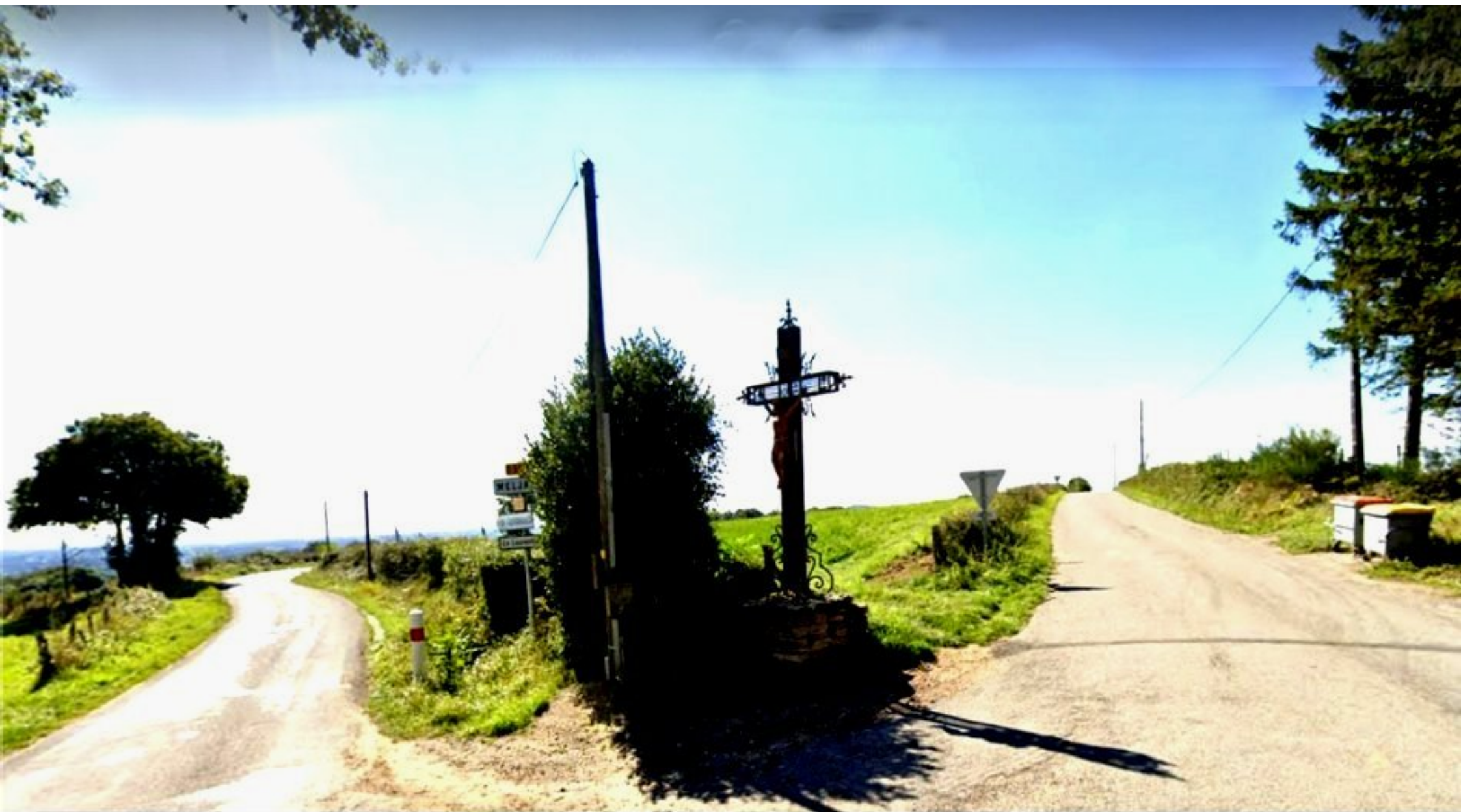
au carrefour de la D592 et de la D63, se dresse la "Croix de l'Homme Mort"