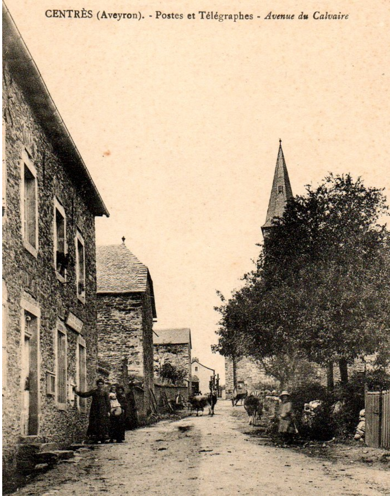
CENTRÈS (Aveyron). - Postes et Télégraphes - Avenue du Calvaire