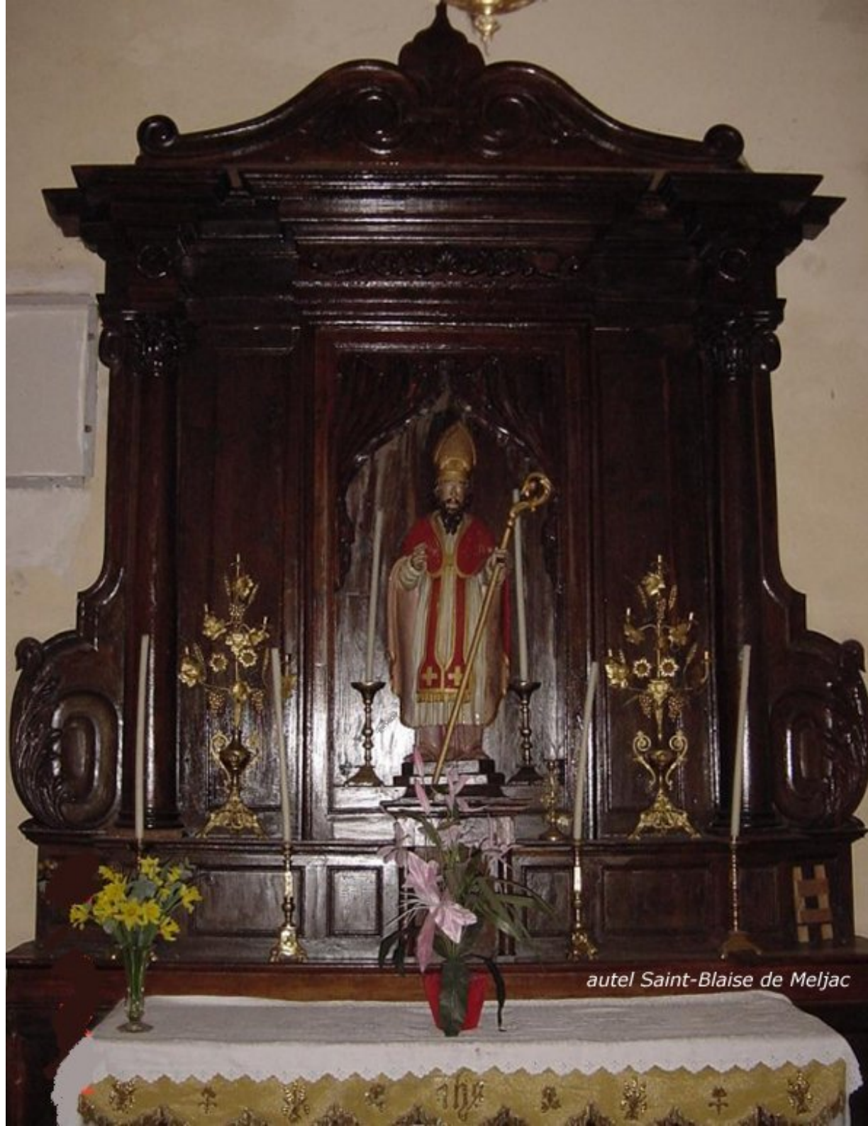
autel Saint-Blaise de Meljac