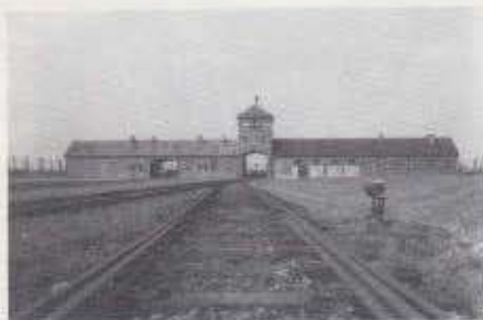
Birkenau : Entrée principale.

En tant que catholique, je sais tout ce que je dois à vos ancêtres. D'Israël, j'ai reçu la Parole de Dieu qui me fait vivre : chaque jour, je puise la force d'exister dans les Écritures qui sont d'abord les vôtres ; chaque jour je chante le Dieu auquel je crois avec les mots de vos Psaumes, qui ont façonné votre âme religieuse. J'ai appris à croire à la suite d'Abraham, j'ai goûté aux exigences de la liberté à l'école de Moïse, j'ai mesuré les enjeux de la paix et de la justice avec David et Salomon, j'ai découvert l'espérance à l'écoute de vos Prophètes, la pensée de vos Sages nourrit ma réflexion et mon action.