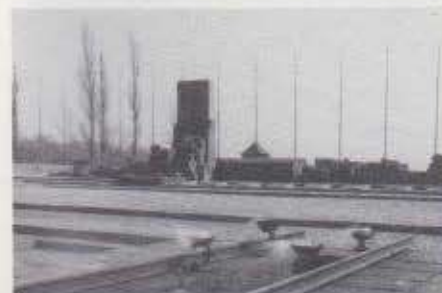
Auschwitz : monument aux victimes du fascisme.