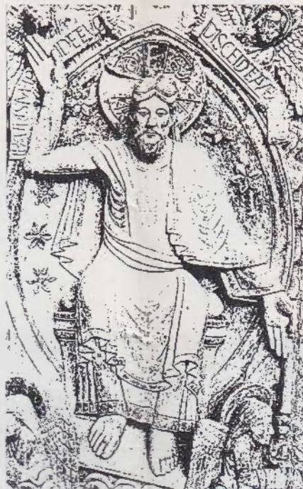
Christ du tympan de Conques.

Cet autre, dans la rue, portant sa petite fille sur le bras et qui l'écoute lui raconter ce qui vient de se passer à la maternelle.